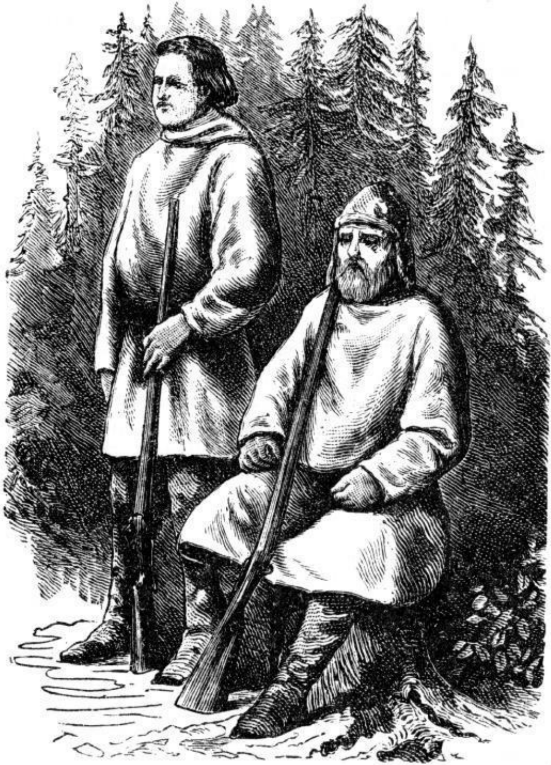
Зыряне. XIX век.

«Как оставь-ко-се, Орсе́нушко, ве́дь си́лушки, Вот по́ложь-ко-се на ихну-ту на глупо́сть тут» Перестал бо́ле ве́дь си́лушки-то би́ть же он. Все наро́д-люди ве́дь тут ужа́салисе. Тут по́дъехала ко́рета-то зо́лочёная, Тогда ве́дь взял-то го́сударь ца́рь Ива́н Васи́льевич