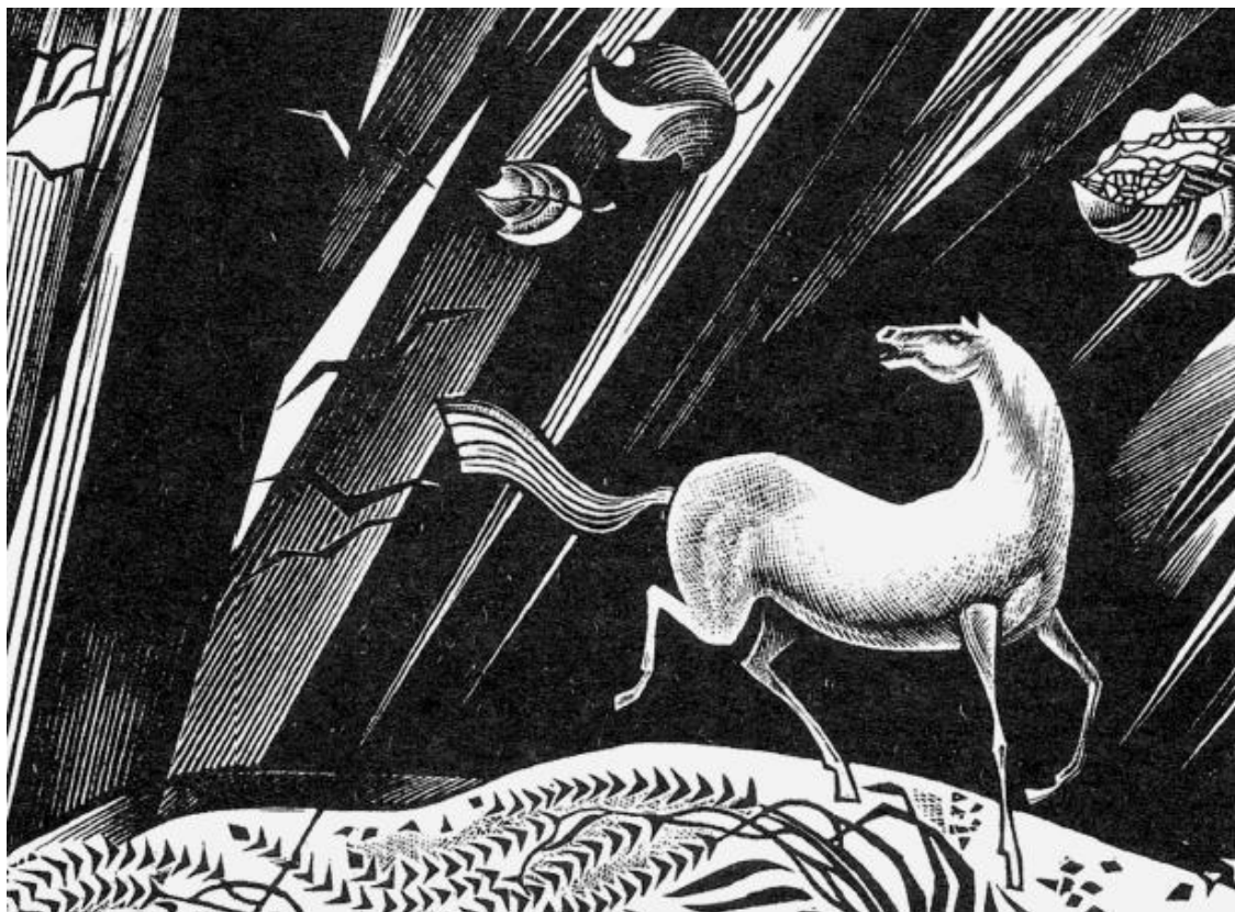
В. Сергеев. Лошадь в поле