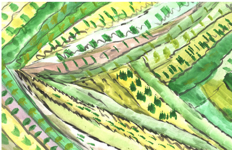
Рис. 3. Краски весной

Цивилизация на Красной планете очень развитая и опережает цивилизации многих других планет. Краснопланетяне достаточно агрессивны и замкнуты, кроме научных контактов и контактов по кораблестроению и астронавтике, они почти не имеют никаких связей с другими планетами. Они имеют свои научные центры на других планетах, но тесных контактов с жителями этих планет избегают. Сначала Дед думал, что жилища краснопланетян расположены в гротах и защищены от Полохов жаропрочными экранами. Но это оказалось не так. В специальных сооружениях в горах находились космодромы, предназначенные для взлёта и посадки толь-