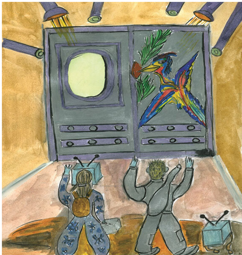
Рис. 13. На воротах были знак Зелёной планеты

– Девочка моя, мы спасены! – воскликнув удивленный дед схватил Пуэйлу за руку и потащил к воротам, – мы попали на космодром Зелёной планеты. Жители этой планеты, мирные и добрые люди, у них очень высокая цивилизация и лучшая