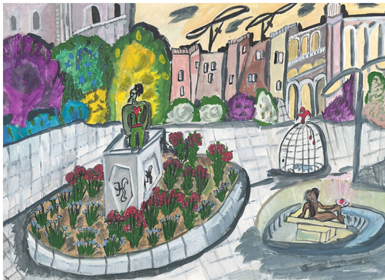
Рис. 8. Посередине площади стоял памятник первому

металла. Они напоминали дворцы, украшенные башенками, колокольчиками, звёздами.