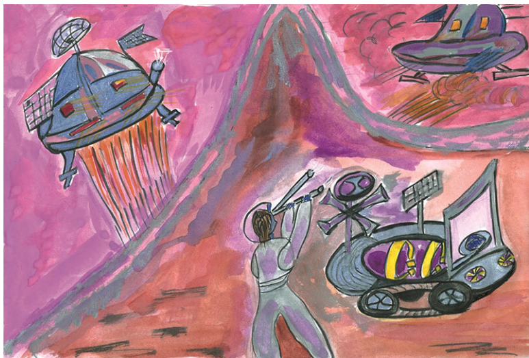
Рис. 6. Дед вёл наблюдение за взлётом кораблей