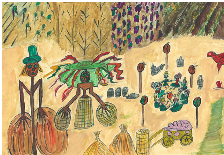
Рис. 4. Сбор урожая

ко родных кораблей. Для посадки и взлета космических кораблей других планет имелся один общий маленький космодром, на котором прибывшие корабли могли находиться ограниченное время. Для более длительного пребывания кораблей инопланетян, каждой планете разрешалось построить свою стоянку недалеко от общего космодрома. Но это было проблематично, так как не хватало ровной площади для размещения площадок всех желающих планет.