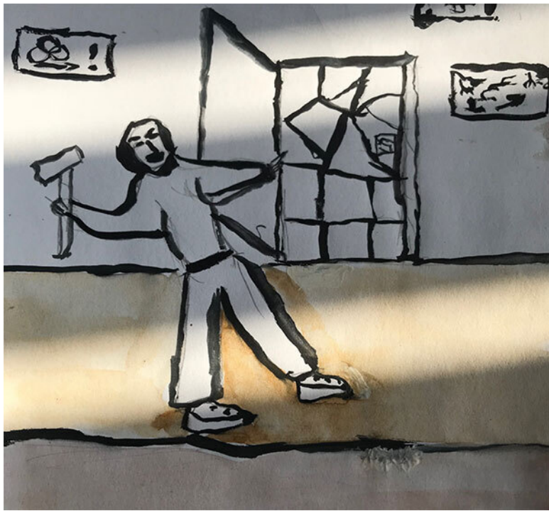
Рис. 7. Дед с силой ударил в правый угол двери

– Ударить в правый угол! – воскликнул доктор. – В таком случае, я иду с вами.