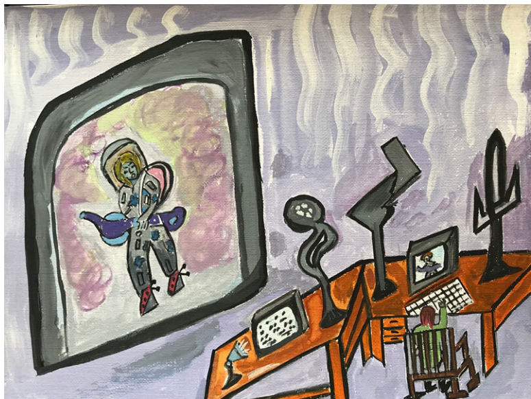
Рис. 14. Гуппи увидел одиноко, стоящую фигуру

Эти датчики выпускались в виде очень тонкой нити, с почти микроскопической стрелой на конце, которая входила под кожу человека или животного и глубоко проникала в тело. Датчики могли находиться там длительное время, срастаясь с живой тканью. Удалить такие датчики можно было только оперативным вмешательством.