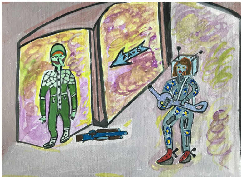
Рис. 1. Пуэйла увидела человека

Есть! Послышался щелчок, дверь отъехала в сторону. Повесив сумку за спину и, схватив жизнеобеспечение, Пупучка выбежала в коридор и замерла. У стены стоял человек, совсем непохожий на людей с известных ей планет. Он был обмякший, и от этого, казался маленького роста, с глазами стального цвета и абсолютно светлыми зрачками. Пуэйла вспомнила слова деда и очень испугалась. Рот человека, походил на щель, прорезанную от уха до уха. Редкие, почти красные волосы прилипли ко лбу. Щёки у человека провалились, а вместо носа свисала какая-то длинная «морковка»