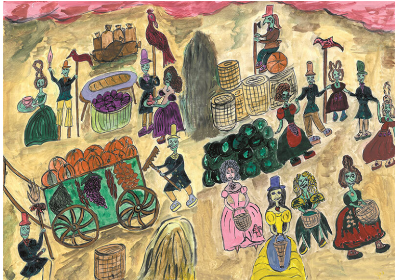
Рис. 5. Праздник «День Тыквы»

Дед работал над составлением подробной карты площадок взлёта и посадок кораблей, что не являлось особым секретом. Но стоило ему приблизиться на своём вездеходе к объекту, как он терял управление вездеходом, впадая в оцепенение. Это явление не поддавалось его объяснению. Особое беспокойство краснопланетян и неустанная слежка за экспедицией появились после того, как прилетел корабль с астронавтом с Земли – ученым-химиком доктором Вебером, доставившим для новой, нижней лаборатории оборудование для подповерхностного жизнеобеспечения, новейшие робо-