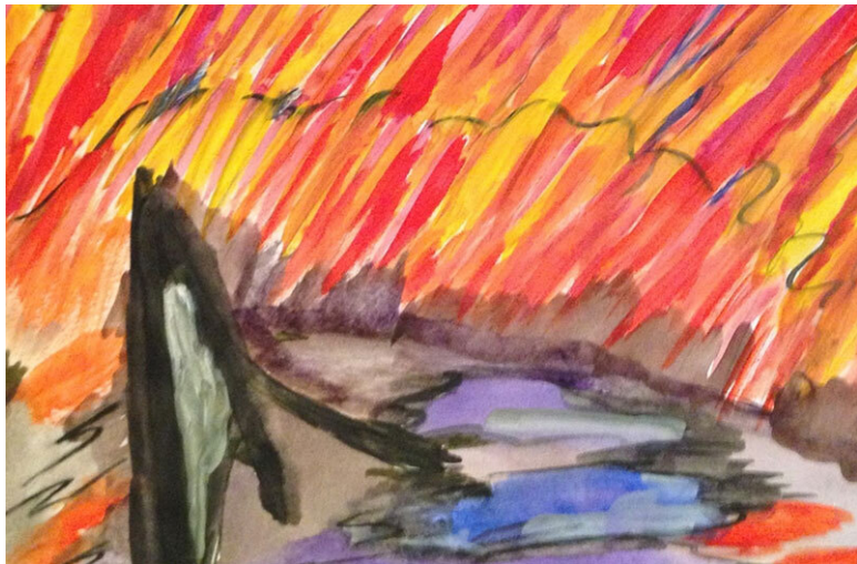
Рис. 2. Полохи

В период Весны-Теи происходит резкое изменение поверхности Красной планеты. Она представляет собой безбрежное пространство полей, на которые краски меняются, как в Калейдоскопе: от светло-жёлтого цвета, до желтого цвета, перемешивающегося со светло-зелёными и зелёными красками.