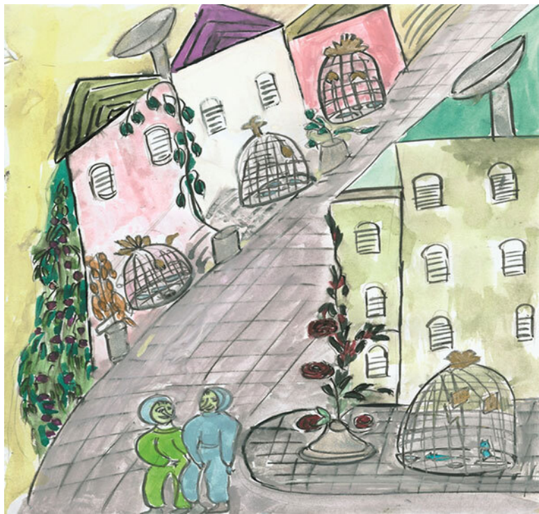
Рис. 9. Улица носила странное название – Улица Крыс

Отыскав знак вентиляции, они распахнули дверь и бросились к противоположной стороне. Проскочив в проём и захлопнув дверь за собой, они увидели надпись: «Дверь заблокирована». Еле отдышавшись, они бросились к себе. Мужчины знали, что за несанкционированное проникновение в под планетный город, их ждало пожизненное заключение, а