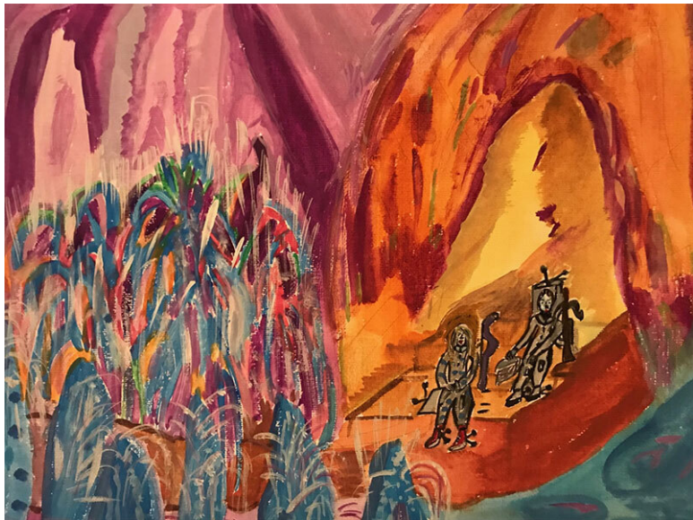
Рис. 11. – Ой! Какая красота! – воскликнула Пуэйла