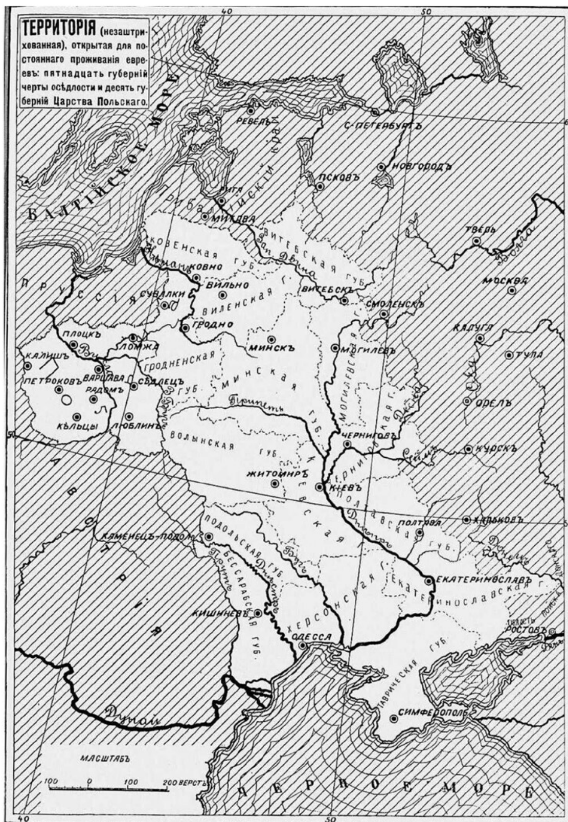
Рис. 3. Черта оседлости. Карта из книги Ю. И. Гессена «История евреев в России» (СПб.: Тип. Л. Я. Гинзбурга, 1914)

Вплоть до XIX века обвинения в ритуальном убийстве были мало распространены в Российской империи – по двум причинам: слабый интерес православных к ритуальным убийствам как таковым и отсутствие евреев, которым запрещалось проживать в империи до конца XVIII века. Однако в результате разделов Речи Посполитой при Екатерине II население страны