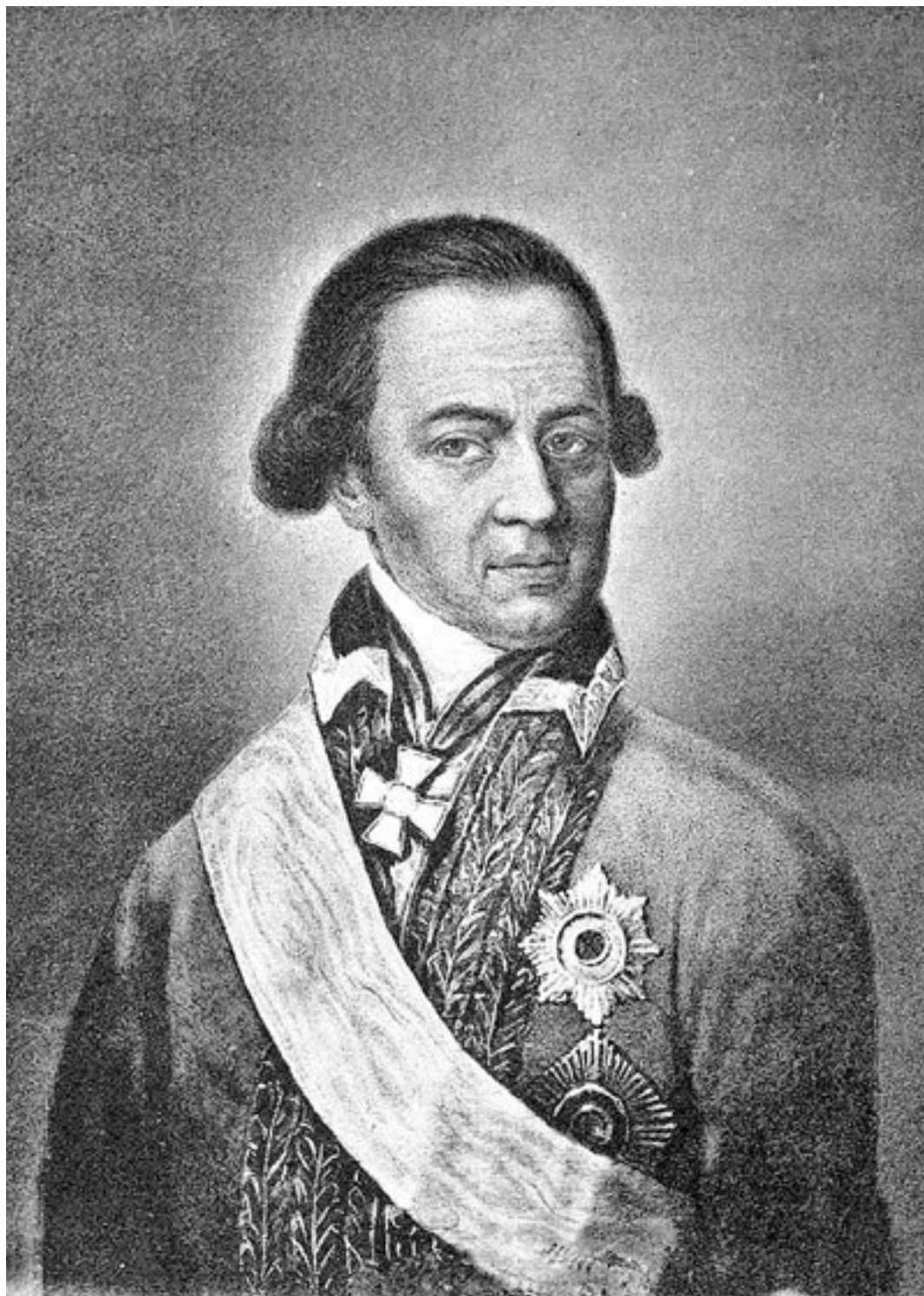
Абрам Петрович Ганнибал