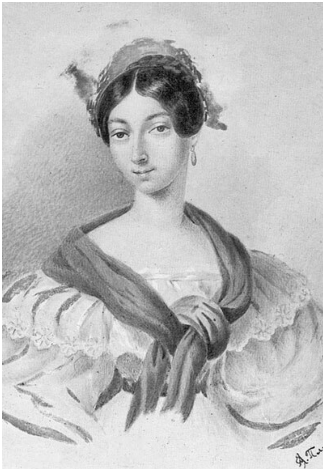
Ольга Сергеевна Павлищева (Пушкина)

Александр Сергеевич Пушкин родился в Москве в 1799 году, в четверг 26-го мая по старому стилю, то есть 6 июня по новому стилю. Это был день Вознесения.