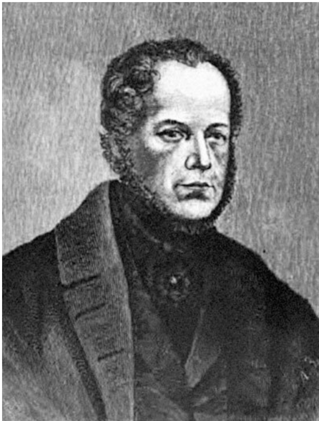
Лев Сергеевич Пушкин