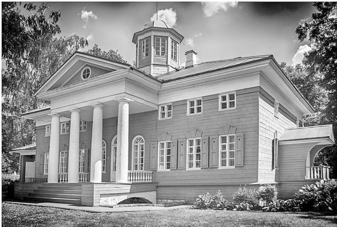
Усадьба в Захарово