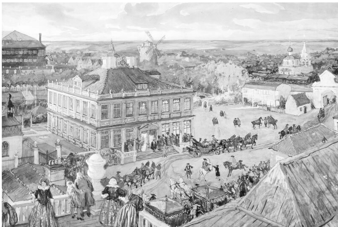
Вид На Немецкую слободу