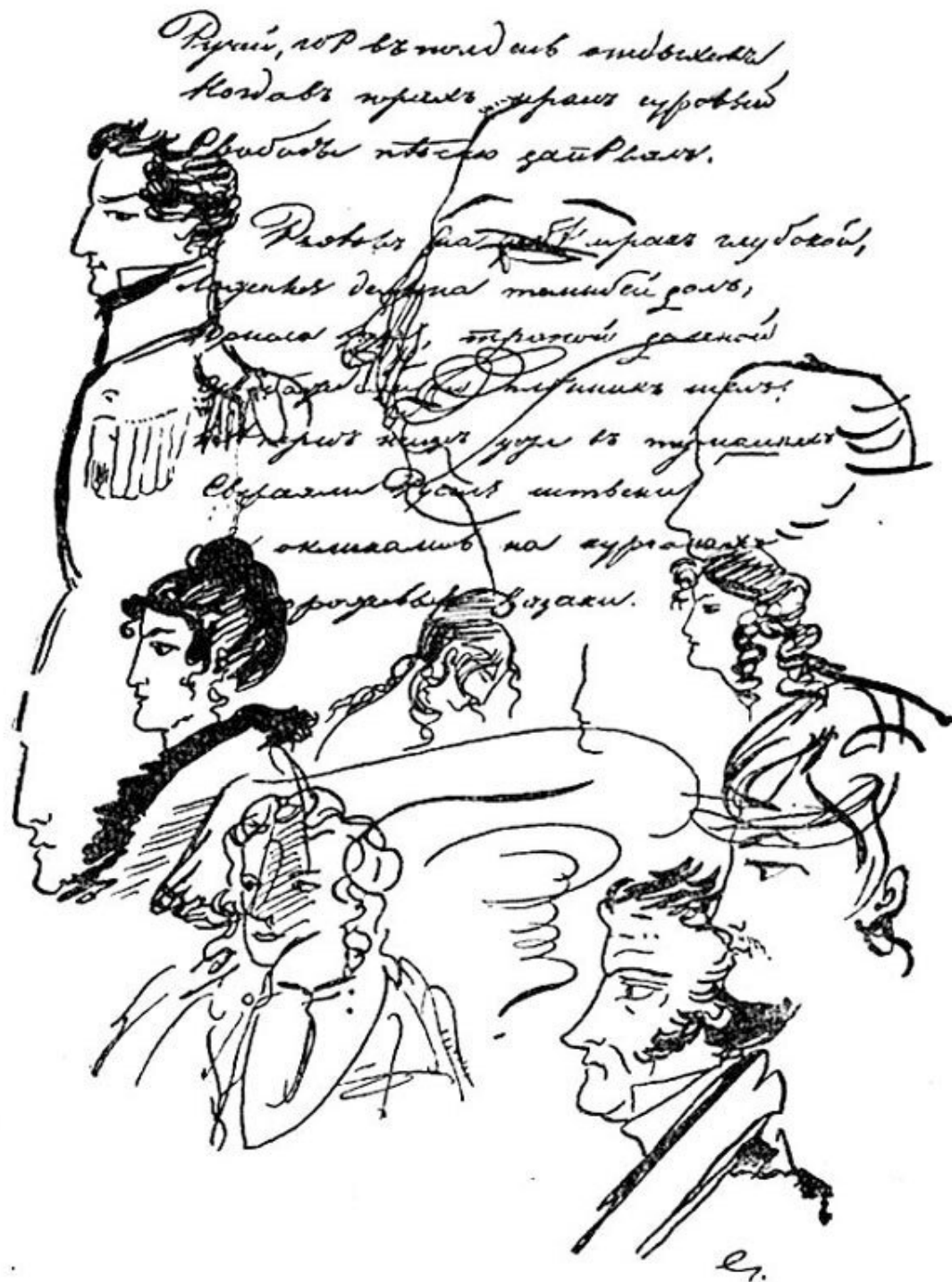
Рисунки А. С. Пушкина в рукописи «Евгений Онегин»