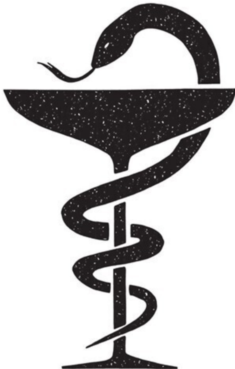
Баланс еды и яда: новое прочтение символа медицины. Рис. 2. Автор Дарья Виноградова