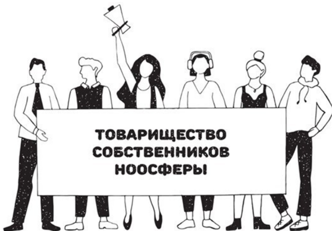
Рис. 3. Мы можем сделать мир лучше! Автор Дарья Виноградова

Мне представляется, что будущее станет отличаться от старой коллективизации осознанными объединениями свободных идей и взглядов.