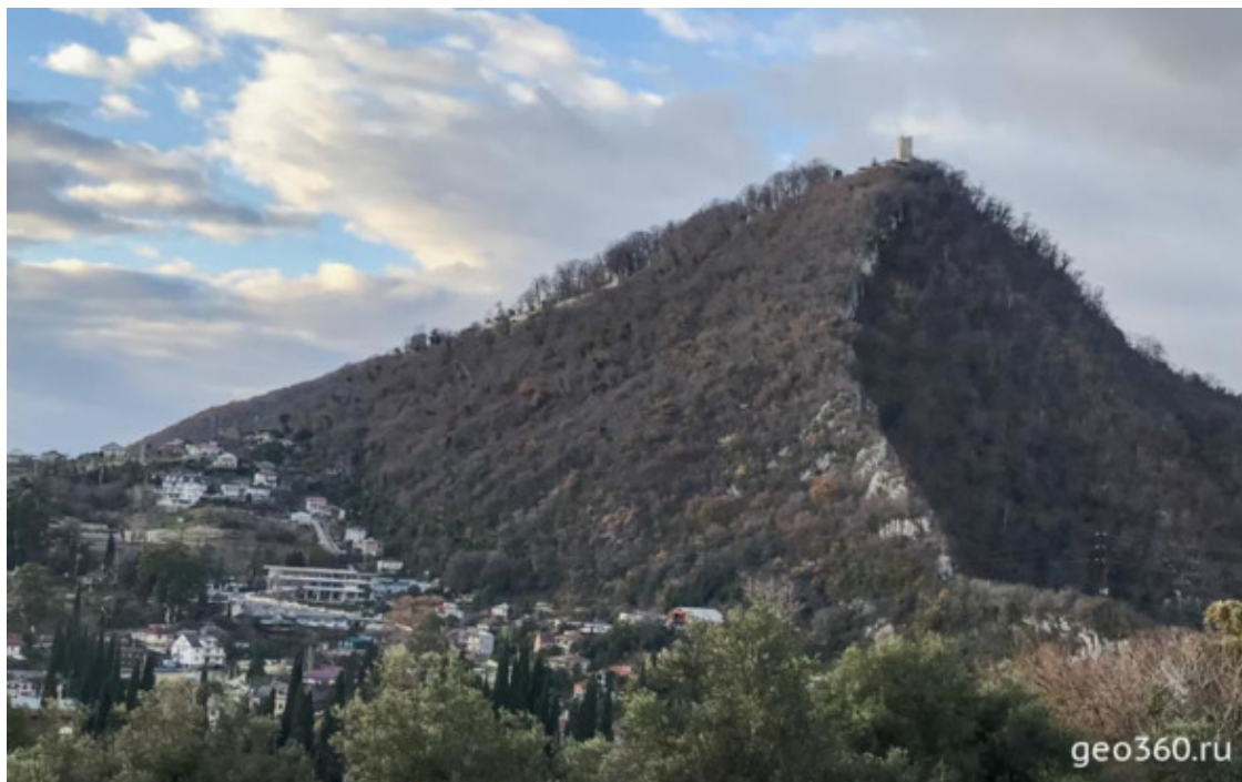
Иверская гора с крепостью Анакопия