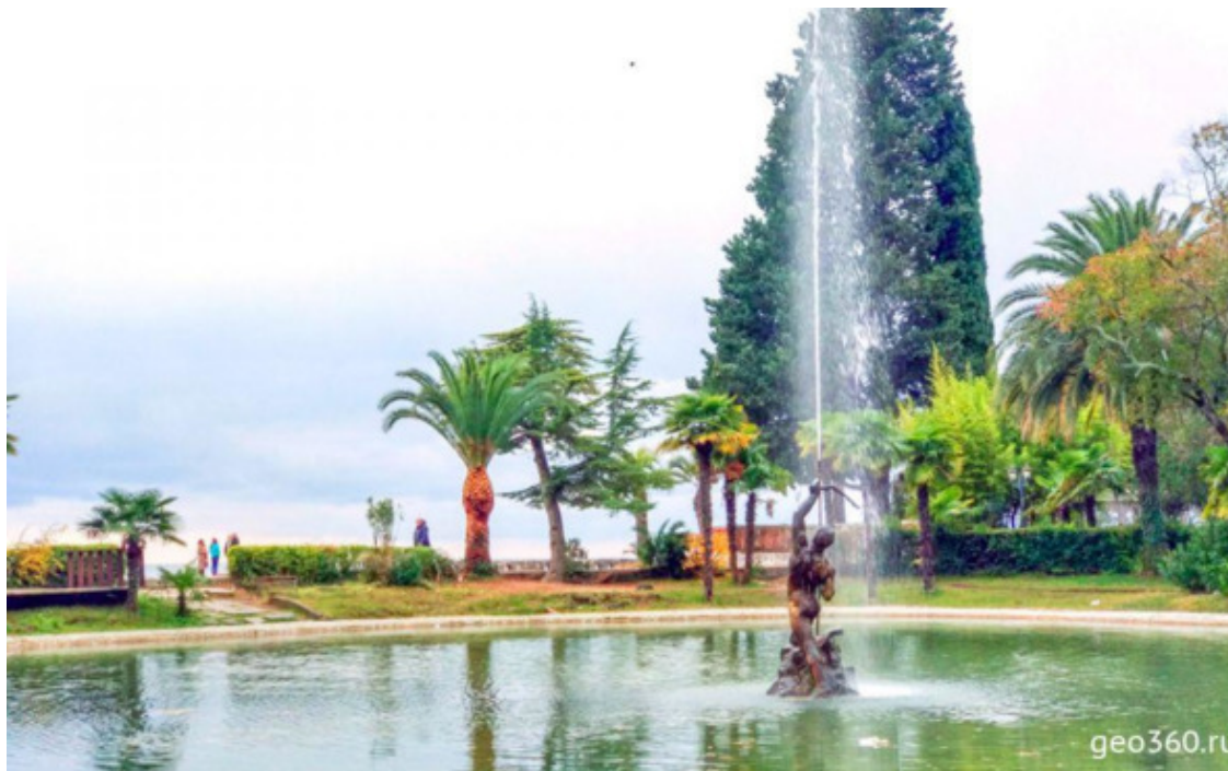
Фонтан «Стрелец» в Приморском парке Гагры

Приморский парк в Гагре – фактически ровесник этого черноморского курорта в Абхазии. Его еще называют Парком принца Ольденбургского. Здесь собраны деревья и растения со всего света.