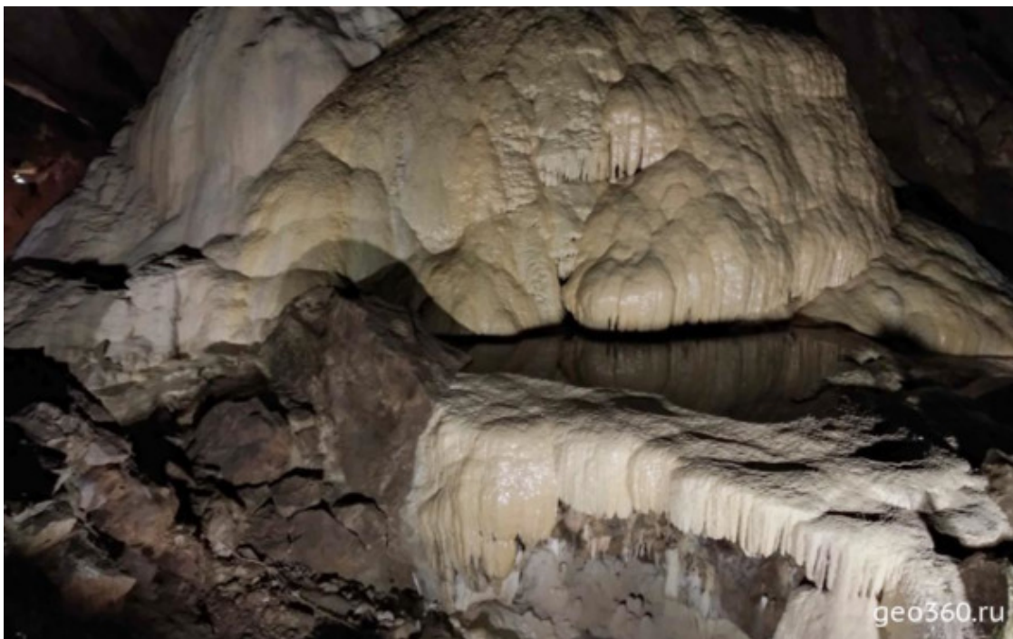
Карстовые натеки в Новоафонской пещере