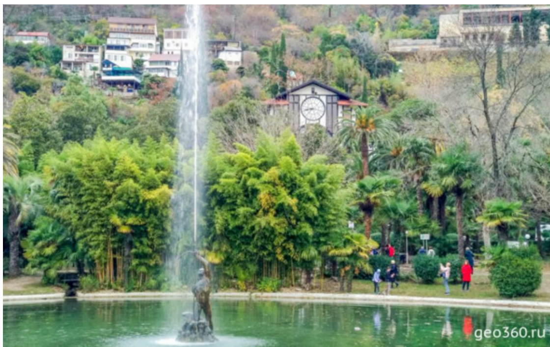
Приморский парк в Гагре