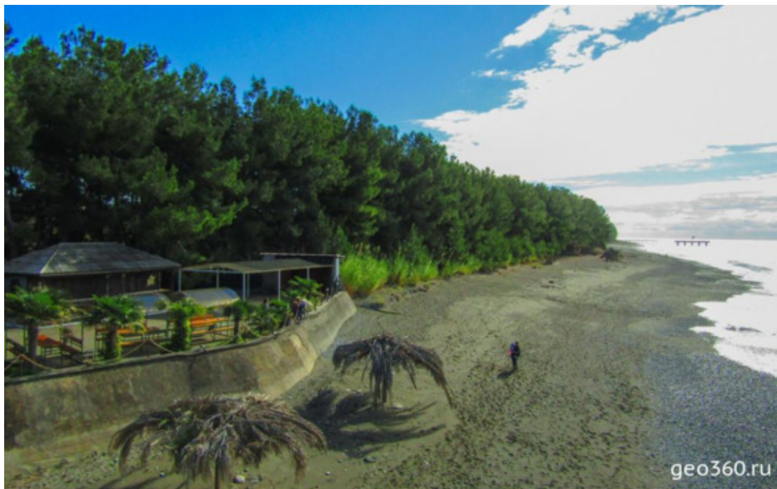
Реликтовая сосновая роща на берегу моря в Пицунде

Пицунда – небольшой курортный городок в Абхазии. Он очень спокойный, т.к. находится в стороне от Сухумского шоссе, на одноименном мысе. Фишка курорта – морской воздух, насыщенный ароматом хвои и смол, ведь на самом берегу моря здесь растет реликтовая сосновая роща. Это удивительное и необычайно удобное место для пляжного отдыха. Пляжи здесь широкие – вдоль кромки моря тянется полоска гальки, а на песчаный пляж падает тень от вековых сосен.