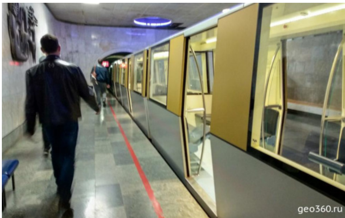
Подземный поезд в пещеру