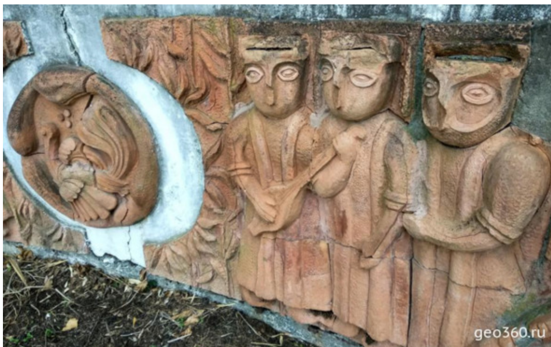
Национальные мотивы отражены в барельефах на набережной Гагры