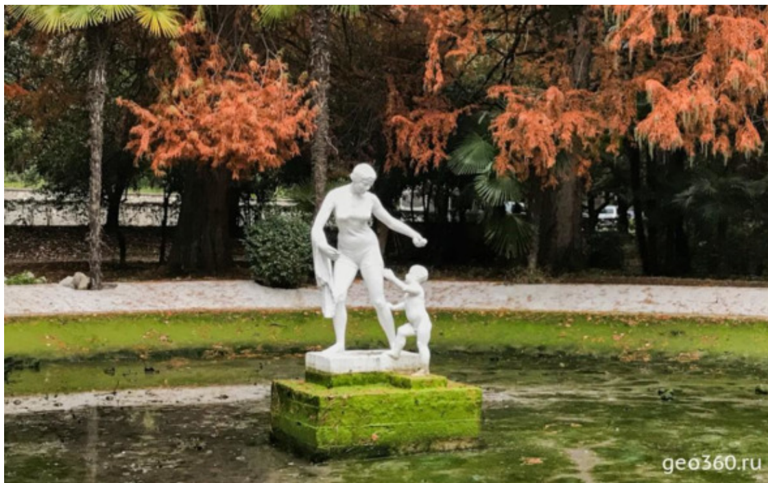
Фонтан в Приморском парке

Парк был заложен в 1901 году и его обустройство продолжалось почти 12 лет. Протяженность парка около 1 км, а площадь примерно 14 гектаров.