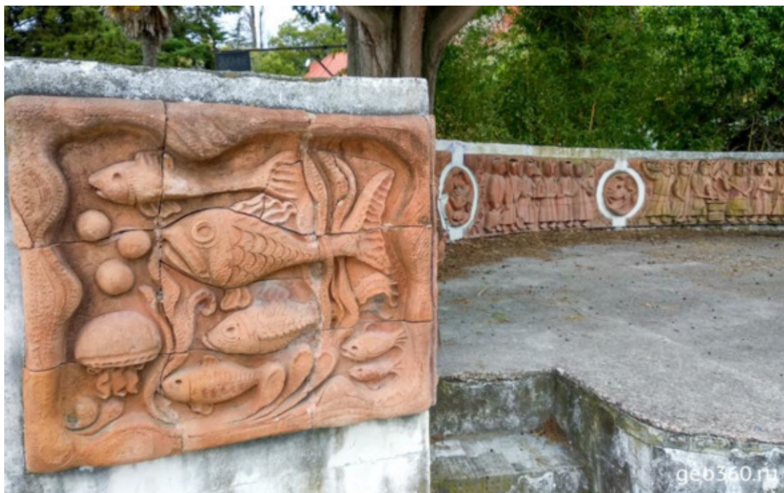
Барельефы советских времен в парке

В парке несколько водоемов, которые украшены скульптурами и фонтанами. Напротив ресторана «Гагрипш» на высоту 15 метров бьет струя из стрелы лучника. Этот фонтан «Стрелец», наряду с белоснежной колоннадой, является одной из визитных карточек Гагры.