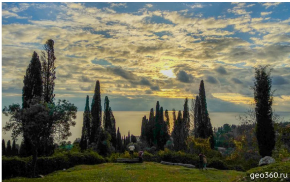
Закат в Новом Афоне

Старейший город на черноморском побережье Абхазии – Новый Афон. Когда-то поселение здесь называлось Анакопия и было столицей Абхазского царства. Сейчас этот небольшой город с населением всего 1,5 тысячи человек стал туристическим магнитом, известным далеко за пределами Абхазии.