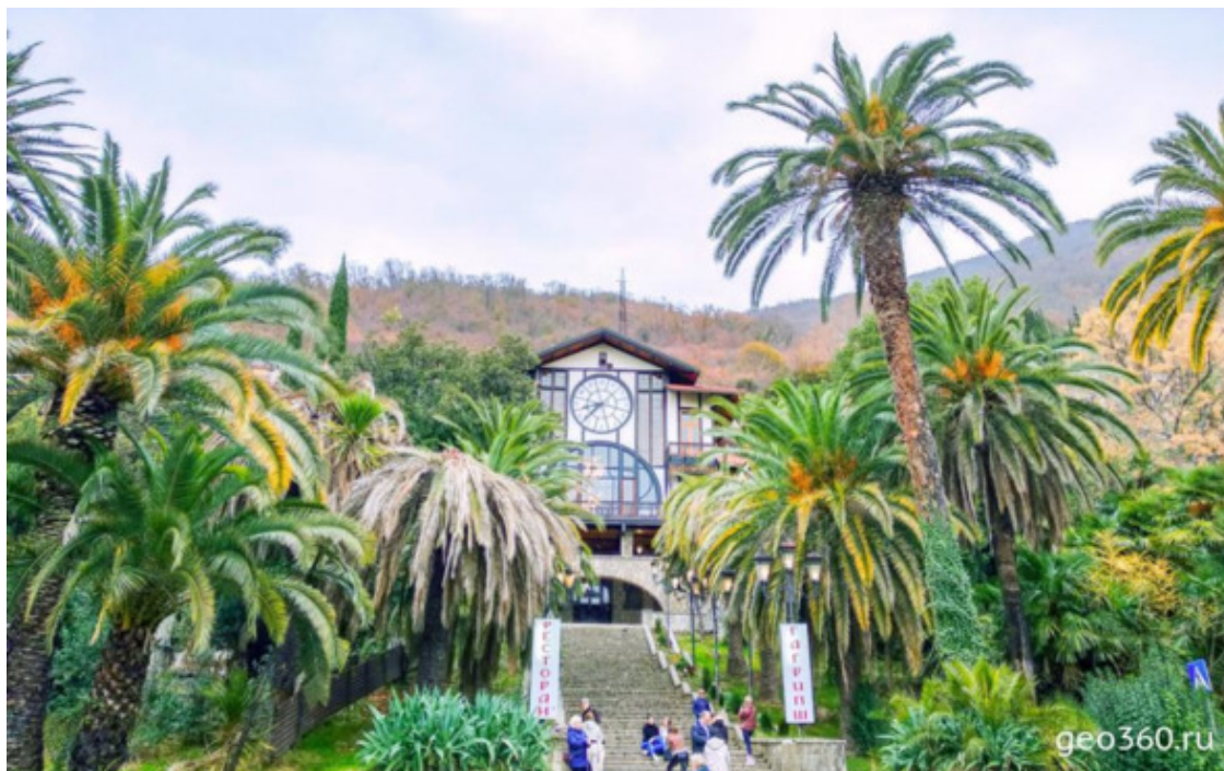
Исторический ресторан «Гагрипш» в Гагре

Гагра – первый и до сих пор самый популярный курорт в Абхазии. Он был основан еще в начале 20 века по приказу императора Николая II. В советское время здесь была всесоюзная здравница, символ которой, растиражированный на открытках, – белоснежная колоннада.