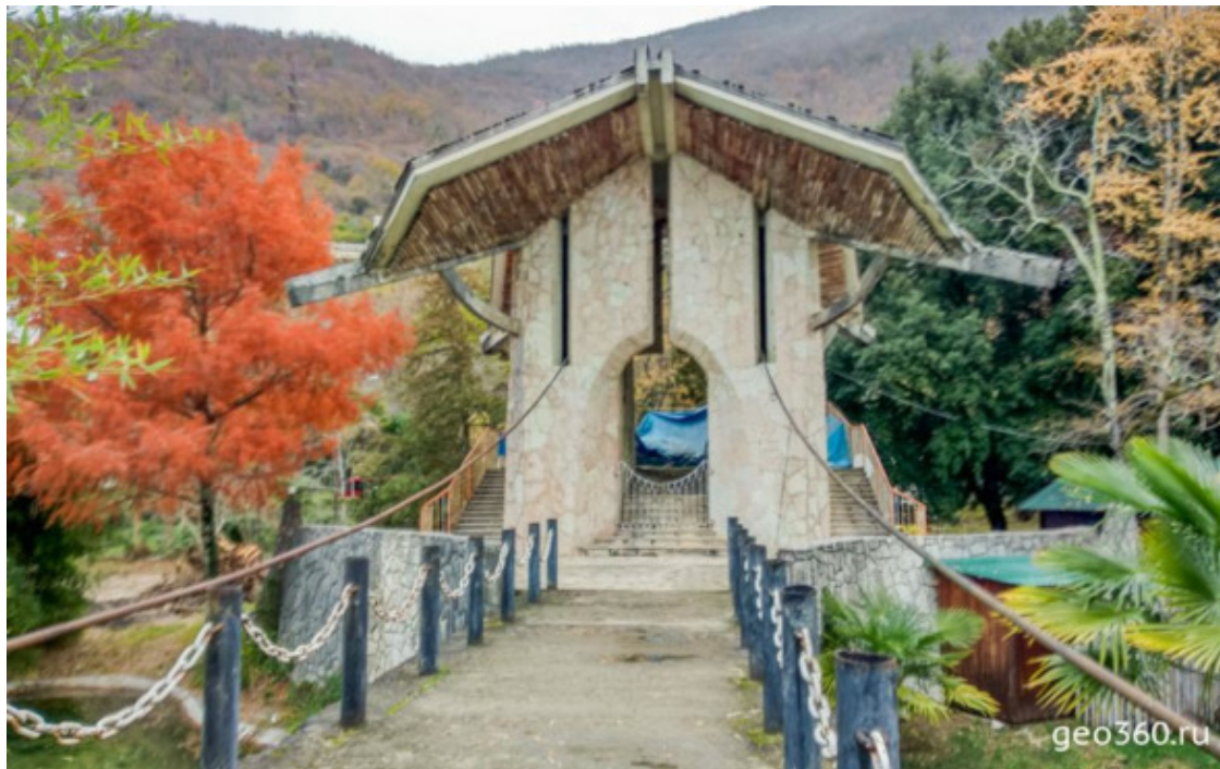
Станция заброшенной канатной дороги в парке Гагры

Тогда же, в 1935 году, в парке была построена канатная дорога. Она позволяла отдыхающим из пансионата «Скала» быстро добраться до побережья.