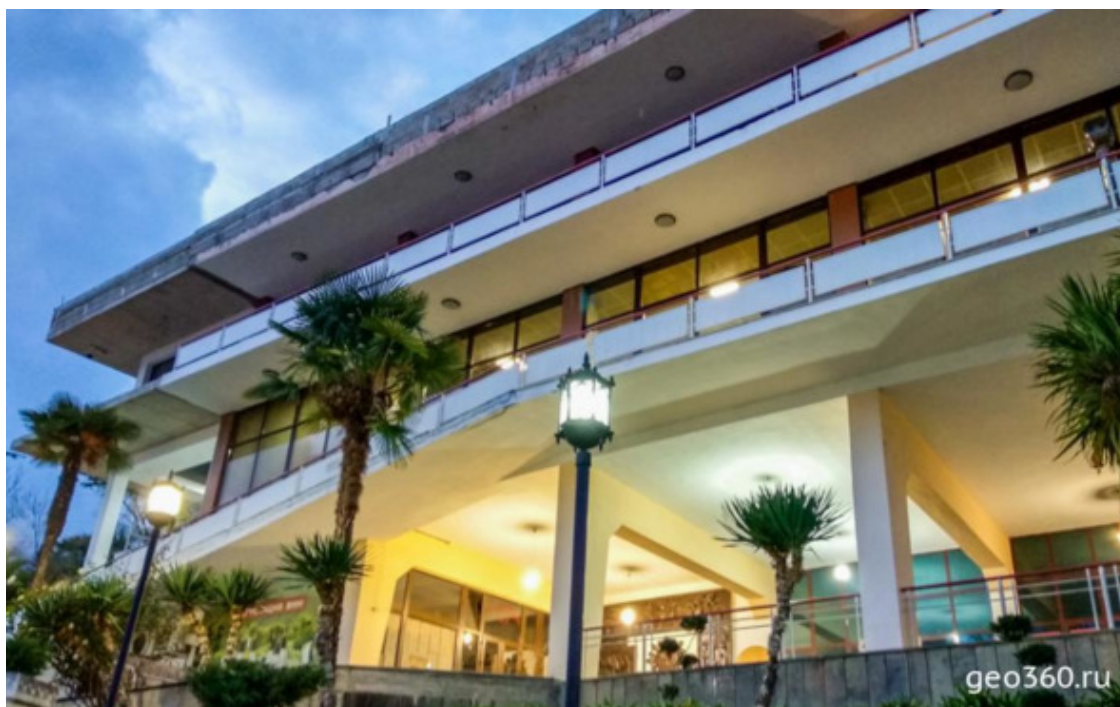
Здание со входом в Новоафонскую пещеру

Эта достопримечательность – гордость Абхазии и практически единственная, поддерживаемая в идеальном состоянии. Здание со входом в пещеру свежотремонтировано, а в самой пещере на перилах, несмотря на влажность, нет ни единой точки ржавчины. Посещать её не только интересно, но и приятно.