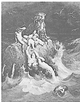
Великий потоп (с гравюры Альбрехта Дюрера)

Семиты, хамиты, шумеры, вавилоняне, касситы, хетты, ассирийцы, потом персы, греки, парфяне, турки... «Иных уж нет, а те далече». А вообще, Месопотамия всегда была настолько густонаселенным и многонациональным регионом, что подробная демографическая опись находится далеко за рамками данного рассказа, тем более что выглядели эти народы более-менее сходно: в меру загорелые, не лишённые привлекательности, хотя и не очень высокие, с рельефными орлиными носами, темными волосами и глазами (правда, шумеры несколько отличались — мужчины предпочитали брить головы наголо и, судя по изображениям, были чуть более предрасположены к полноте). Так что для краткости будем всех их называть просто древними месопотамцами. Тем более что вышеперечисленные народы многое перенимали друг у друга в культуре и языках, да и обмен генофондом осуществляли охотно и постоянно.