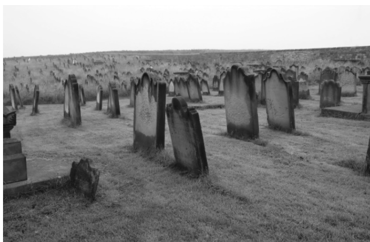
Рис. 4. Ворота в рай для христиан города Уитби (Англия) Глава

Проще говоря, мозг – органический компьютер с электромагнитными нейронами, посылающими сигналы с удивительной скоростью, в чем мы убедимся в последующих главах. Некоторая информация передается быстрее, чем скорость света. Есть и другие органы, вырабатывающие гормоны, в зависимости от передачи информации нейронами. Передача информации нейронами зависит от деятельности, которую мы ведем в данный момент – варим кофе, молимся, – или от того, какое влияние мир оказывает на нас, например, влияние электромагнитных импульсов солнечной активности. Каждая деятельность или мысль создает определенное множество разрядов, вырабатывающих гормоны различными способами и в различных количествах. Эта смесь – алхимический коктейль, по-видимому, в настоящий момент не доступный нашему пониманию. Однако с развитием науки человечество расширяет знания о самом себе, и благодаря редукционизму мы открываем различные элементы целого. Из этих отдельных кусочков затем составляется целостная картина.