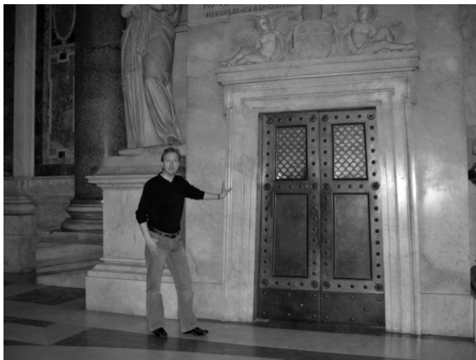
Рис. 7. Автор у «ворот» римского Папы к небесам (собор Св. Петра, Рим).

Можно доказать, что эти сходства носят универсальный характер, и именно их можно встретить у разных народов, начиная с народов Америки и заканчивая народами Ближнего