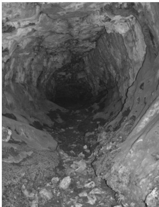
Рис. 2. Древний вход в подземный мир: скала Крессвел (Англия).

Христианское понятие рая – результат сплава множества представлений о небесах.