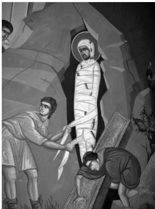
Рис. 3. Христос, которого кладут в могилу для перехода в потусторонний мир, Кикосский монастырь, Кипр