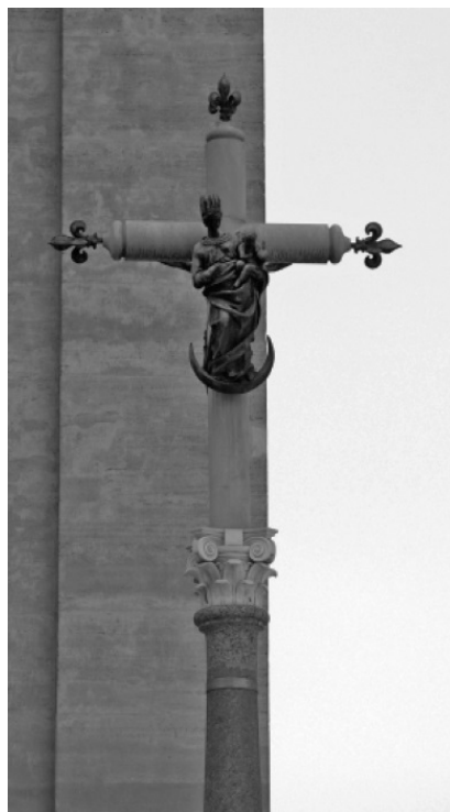
Рис. 5. Дева Мария и младенец Христос в перевернутом полумесяце на кресте; совершенный союз противоположностей, демонстрирующий просветленного ребенка, Рим

Совершая паломничества в эти места, люди воссоединялись с Богом (Вселенной, Землей) и мысленно представляли себе то, что с ними происходило.