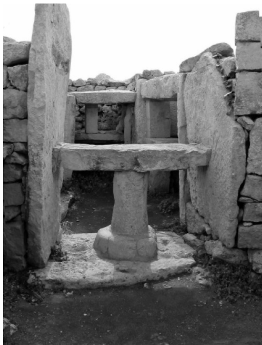
Рис. 6. Каменный алтарь в Мнайдре (Мальта), используемый в обрядах для установления контакта с потусторонним миром. Иаков положил голову на каменное изголовье и вознесся на седьмой уровень небес