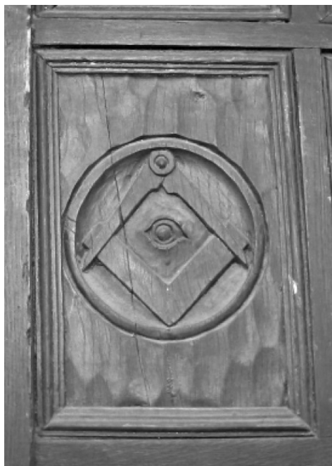
Рис. 9. Божий глаз в центре масонского угольника и циркуля (Солсбери).

К настоящему моменту мы выяснили, что женщина-шаман входит в потусторонний мир и является доминантной силой, в то время как мужчина-шаман может входить, но лишь выполняя указания духов или женщины. Это можно проследить в истории религии; это часто встречается в шаманском мире.