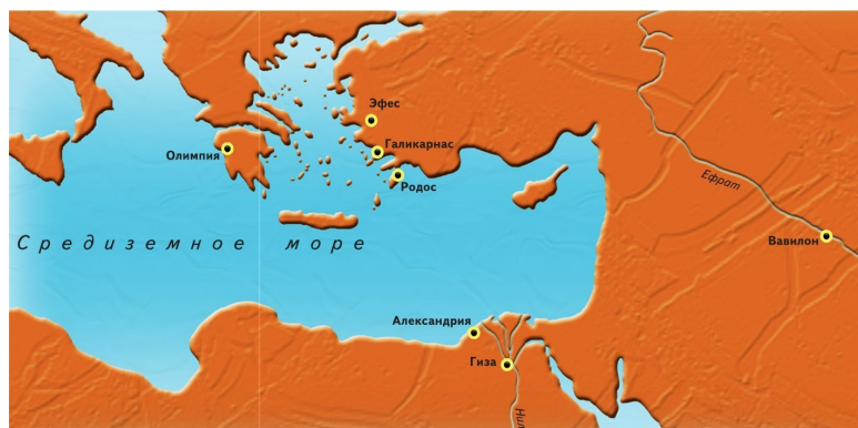
Карта Семи чудес света

глядности эти семь богов изображались как семиглавое божество. Считалось, что все небо подчиняется семи планетам, а поэтому почти во всех религиозных системах мы находим семь небес. Сама астрономия определяла особое отношение к семерке.