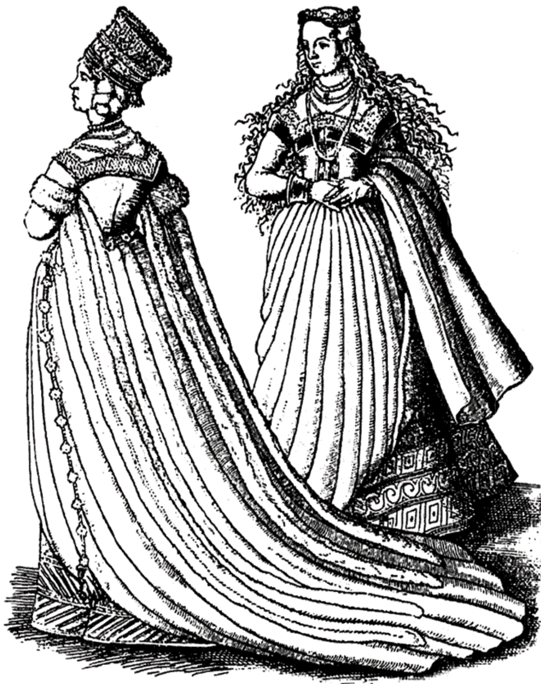
Женские моды. XVI в.

Женской красоте посвящены самые обстоятельные, детальные и многочисленные описания. И это понятно. Не только потому, что творческая тенденция есть результат мужской активности, чаще встречаются конструкции женской красоты, созданные мужчиной, чем идеалы мужской красоты, созданные женщиной, а главным образом потому, что мужчина в принципе агрессивное, а женщина – пассивное начало. Правда, женщина тоже добивается любви мужчины, и даже в еще более сосредоточенной форме, чем мужчина добивается женской любви, но она никогда не делает этого ясно и отчетливо, как мужчина. Мужчина облекает поэтому свои требования относительно физической красоты женщины в самые ясные и точные описания. Тридцатью шестью достоинствами – по другим оценкам только восемнадцать, двадца-