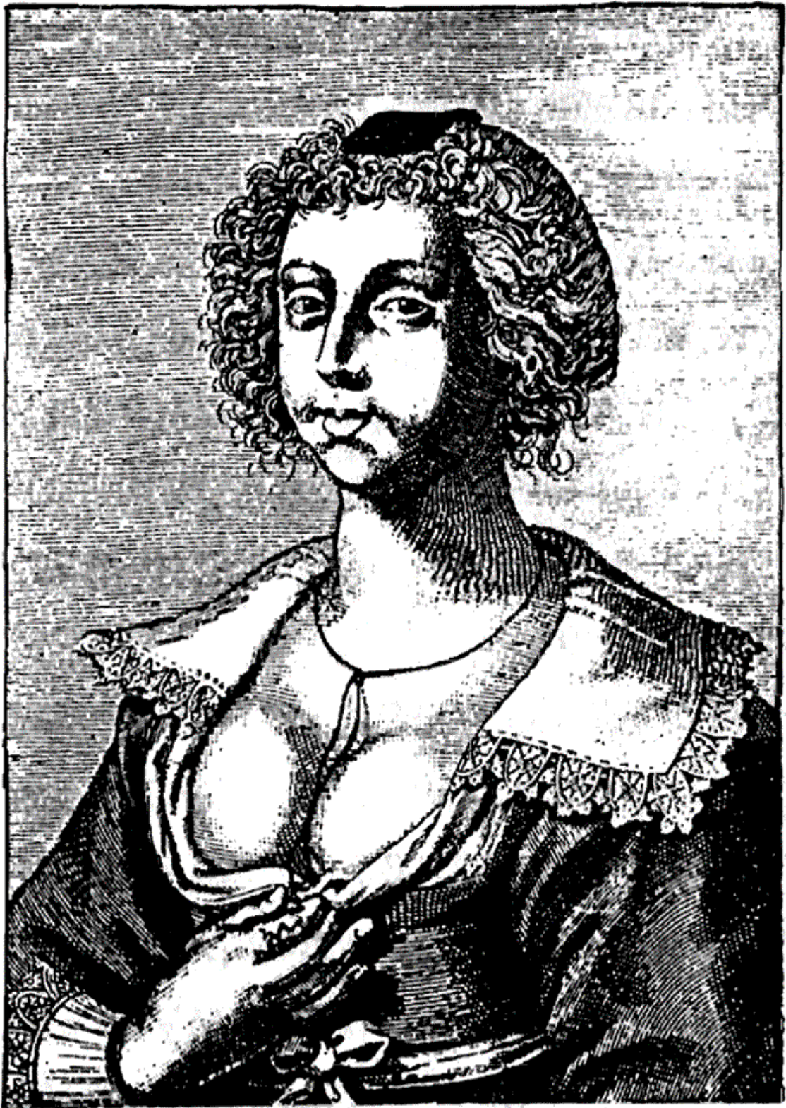
Костюм голландской проститутки. XVII в.

Этот кодекс красоты был повсюду облечен в форму стихотворных афоризмов и дошел до нас в целом ряде вариантов, притом иногда с иллюстрациями. Достаточно привести один пример.