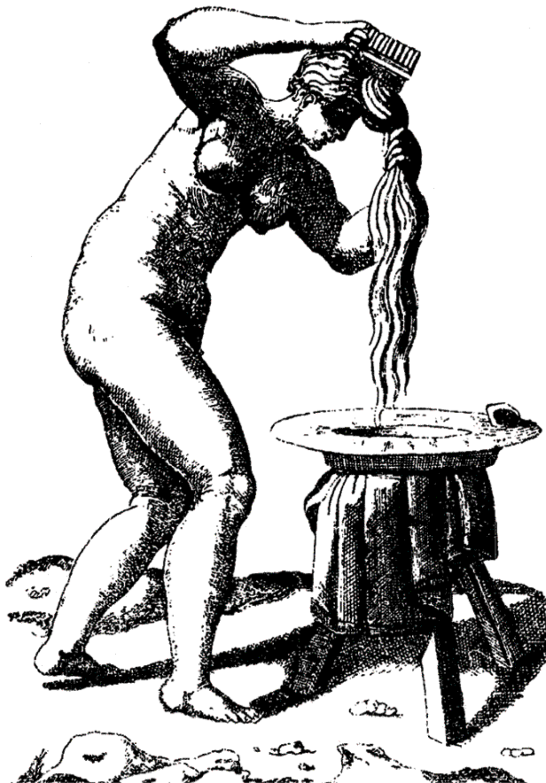
Утренний туалет молодой женщины. XVI в.

Необходимо коснуться еще одной особенности частной жизни, служащей не менее классическим доказательством свойственного Ренессансу культа физической красоты и относящейся к затронутому до сих пор кругу идей. Мы имеем в виду описание и прославление интимной телесной красоты возлюбленной или жены мужем или любовником в беседе с друзьями,