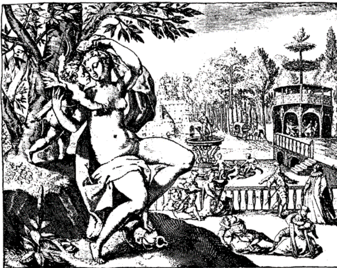
Де Жод. Радости Венеры. XVII в.

Собственно германский по своему происхождению, этот обычай совершался самым разнообразным образом, официально, с большой торжественностью, в серьезном религиозном тоне, в присутствии священника, освящавшего ложе, но и юмористически. Общеизвестна форма, в которую этот обычай вылился при княжеских дворах. Так как в этой среде брак носил чисто условный характер, будучи обычно своего рода политическим договором, в силу которого одно государство передавало другому известную территорию или права на власть, олицетворенные в образе невесты, то молодые могли и не видаться до брака: ведь личная склонность не входила как фактор в решение арифметической задачи. Сделка завершалась публичным разделением ложа, причем сам жених мог и отсутствовать, его роль мог взять на себя уполномоченный посланник, которому было поручено устройство сделки. Он ложился спокойно на парадное ложе рядом со «счастливой» невестой как официальный заместитель своего господина, и дело считалось сделанным, т. е. брак считался юридически заключенным.