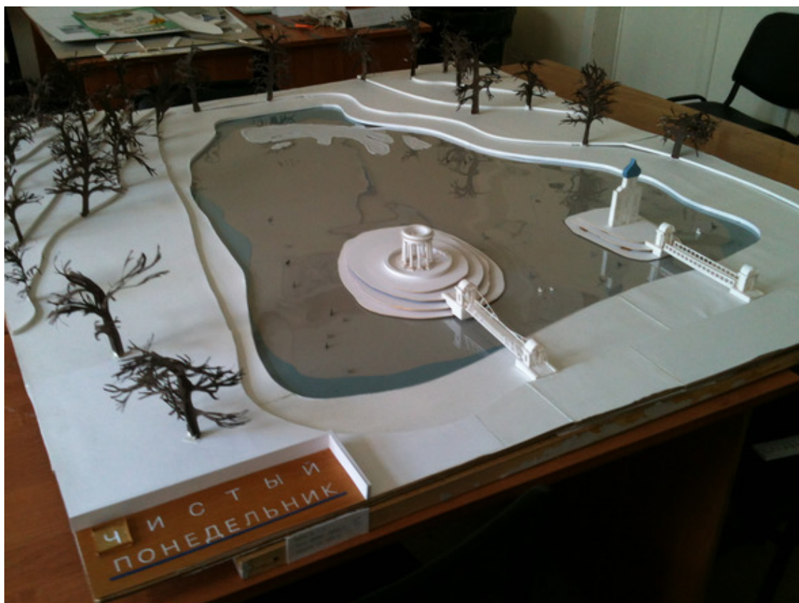
Фото 1. Общий вид проекта.

В большинстве случаев проект вызывает у тех, кто его видит, недоумение, чаще всего его называют «странным», и эта реакция объединяет как профессионалов, так и от людей далеких от искусства, архитектуры и градостроительства.