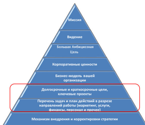
Схема 2. Составляющие части стратегии (стратегический треугольник)

Для вашего удобства все составляющие части стратегии оформлены в виде пирамиды (так называемого стратегического треугольника). Самые верхние уровни пирамиды соответствуют более абстрактным, но основополагающим вещам – миссии и видению организации, а основание треугольника – это перечень задач, план действий и механизм внедрения и корректировки стратегии. Каждая из составных частей треугольника будет подробно рассмотрена ниже.