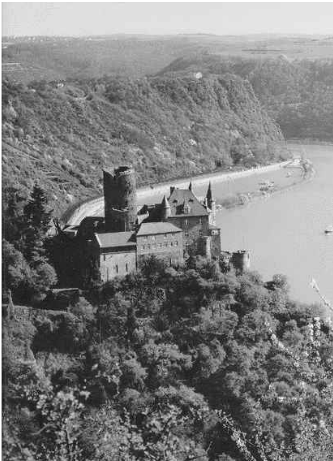
Рейн у Сланцевых гор

Путешествие по спокойным водам Рейна приятно и познавательно. Погружение в историю начинается уже с посадки, ведь пассажирские лайнеры носят звучные имена коронованных особ, композиторов, писателей, а также знаменитых мест и архитектурных памятников. К последним относятся и замки, которыми Германия богата больше, чем любая другая европейская страна. Вздываясь на вершинах гор или скрываясь в зелени на пологих склонах, средневековые крепости нисколько не противоречат урбанистическим видам. Чаше полуразрушен-