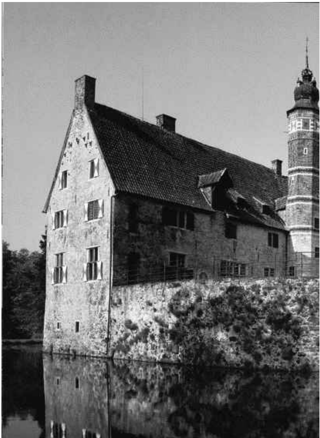
Крепость с укрепленным домом посреди рукотворного озера

Пример иного отношения к родовому гнезду, возможно, подали рейнские графы Ангилемы, чье жилище окружала овальная в плане стена, укрепленная 7 примыкающими к ней каменными домами, среди которых находилась и кузня. Просуществовав около трех столетий, этот замок был покинут владельцами, построившими себе новую резиденцию. Сегодня ни один историк не может сказать, в какой момент благородные германцы стали строить более надежное и обороноспособное жилье. Во всяком случае уже во времена Оттона Великого рейнская знать не полагалась на ров с палисадом и не хотела совершать утомительные перебежки из