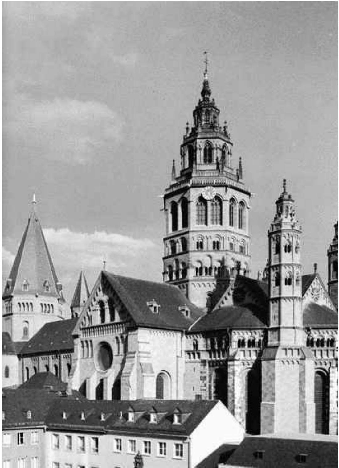
Собор Святого Мартина в Майнце

Из Майнца по германским землям распространилось такое полезное явление, как книгопечатание, и совсем не полезные идеи контрреформации, которые, к счастью, не ушли слишком далеко. Подробности относительно первого можно узнать в музее, который располагается в бывшем дворце герцога, там, где в 1450-х годах основал типографию самый знаменитый гражданин Майнца, великий просветитель Иоганн Гутенберг. В музее выставлены созданные им печатные книги, в том числе знаменитая Библия – одна из немногих церковных книг, названная именем создателя, в данном случае не бога, а человека, то есть самого Гутенберга. Главный