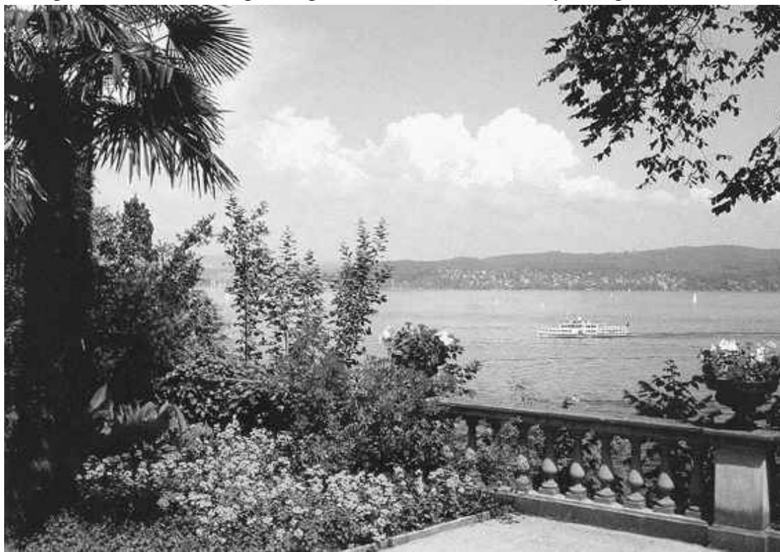
Боденское озеро – место, где начинается Рейн

Несмотря на близость к арктической зоне, Рейн никогда не замерзает, что делает его транспортной магистралью, важной как для Германии, так и для всей Европы. Широкое и глубокое русло реки включает в себе сложные участки с отмелями и подводными скалами. Со временем хорошо изученное, оно уже не препятствует судоходству, особенно оживленному в среднем течении, на участке от Майнца до Кёльна, который часто именуется Романтическим Рейном. Путешествуя по средневековым замкам, не стоит отказываться от посещения ближайших городов, ведь каждый из них напрямую связан с дворянскими поместьями, а некоторые представляют самостоятельную культурную ценность, поскольку являются памятниками античной эпохи. Глядя на Майнц с высоты птичьего полета, трудно поверить, что этот типично европейский населенный пункт основали римляне. Бывший епископский город, некогда составлявший собственность герцога Гессен-Дармштадтского, с недавних пор признан столицей молодой земли Рейнланд-Пфальц. Его никогда не громили вражеские войска, и в отсутствие иных крупных потрясений здесь сохранились следы основателей: остатки стен античной крепости и водопровод, когда-то стоявший на 500 столбах, из которых уцелело лишь 60. К наследию римлян относится и раннехристианская базилика с двумя хорами.