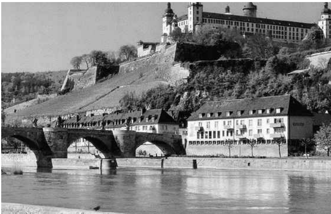
Неприступная крепость Мариенберг в верхнем течении Рейна