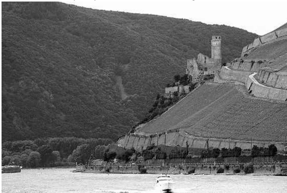
Эренфельс – один из самых старых высотных замков на Рейне

Большинство ранних германских замков оставляет впечатление перенесенных на гору господских дворов. Их фортификация ограничивалась постройками, затруднявшими приближение врага, то есть глубокими рвами, валами, мощным кольцом стен в виде палисада или каменной стены. Простые деревянные или фахверковые дома на фундаменте из валунов и даже массивные каменные дома из-за низко расположенного входа трудно назвать оборонительными сооружениями. В ту эпоху все высотные постройки возводились графскими родами. Очевидно, что стремление знати наглядно выразить свое могущество находило выход в возвышенном