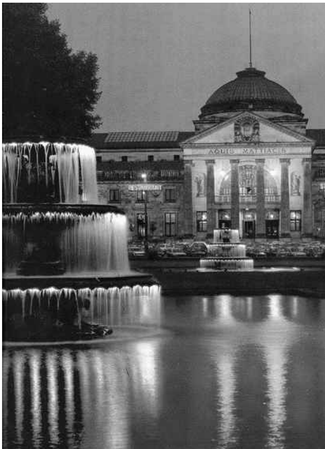
Сегодняшний Висбаден: фонтаны, помпезный павильон с источником минеральных вод

Городской замок Висбадена сотни лет оставался без хозяев и все же не узнал полного запустения. К середине XIX века значительная его часть превратилась в руины, зато в единственной сохранившейся башне скрывалась настоящая сокровищница. Устроенная в ней библиотека хранила около 60 тысяч томов, включая манускрипты, образцы литературы Северного Ренессанса, исторические документы, описывающие времена присутствия римлян. Сотрудники музея предлагали посетителям взглянуть на резной деревянный алтарь, выполненный мастерами Высокого Средневековья, посетить кабинет естественных наук с богатыми коллек-