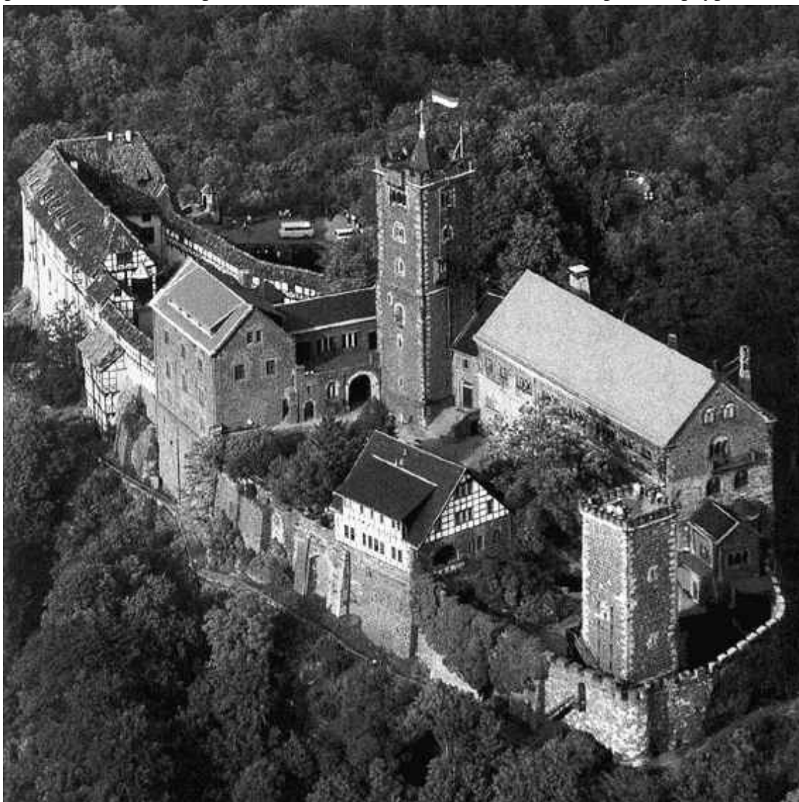
Вартбург – замок, возведенный на мотте и позже дополненный фахверковыми постройками

тельную роль. Упадок наступил с пресечением династии основателей, некогда могущественной, располагавшей обширными владениями вблизи и вдалеке от города Марбург.