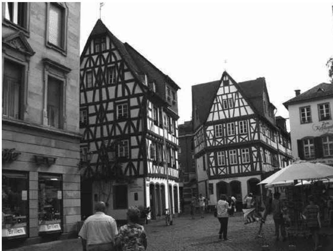
Фахверковые дома в историческом квартале Майнца