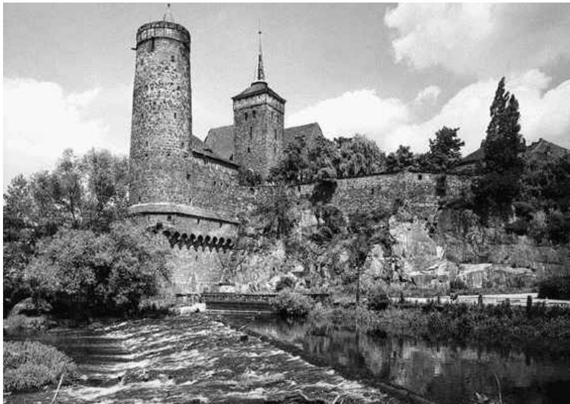
Замок с круглой оборонительной и квадратной жилой башнями

положении, а не в качестве и боевом оснащении построек. В XI–XII веках молодое, непримечательное и ранее штатское явление под названием «замок» претерпело существенные изменения. Обогатившись новыми элементами, неуклонно развиваясь, замок обрел эффектный вид, став полноценным оборонительным сооружением. Помимо прочих удобств, новая резиденция позволяла аристократу не только отделиться от черни, но и давала чувство превосходства высшего сословия над низшим.