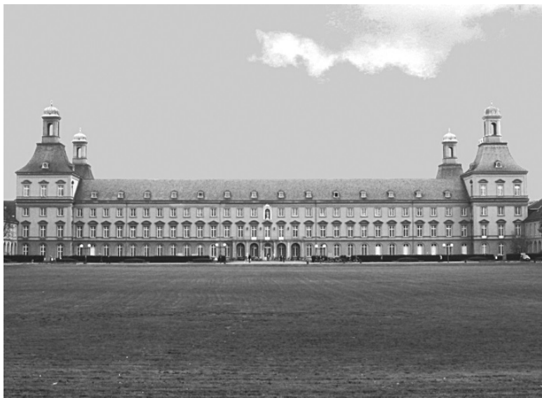
Боннский университет, где учился Ницше