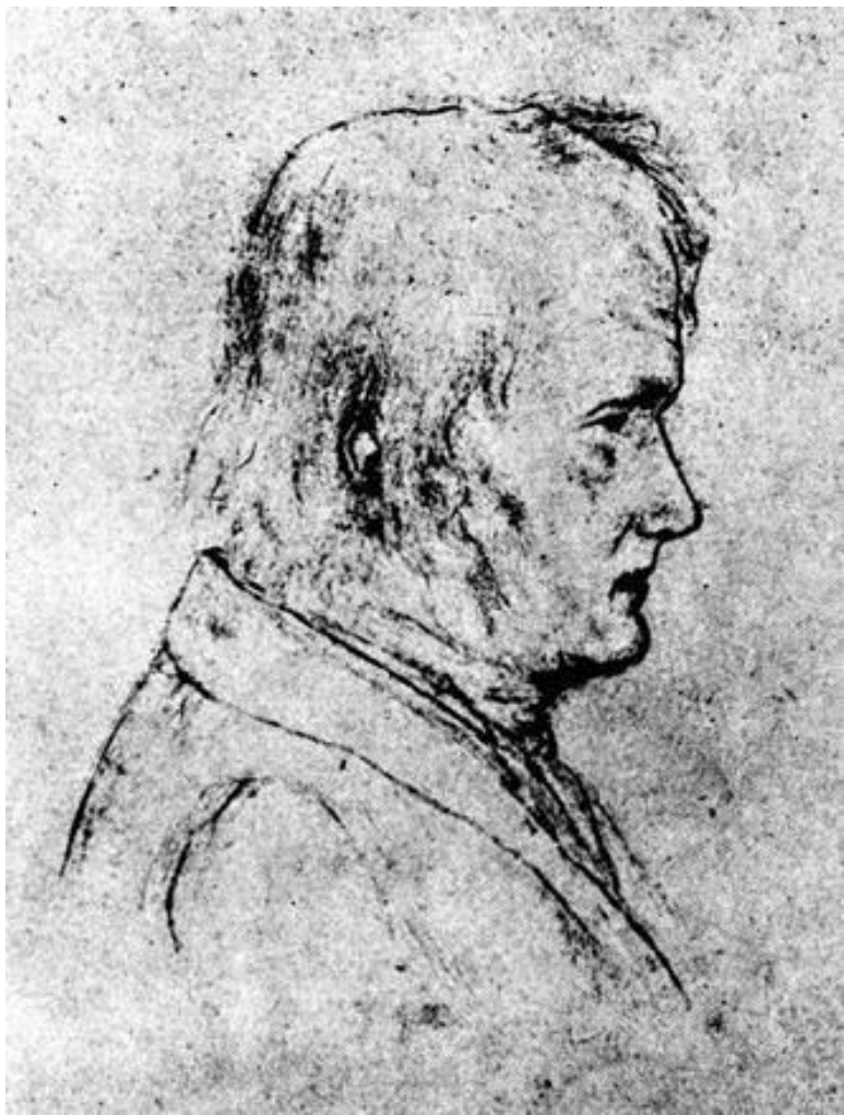
Фридрих Гёльдерлин (1770–1843) – немецкий поэт, от-