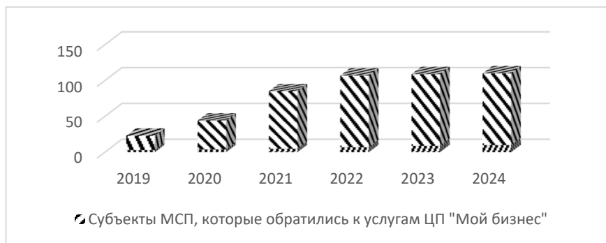
Рисунок 2 – Динамика развития платформы «Мой бизнес» с 2019 по 2024гг.

Востребованность в информационном плане и практическое приложение предлагаемой цифровой площадки дает возможность рассматривать необходимость в возросшей потребности в развитии региональных центров «Мой бизнес». Возникновение первой цифровой площадки с несколькими электронными сервисами по оказанию правовой, информационной, финансовой помощи с 2019 года и планируемое количество новых центров «Мой бизнес» на 2024 год представлены на рисунке 2.