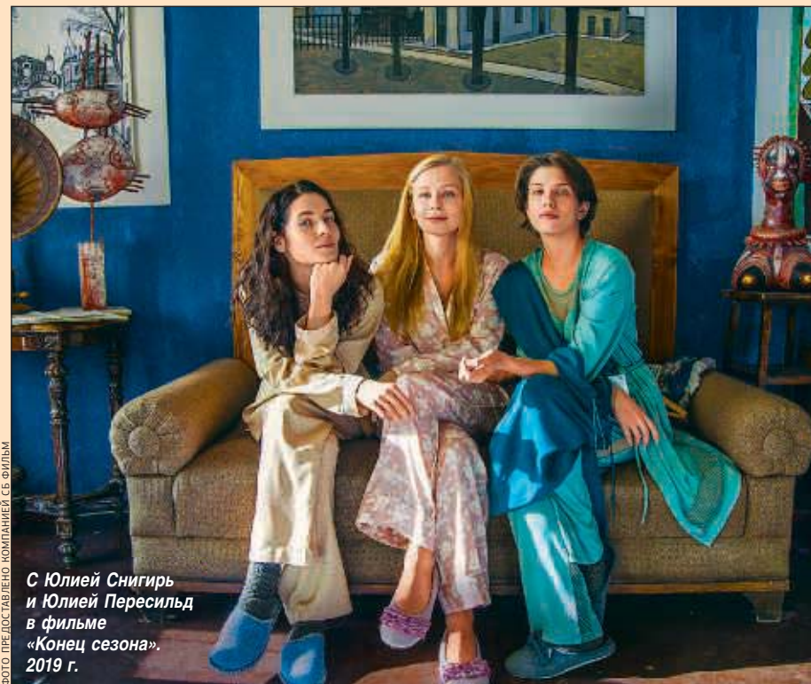
С Юлией Снигирь и Юлией Пересильд в фильме «Конец сезона». 2019 г.

— У нас богатая история исключительно дружеских взаимоотношений. Мы всегда прекрасно друг к другу относились. Я уважаю Вову, а Вова уважает меня, что очень важно. Потому что съемочный процесс — это дело такое, можно быть прекрасными друзьями, но, находясь на съемочной площадке 12 часов в сутки, поссориться через два дня совместной работы вдрызг