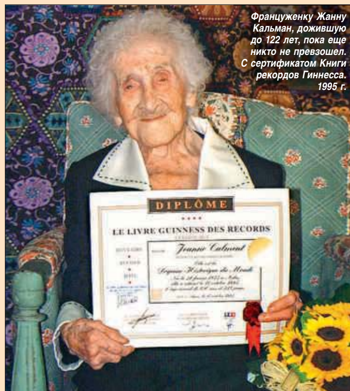
Француженку Жанну Кальман, дожившую до 122 лет, пока еще никто не превзошел. С сертификатом Книги рекордов Гиннеса. 1995 г.