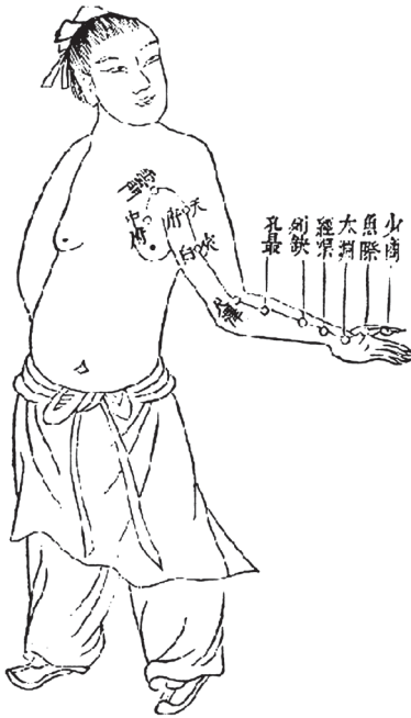
Канал легких Сверх-инь на руке 1. Чжун-фу; 2. Юнь-мэнь; 3. Тянь-фу; 4. Ся-бай; 5. Чи-цзэ; 6. Кун-цзуй; 7. Ле-цюэ; 8. Цзин-цюй; 9. Тай-юань; 10. Юй-цзи; 11. Шао-шан

горизонтальное ответвление в подмышечную область. Другое ответвление канала идет внутри под лопаткой параллельно и впереди канала сердца Малый инь. Затем наружный ход канала спускается на руку, доходит до локтя, движется вниз до нижнего соединения костей руки, проходит через точку определения пульса на руке цунь-коу , проходит через точку шан-шу , проходит через точку юй-цзи и заканчивается на конце большого пальца в точке шао-шан . Наружный ход канала имеет одно ответвление, которое начинается от точки ле-цюэ выше проксимальной лучезапястной складки, идет на тыльную поверхность руки по лучевому краю второго пальца, где у корня ногтя в 0,3 см, связывается с каналом Светлый ян на руке. В меридиане легких много ци и мало крови. Циркуляция в меридиане начинается во время инь.