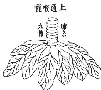
Схема органа цзан легкие 1. Горло; 2. Дыхательные пути; 3. Легкие; 4. Две доли; 5. Шесть лепестков

Канал начинается внутренним ходом в средней части туловища, соединяясь с толстым кишечником, затем проходит через отверстие желудка, поднимаясь вверх, пересекает диафрагму и входит в легкие. От легких отходит