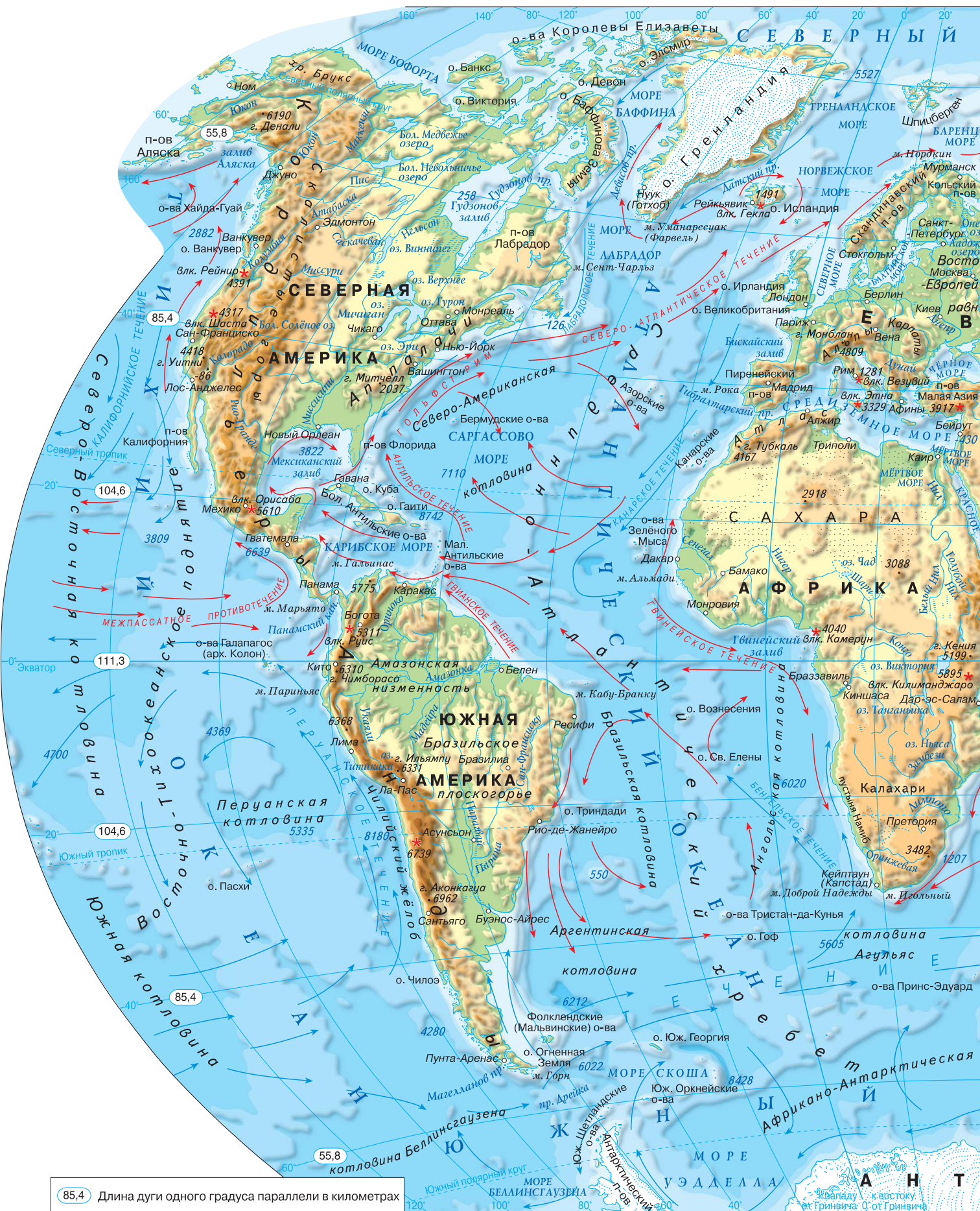
85,4 Длина дуги одного градуса параллели в километрах