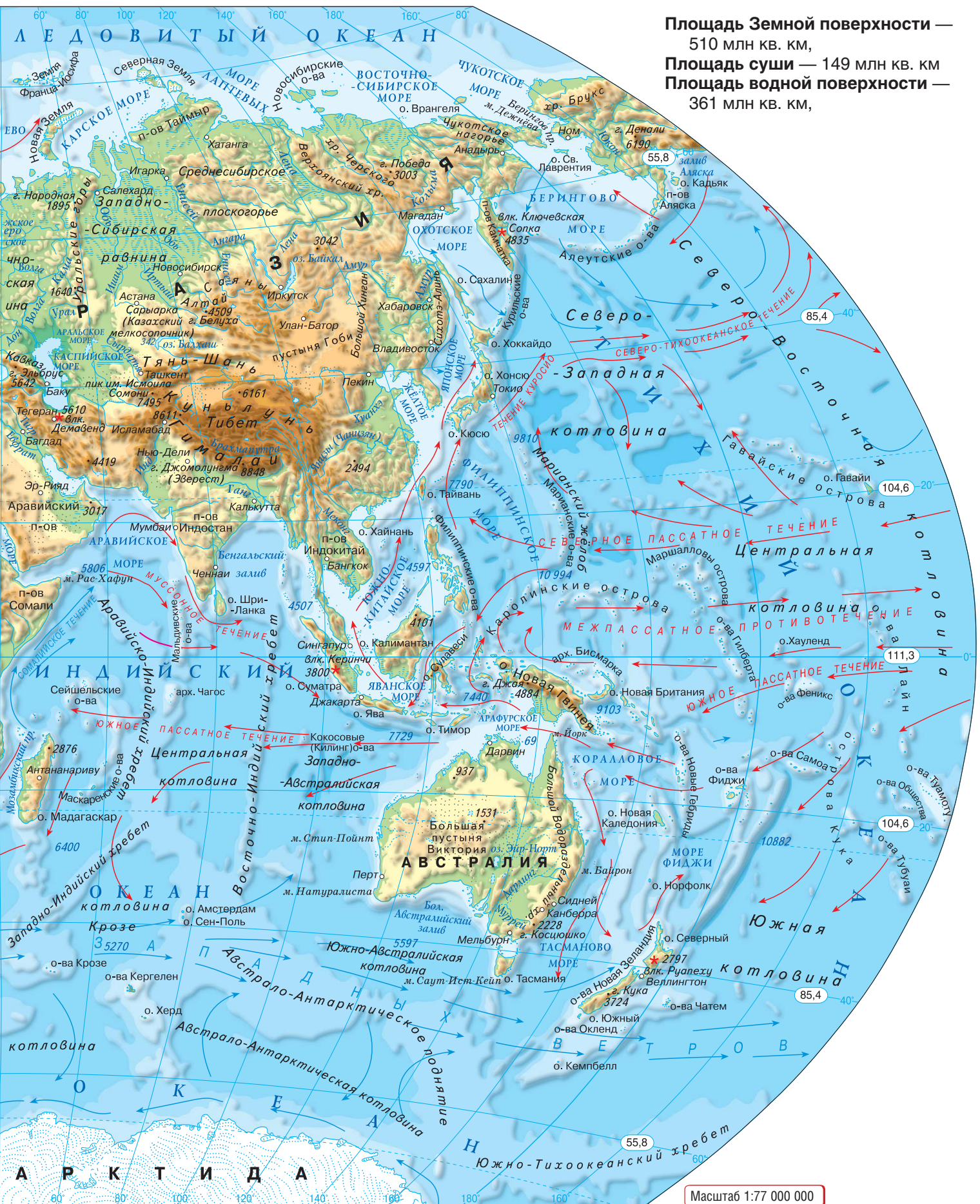
Масштаб 1:77 000 000

Площадь Земной поверхности — 510 млн кв. км, Площадь суши — 149 млн кв. км Площадь водной поверхности — 361 млн кв. км,