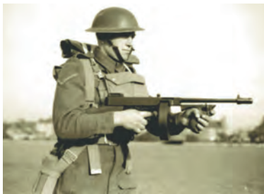
Английский солдат с пистолетом-пулеметом Томпсона M1928 с барабанным магазином на 50 патронов.

Для быстрого охлаждения на стволе имеется внешнее ребрение