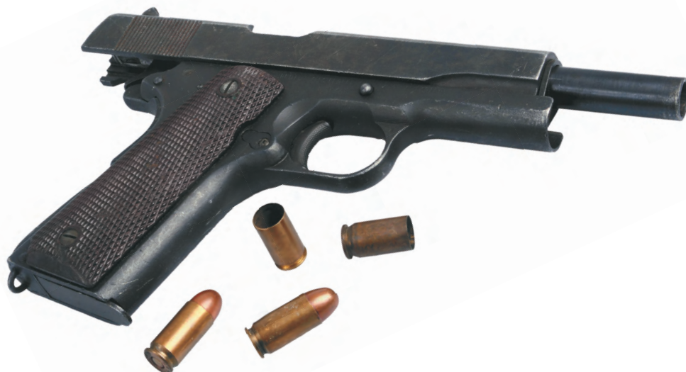
Самозарядный пистолет Colt M1911.

Механический флажковый предохранитель при включении блокирует части ударно-спускового механизма и затвор.