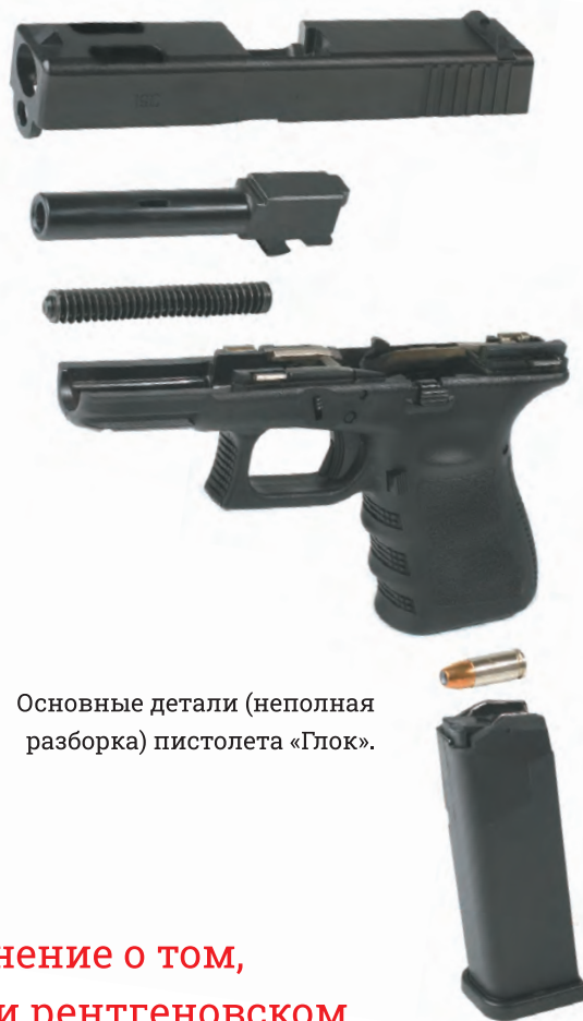
Основные детали (неполная разборка) пистолета «Глок».

Базовая модель Glock 17 была создана под патрон 9 × 19 Parabellum — пожалуй, самый распространенный пистолетный боеприпас, по крайней мере, у западноевропейских военных и полицейских. Очень быстро фирма-производитель заполнила рынок модификациями под патроны различных калибров и мощности. В том числе выпускаются модели Glock 20 под патроны 10 × 25 Auto, Glock 21 под патрон .45 ACP, Glock 22 (патрон .40 S&W), Glock 25 (9 × 17 мм Browning / .380 ACP) и Glock 31 (.357 SIG).