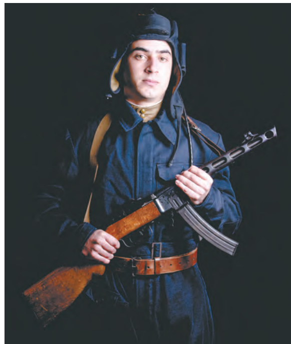
Танкист РККА в спецкомбинезоне обр. 1935 г. поверх обмундирования 1943 г., в танковом шлемофоне обр. 1936 г. Вооружен пистолетом-пулеметом ППШ-41 с коробчатым магазином.

К 1945 г. пистолетами-пулеметами ППШ было вооружено больше половины бойцов РККА, так что это оружие стало одним из символов Победы. ППШ является самым массовым пистолетом-пулеметом в мире: выпущено более 6 млн экземпляров, охотничья модификация производится на российских заводах до настоящего времени.