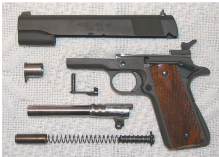
Основные детали (неполная разборка) пистолета M1911.

Размещение центра тяжести оружия в районе спусковой скобы и сравнительно большой угол наклона рукоятки пистолета обеспечивают удобство прицеливания и стрельбы навскидку.