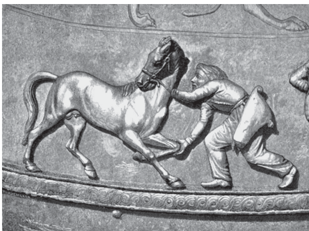
Скиф, ухаживающий за конем (с фриза Никопольской вазы)

Могущество скифов начало ослабевать со времен Филиппа Македонского, который, по словам одного древнего историка, одержал над ними решительную победу не превосходством мужества, а хитростию воинскою, и не нашел в стане у врагов своих ни серебра, ни золота, но только жен, детей и старцев. Митридат Эвпатор, господствуя на южных берегах Черного моря и завладев