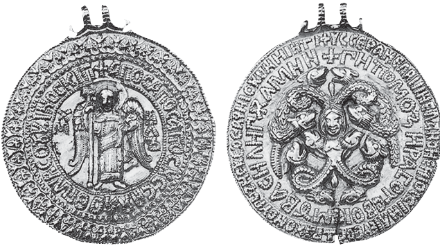
Материальные источники: Змеевик Владимира Мономаха (амулет в виде медали)

ский, Архивский 10 . В каждом из них есть нечто особенное и действительно историческое, внесенное, как надобно думать, современниками или по их запискам. Никоновский более всех искажен вставками бессмысленных переписчиков, но в XIV веке сообщает вероятные дополнительные известия о Тверском княжении; далее уже сходствует с другими, уступая им однако ж в исправности, — например, Архивскому .