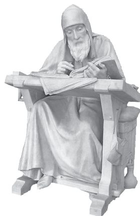
Нестор-летописец. Памятник работы М.М. Антокольского

летописцев иноземных согласны с ними. — Сия почти непрерывная цепь хроник идет до государствования Алексея Михайловича 7 . Некоторые донныне еще не изданы или напечатаны весьма неисправно 8 . Я искал древнейших списков: самые лучшие Нестора и продолжателей его суть харатейные, Пушкинский и Троицкий , XIV и XV веков 9 . Достойны также замечания Ипатьевский , Хлебниковский , Кёнигсбергский , Ростовский , Воскресенский , Львов-