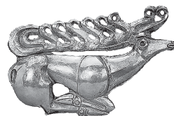
Поясное украшение в виде оленя («звериный стиль») из скифского захоронения VII в. до н. э.

Сарматы (или савроматы Геродотовы) делаются знамениты в начале христианского летосчисления, когда римляне, заняв Фракию и страны дунайские своими легионами, приобрели для себя несчастное соседство варваров. С того времени историки римские беспрестанно говорят о сем народе, который господствовал от Азовского моря до берегов Дуная и состоял из двух главных племен, роксолан и язигов; но географы, весьма некстати назвав Сарматией всю обширную страну Азии и Европы, от Черного моря и Каспийского с одной стороны до Германии, а с другой — до самой глубины севера, обратили имя сарматов (подобно как прежде скифское) в общее для всех народов полуночных. Роксолане утвердились в окрестностях Азовского и Черного морей, а язиги вскоре перешли в Дакию, на берега Тисы и Дуная. Дерзнув первые тревожить римские владения с сей стороны, они начали ту ужасную и долговременную