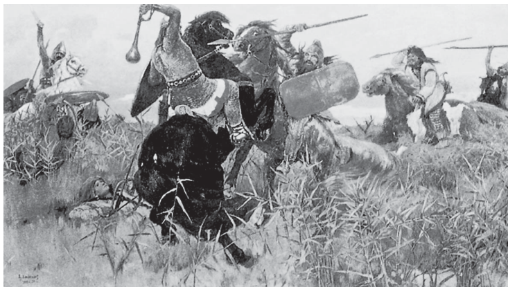
В.М. Васнецов. Битва скифов со славянами

Воспорским царством, утеснил и скифов: последние их силы были истощены в жестоких его войнах с Римом, коего орлы приближались тогда к нынешним кавказским странам России. Геты, народ фракийский, побежденный Александром Великим на Дунае, но страшный для Рима во время царя своего Беробиста Храброго, за несколько лет до Рождества Христова отнял у скифов всю землю между Истром и Борисфеном, то есть Дунаем и Днепром. Наконец сарматы, обитавшие в Азии близ Дона, вступили в Скифию и, по известию Диодора Сицилийского, истребили ее жителей или присоединили к своему народу, так что особенное бытие скифов исчезло для истории; осталось только их славное имя, коим несведущие греки и римляне долго еще называли все народы, малоизвестные и живущие в странах отдаленных.