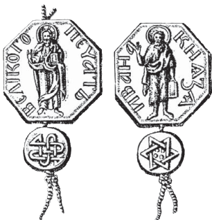
Материальные источники: печати Ивана Калиты

5 Мы должны упомянуть о мнимом древнейшем летописце Иоакиме, первом новгородском епископе, приехавшем в Россию с царевною Анною, супругою Св. Владимира. Татищев рассказывает следующее: «Архимандрит Мельхиседек доставил ему как любителю древностей три тетради, полученные им от монаха Вениамина и выписанные из старой книги, с которою Вениамин сам ехал к Татищеву, но умер дорогою. В тетрадях написано, что Нестор худо знал происшествия новгородские, гораздо лучше известные Иоакиму; что Славен, внук Иафетов, по сказанию сего епископа, основал город Славянск в России; что после господствовал там князь Вандал, коего родственниками были князья Гардорик и Гунигар, завоеватели многих стран; что сыновья Вандаловы назывались Избор, Столпосвят и Владимир, женатый на Адвин-