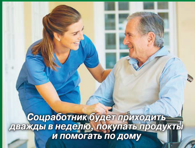
Соцработник будет приходить дважды в неделю, покупать продукты и помогать по дому

Чтобы человеку получать социальное обслуживание на дому, нужно обратиться в местный отдел социальной защиты. Для этого потребуются собрать некоторые документы. В зависимости от ситуации они отличаются, в соцзащите вам дадут полный перечень.