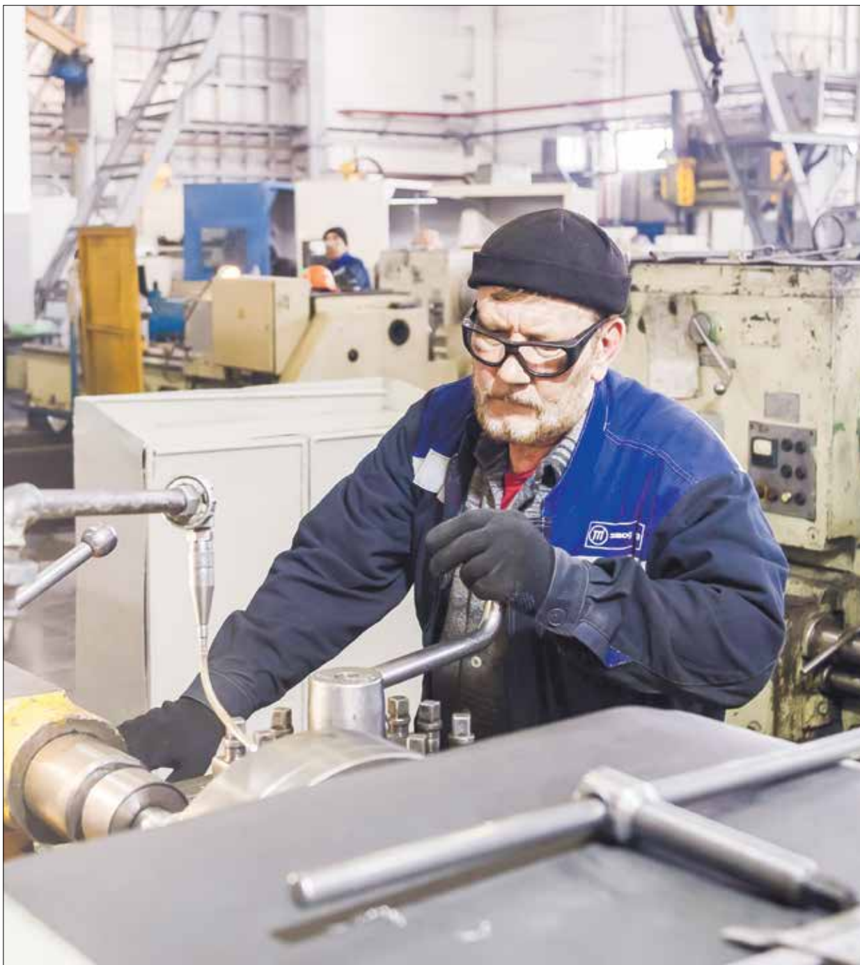
На предприятии, которое выпускает важную для страны продукцию, очень ждут молодые кадры.

Проблемы и решения. В регионе усиливают работу по профориентации школьников