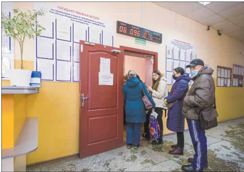
Новосибирская область входит в четверку лидеров России по доступности скоростного проводного интернета. Это значит, что количество получателей государственных услуг онлайн неизменно растет.

– Это показывает ту огромную роль, которая принадлежит молодежи в жизни и развитии страны и региона, – отметил на встрече с лидерами молодежных сообществ Новосибирской области первый