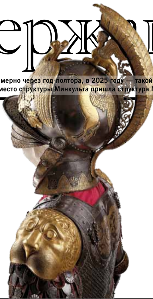
МУЗЕЙ МОСКОВСКОГО КРЕМЛЯ

Музей русского импрессионизма сосредоточился на анонимах — Рерих почти без мистики в Третьяковской галерее — Личное постсоветское пространство в Музее Москвы — 200 произведений Бориса Григорьева прибыли в Музей Фаберже — «Голубая роза» и синее небо степей — Родченко с нового ракурса — Выставка к 150-летию Алексея Шусева — Возвращение в подмосковный Барбизон — Необыкновенная жизнь Коко Шанель — Как продавать картины гения и преуспеть — В Национальной галерее первая за три десятилетия ретроспектива Франса Халса — Путешествие. Тобольск: столица Сибири бывшей не бывает