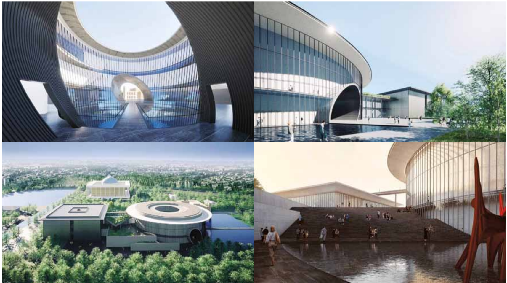
Проект здания Государственного музея искусств Узбекистана в Ташкенте авторства архитектурного бюро Tadao Ando Architects & Associates

В культурном отношении Республика Узбекистан знаменита прежде всего изысканно декорированными мечетями и другой исламской архитектурой, украшающей города, стоящие на Шелковом пути из Китая на Ближний Восток: Бухару, Самарканд и Ташкент. Но сейчас страна готовится открыть сразу несколько музеев современного искусства и провести ряд крупных культурных мероприятий, запланированных на ближайшие два года.