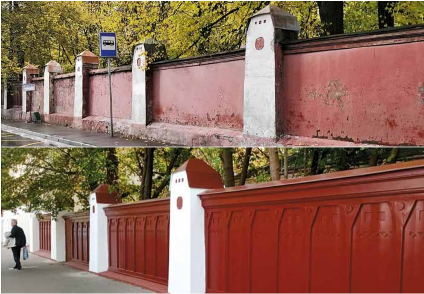
«Ограда дачи Коншиной», известная в народе как «забор Врубеля», до и после реставрации