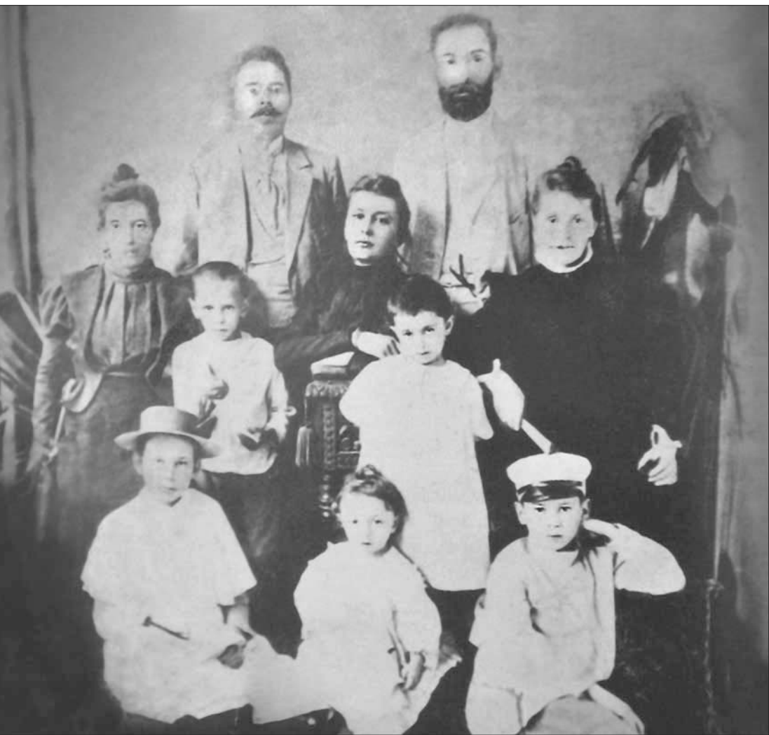
Семья Николая и Евы Шпильрейн, ок. 1896. Сабина Шпильрейн (в шляпке) в нижнем ряду слева