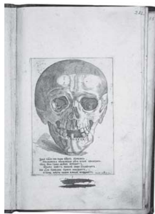
Синодик Троице-Сер- гиевой лавры. 1748 г. Отдел рукопи- сей Россий- ской госу- дарственной библиотеки

48 Сергей Шокарев Монахи шутят... Об одном казусе в монастырской коммеморации Нового времени