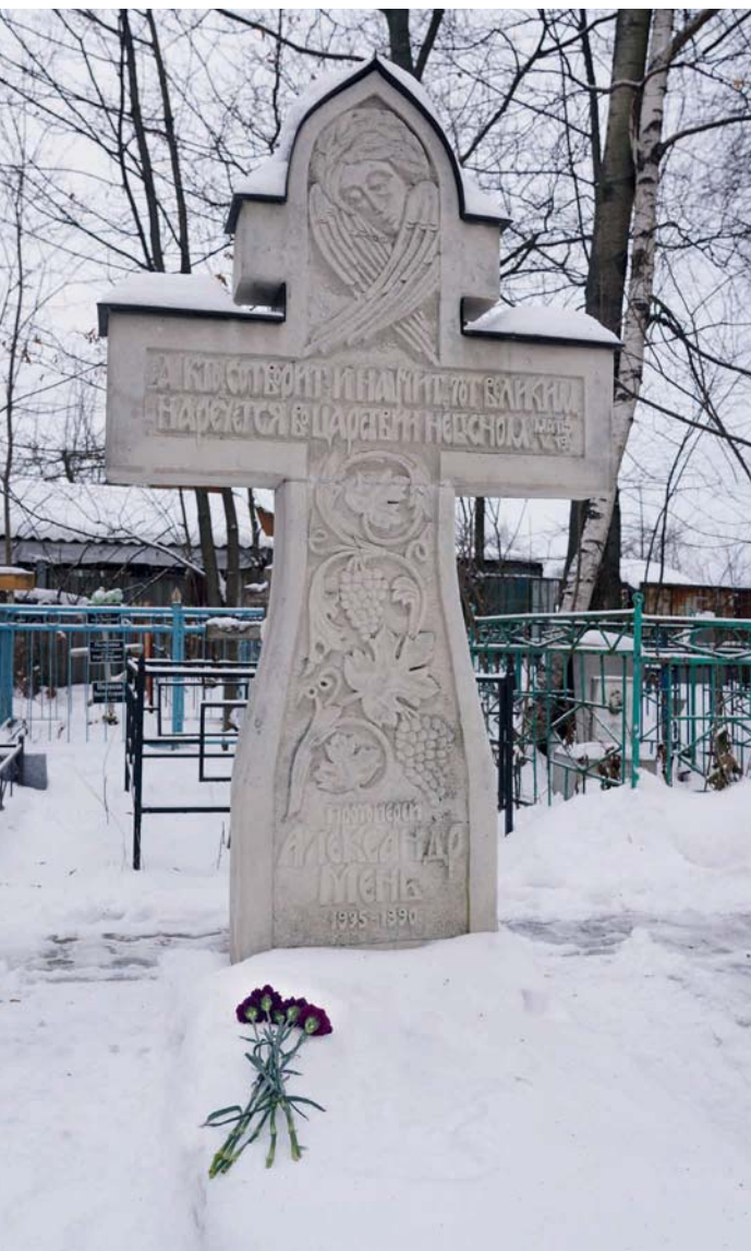
Могила отца Александра Меня