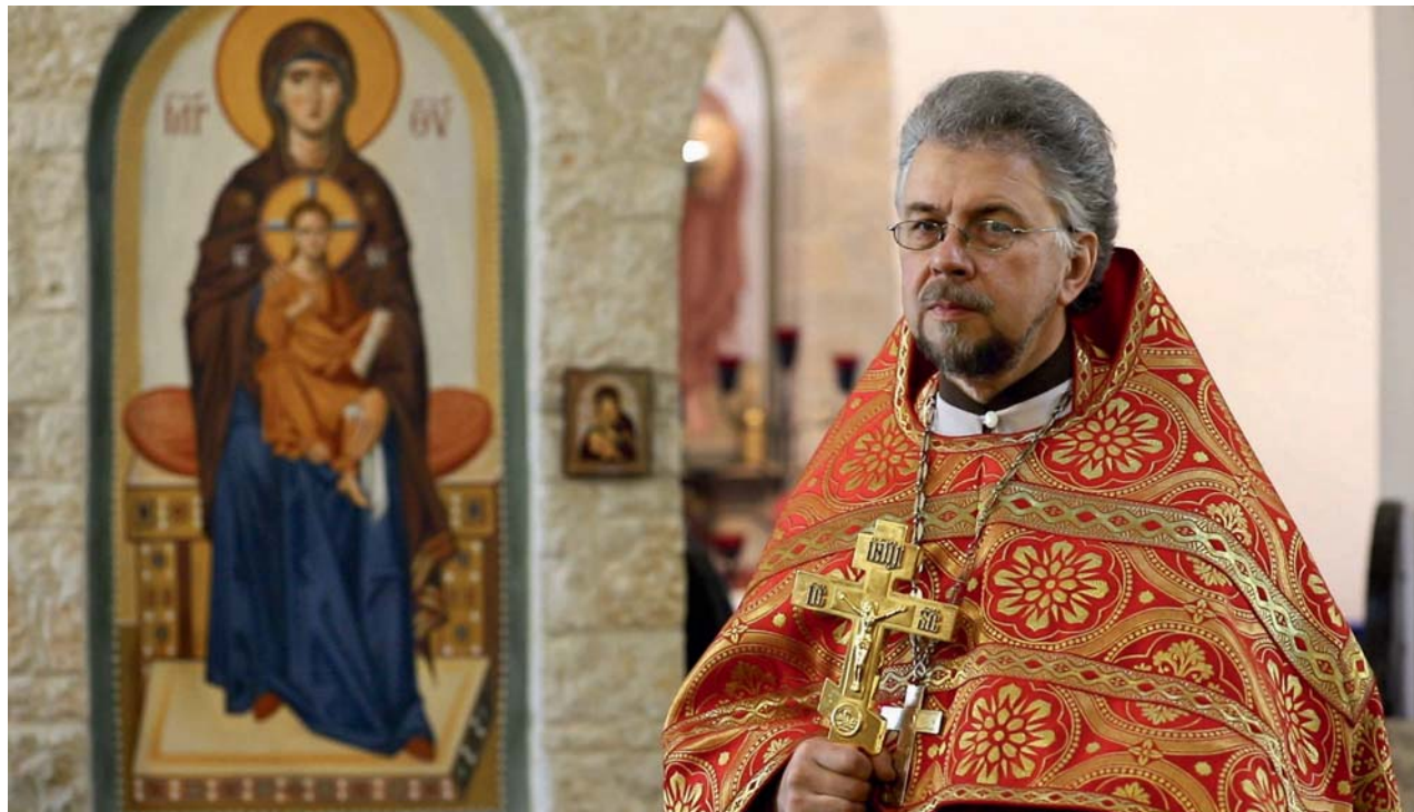
Митрополит Крутицкий и Коломенский Ювеналий на месте убийства протоиерея Александра Меня