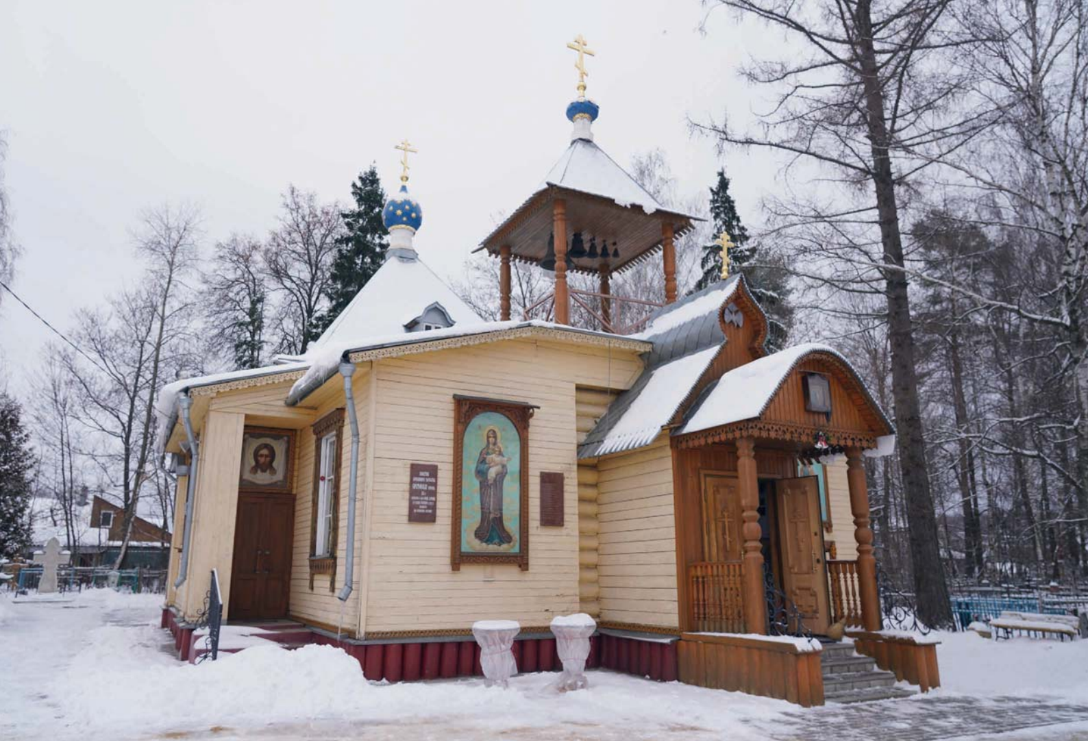
Сретенский храм в Новой деревне