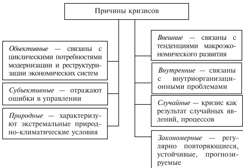
Рис. 1.1. Классификация причин кризисов