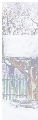
К.И. Горбатов. «Зимний вечер. Псков». 1910 г.