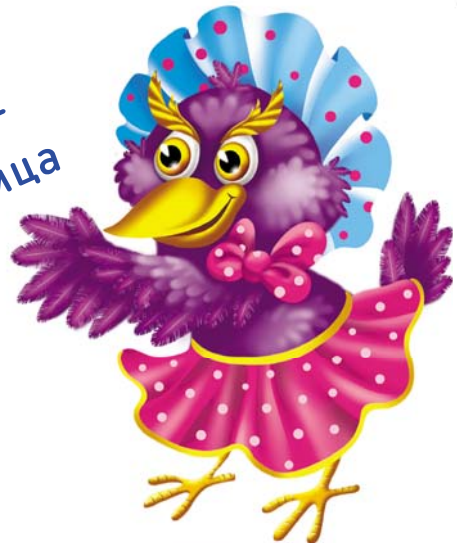
Сова Угуха - писательница