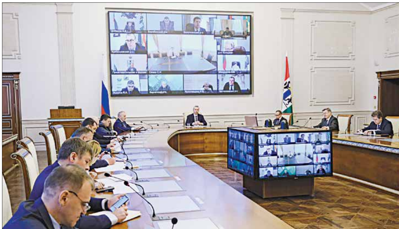
В регионе обсуждают усиление мер борьбы с пандемией.

Подписка на электронную версию газеты по e-mail podpiska@sovsibir.ru