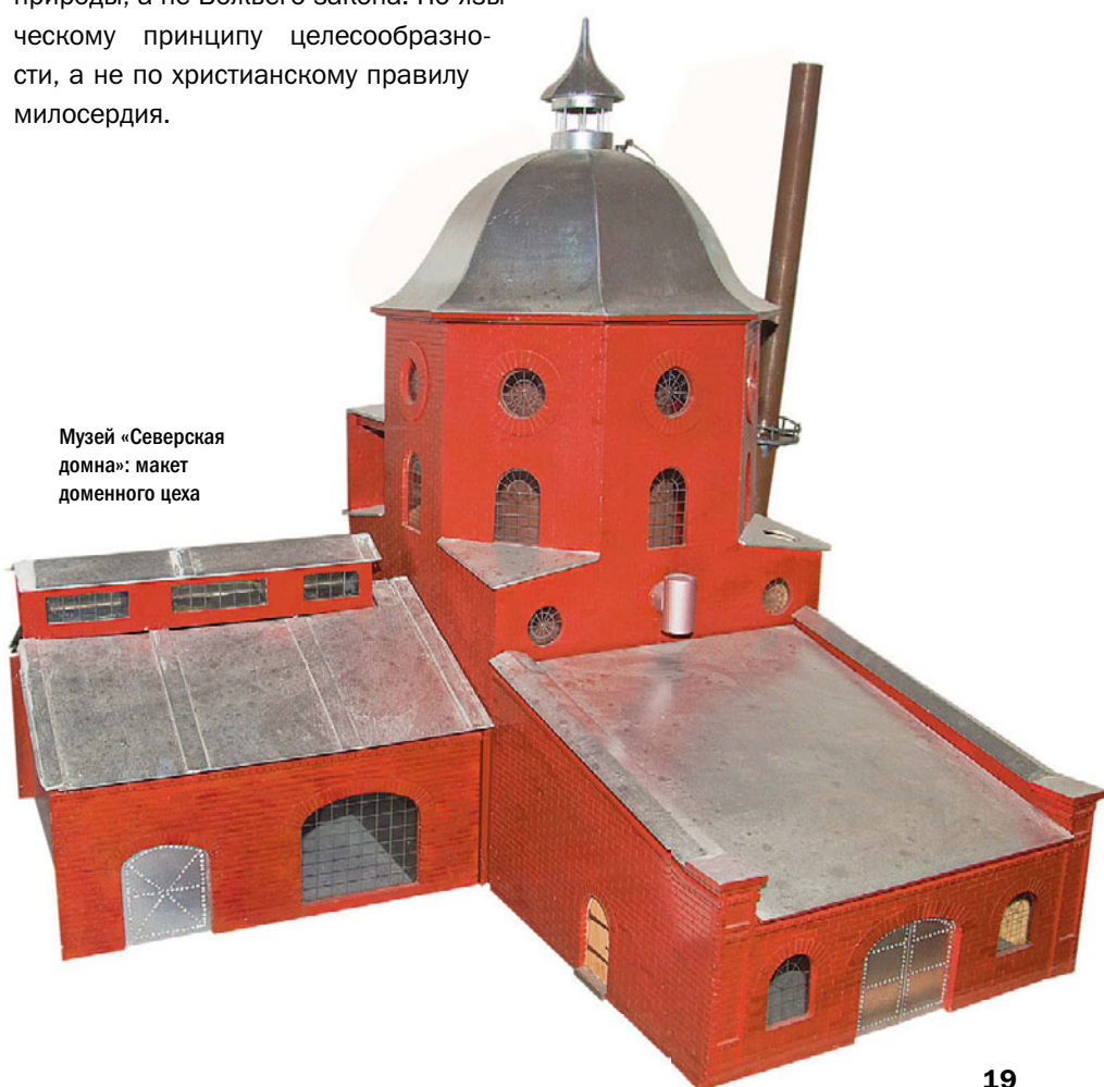
Музей «Северская домна»: макет доменной цеха