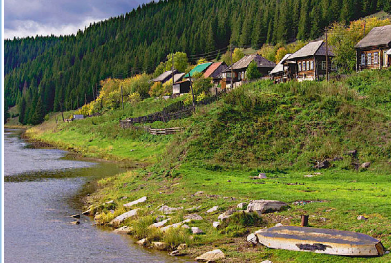
Посёлок Кусьинского завода громоздится на косогоре