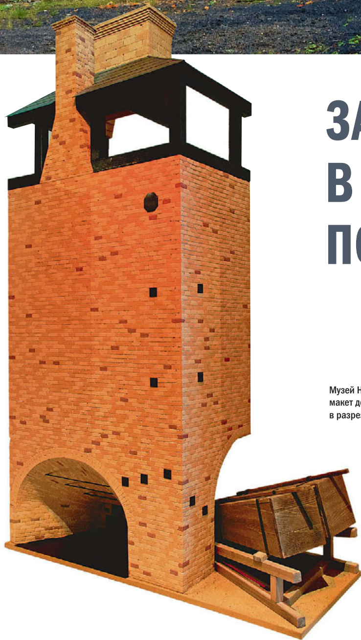
Музей Невьянска: макет доменной печи в разрезе

А медведь был священным животным. Но вовсе не из-за своей силы. Медведь умел ходить в мир мёртвых — под землю. Он уходил туда осенью, когда залегал в спячку, и забирал с собой тепло, а возвращался из берлоги весной — и приносил возрождение жизни. Медведь — таёжный Озирис, который умирает и воскресает.