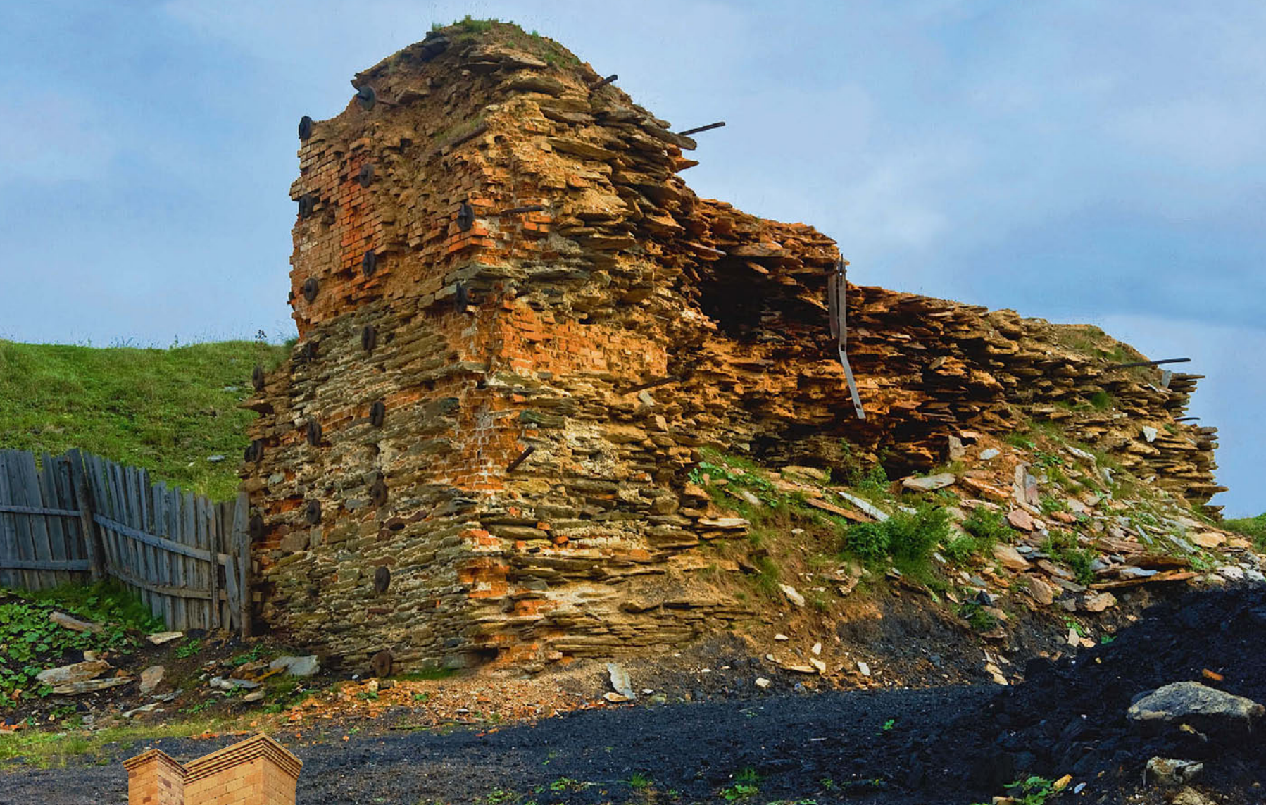
Руины доменной печи завода Бисер