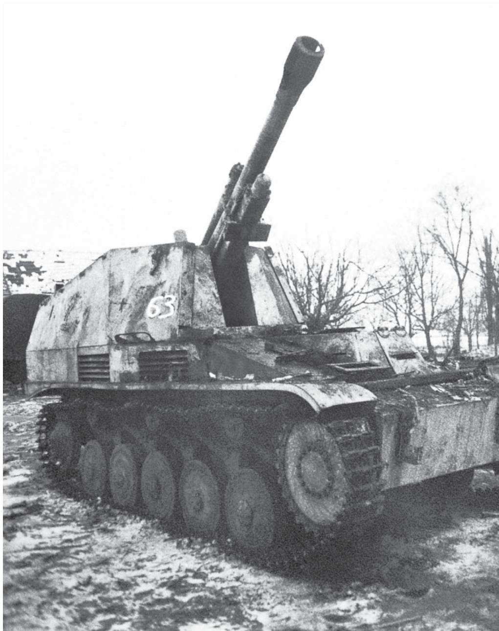
105-мм легкая самоходная гаубица «Wespe», брошенная экипажем на окраине Будапешта. Февраль 1945 года. Самоходка имеет зимний камуфляж, обозначения (кроме номера 63 советской трофейной команды) отсутствуют. Предположительно машина принадлежала 13-му артиллерийскому полку 13-й танковой дивизии.

стью укомплектован людьми. К декабрю 1944 г. мехкорпус можно было смело называть «Сибирским» – 70% его личного состава было сибиряками, которые успели получить хорошую тактическую подготовку как пехота. Напротив танки прибыли незадолго до отправки на фронт и совместные учения с ними провести уже не успели. Танки соединению Руссиянова достались нестандартные – корпус укомплектовали полученными по ленд-лизу американскими «шерманами». Это