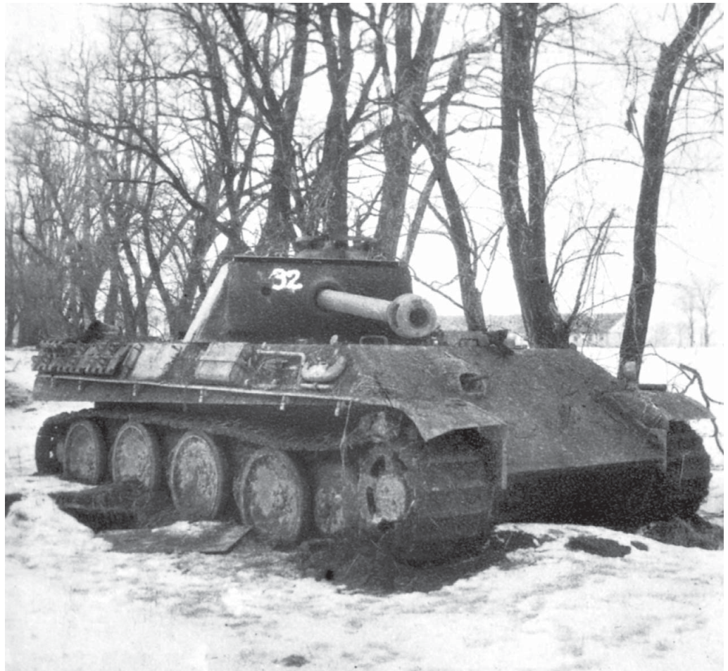
Брошенный экипажем танк Pz.V Ausf. G «Panther». Район озера Балатон, февраль 1945 года. На правом борту видна штанга для крепления бортового экрана, а также укладка ЗИП. Номер 32 нанесен советской трофейной командой.

Когда-то в августе 1944 г. прибытие двух эсэсовских дивизий в Польшу предопределило судьбу Варшавского восстания и остановило казавшееся безостановочным советское продвижение к польской столице. В случае начала нового советского наступления под Варшавой IV танковый корпус СС, несомненно, оказал бы существенное влияние на развитие событий. Однако сильное и опасное соединение буквально за две недели до начала Висло-Одерской операции было отправлено в Венгрию. Это решение во многом определило стратегию Германии в кампании 1945 г. В феврале 1945 г. едва ли не половина танковых дивизий немцев на восточном фронте была задействована в Венгрии. Следует отметить, что в отличие от многих других прорывов к окруженным группировкам, пробивание коридора в Будапешт не должно было завершиться эвакуацией гарнизона города. Напротив, предполагалось усилить