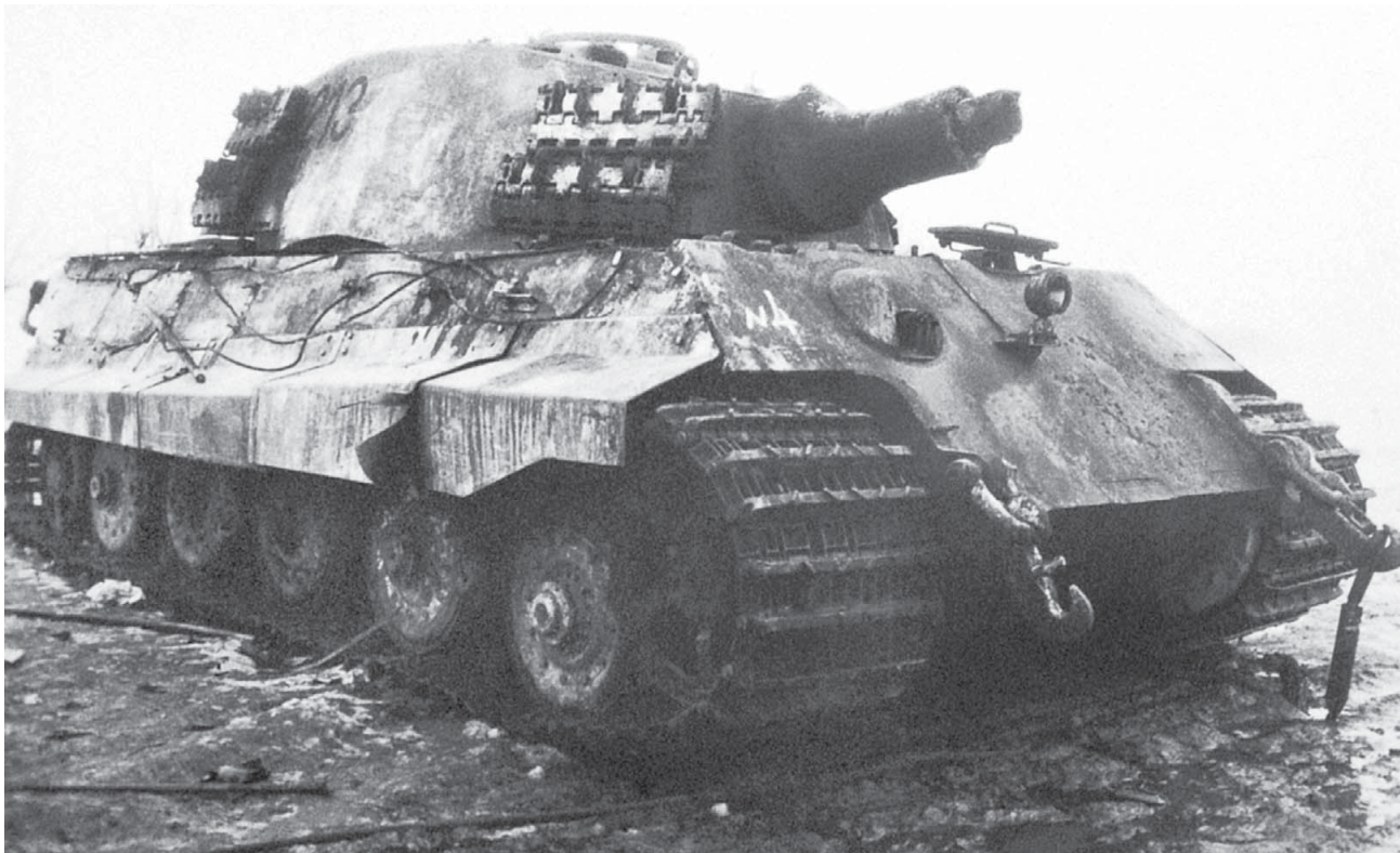
Танк SPz.VI Ausf. B «Königstiger» из состава 509-го батальона тяжелых танков, подбитый советской артиллерией. Район Будапешта, февраль 1945 года. Ствол танка отбит снарядом, машина имеет тактический номер 213, на башне закреплены запасные гусеничные траки.