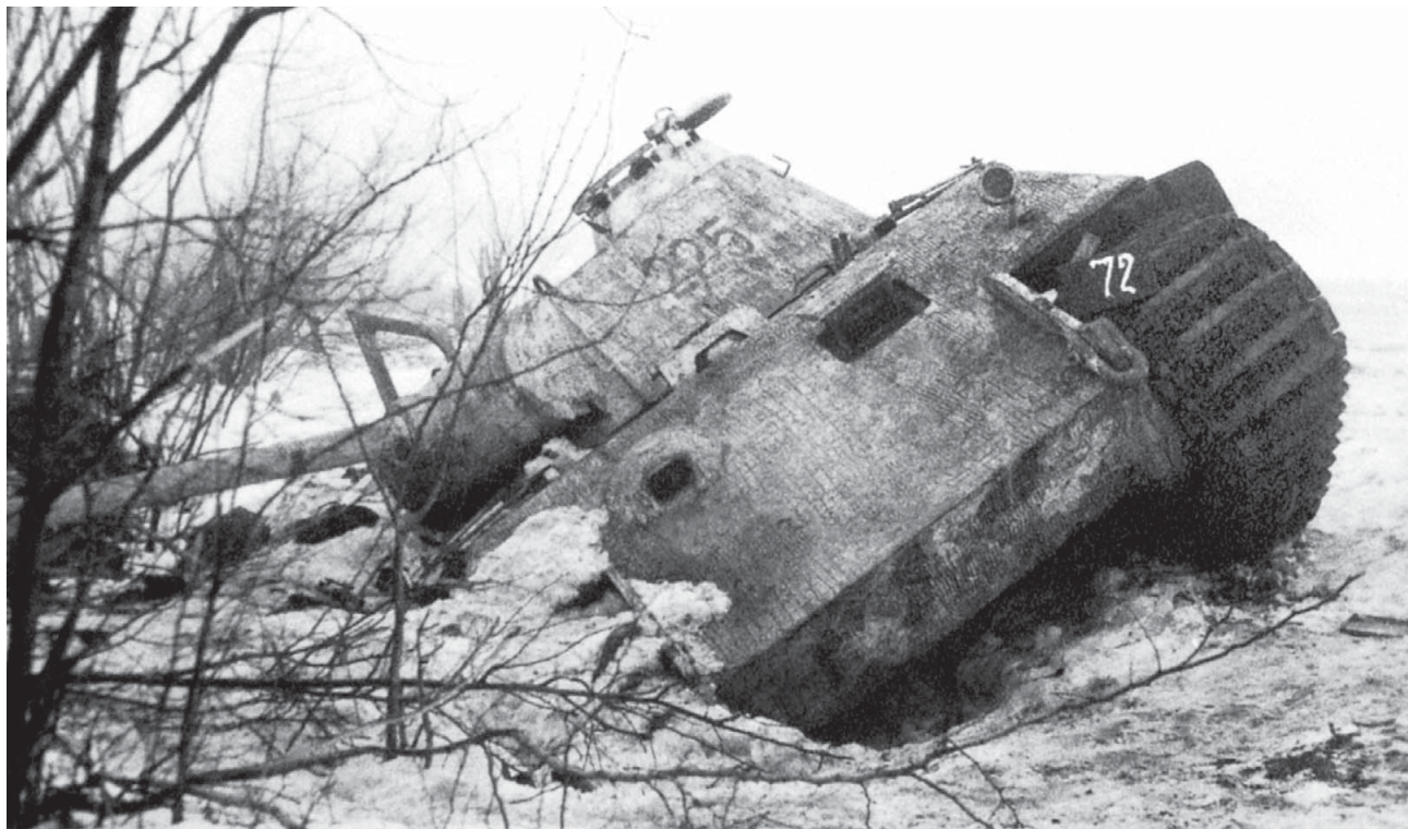
Танк SPz.V Ausf. A «Panther», застрявший и брошенный экипажем. Район озера Балатон, февраль 1945 года. Машина имеет белую зимнюю окраску и номер 225 на башне. Вероятно, танк принадлежал 6-й танковой дивизии вермахта.

поначалу вызвало определенные проблемы в ремонтных подразделениях корпуса, готовившихся на Т-34. Также в состав корпуса были включены три самоходно-артиллерийских полка новейших истребителей танков СУ-100. Выгрузка мехкорпуса из эшелонов началась 24 декабря 1944 г., как раз в тот день, когда Гитлер приказал отправить под Будапешт IV танковый корпус СС. Прибытие под Будапешт 1-го гв. механизированного корпуса и трех полков СУ-100 можно оценить как реакцию советского командования на ввод немцами в бой в Венгрии нескольких танковых дивизий в ноябре – декабре 1944 г.