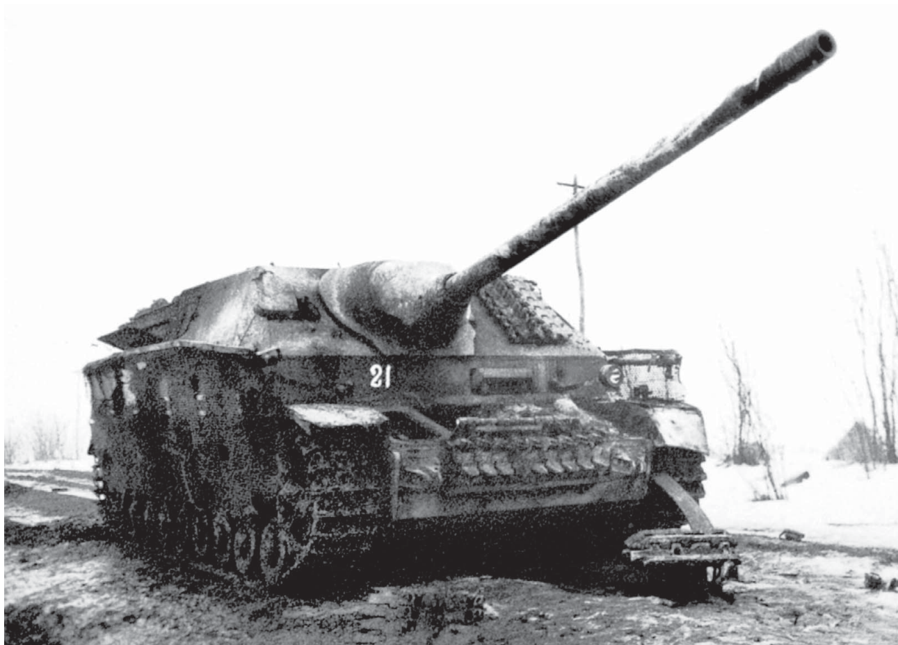
Истребитель танков Pz.IV/70 (А), подбитый в районе озера Балатон. Февраль 1945 года. Машина имеет сетчатые бортовые экраны и остатки зимнего камуфляжа. Номер 21 нанесен советской трофейной командой.

не приходится – им предстояло вступить в бой с колес. Однако их непосредственные руководители были немногим лучше. Лишь командующий группой армий «Юг» генерал пехоты Велер был в какой-то мере знаком с ТВД – ранее он командовал 8-й армией в Венгрии. Но при этом был новичком в качестве командующего группой армий. К началу операции по деблокадированию Будапешта он занимал этот пост всего восемь дней. Генерал танковых войск Бальк впервые командовал войсками в Венгрии и недавно принял командование 6-й армией. Он был одним из самых титулованных и известных германских танковых командиров Второй мировой войны. К январю 1945 г. он был кавалером Рыцарского Креста с Мечами, Дубовыми Листьями и Бриллиантами. К слову, Велер имел только Рыцарский Крест с Дубовыми листьями. Но если для Гилле задача прорваться в Будапешт – было признанием прошлых заслуг, то для Балька новое назначение было понижением. До этого он командовал группой армий «Г» на Западе. Присвое-