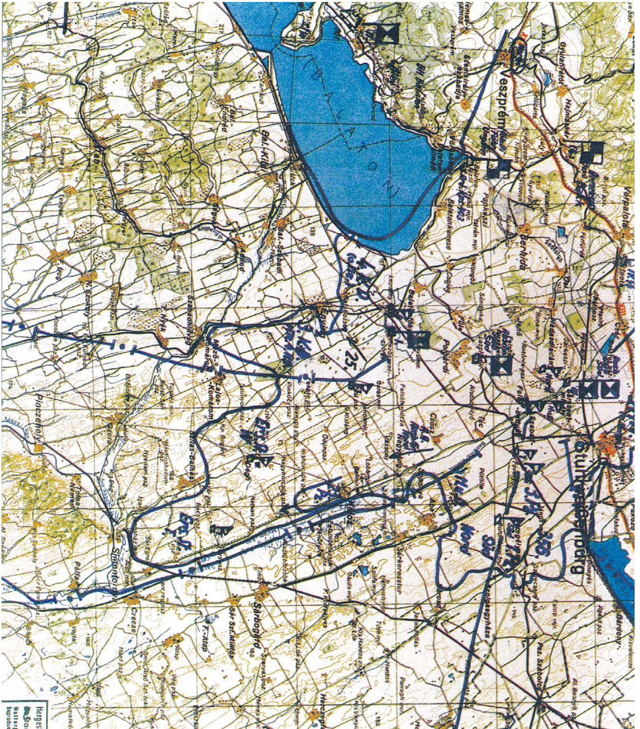
Оперативная карта штаба группы армий «Юг» с изображением обстановки на 10 марта 1945 года.