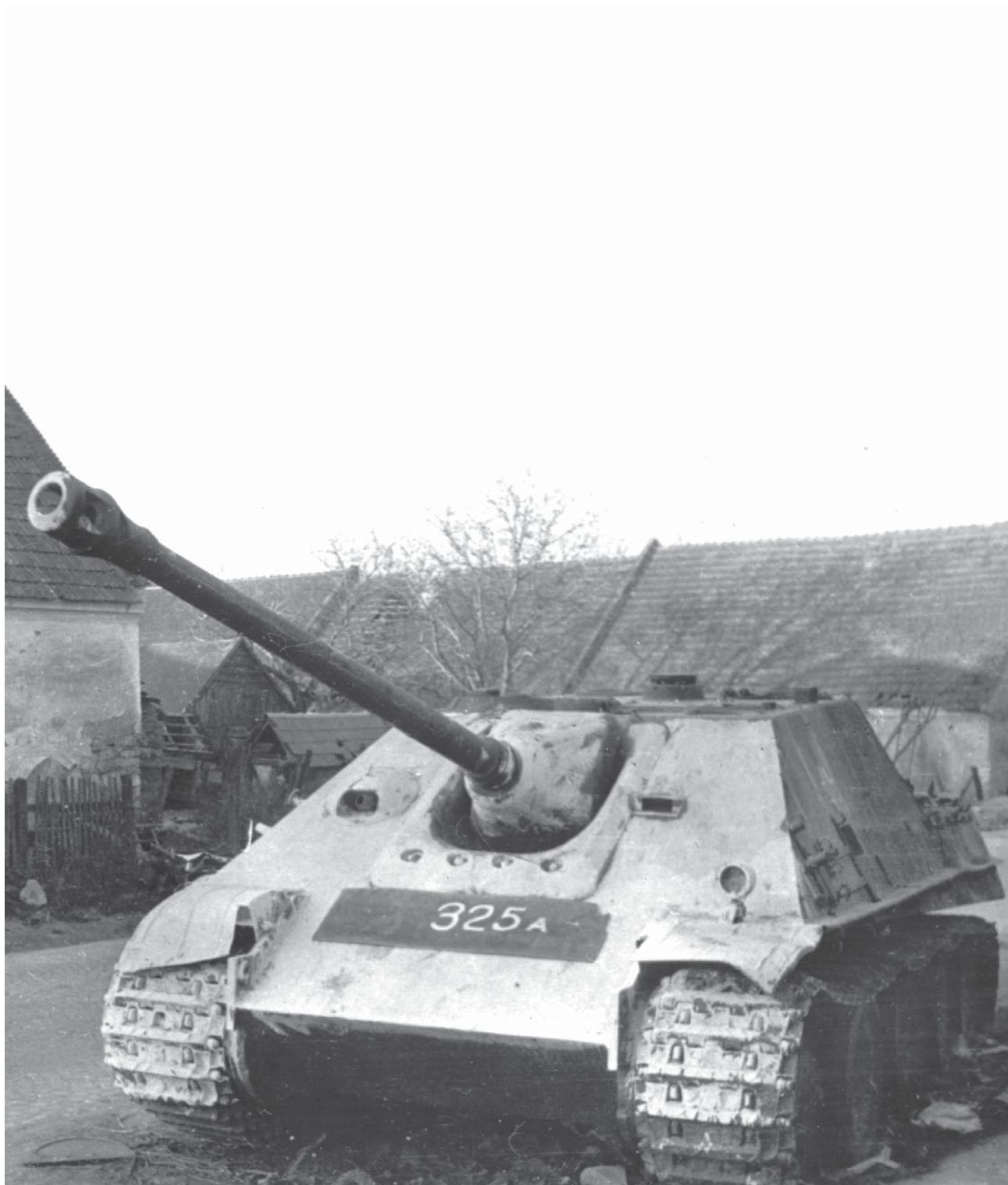
Истребитель танков «Jagdpanther» из состава 560-го тяжелого дивизиона истребителей танков, оставленный на улице венгерского населенного пункта из-за поломки или отсутствия горючего. Район озера Балатон, март 1945 года. Лобовой лист и передняя часть гусениц машины окрашены известью в белый цвет для того, чтобы самоходку было лучше видно ночью водителям проезжающих мимо автомашин.