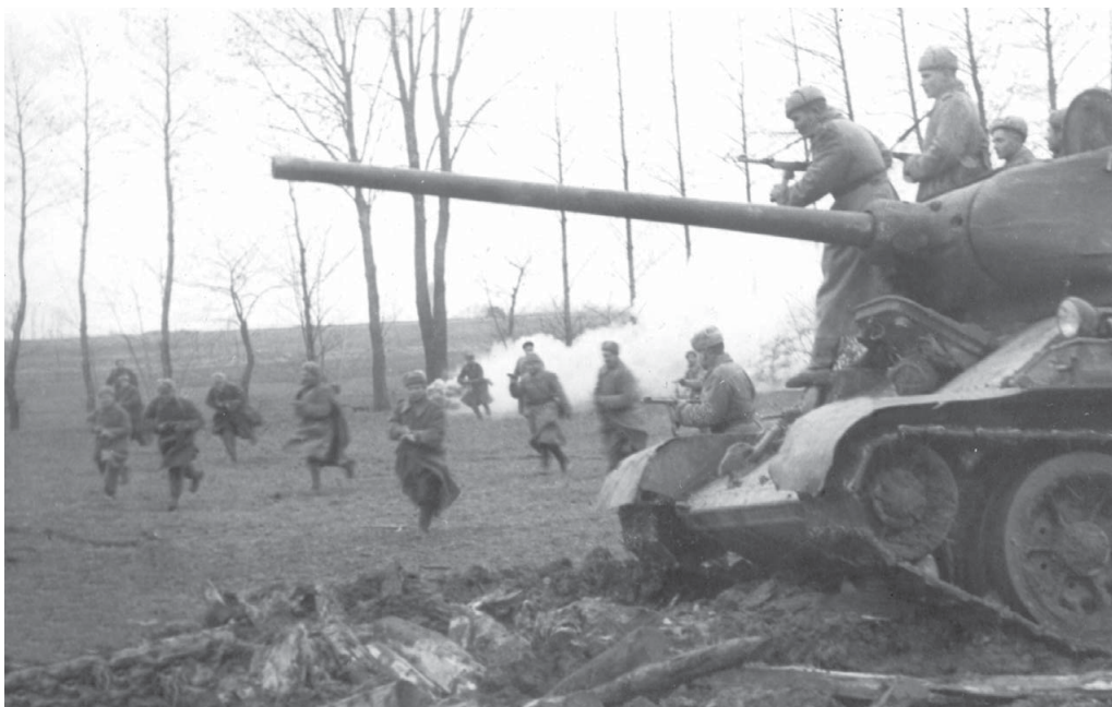
Танк Т-34-85 с десантом пехоты готовится к атаке. Венгрия, конец 1945 года.