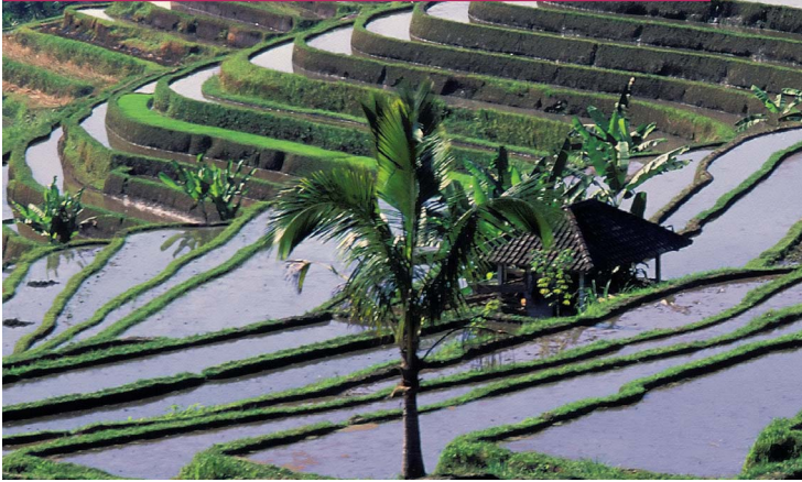
Ни с чем несравнимый вид – рисовые террасы на Бали

Любителям культурного отдыха стоит отправиться в Убуд ( центральная часть Бали ). Здесь они смогут посетить впечатляющие музеи и танцевальные представления, а также побродить по рисовым полям. Также недалеко отсюда располагаются самые древние святыни острова, такие как Гоа Гаджах, Ганунг Кави, Йех Пулу и Тиртха Эмпул. Еще Убуд является самым лучшим местом для посещения прекрасных «храмов здоровья».