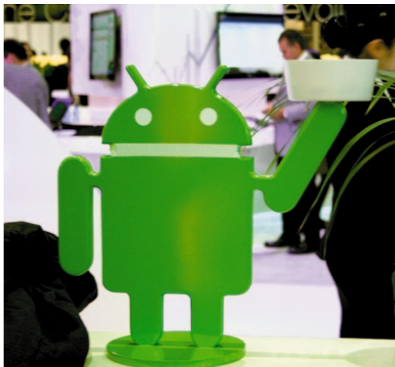
В НЫНЕШНЕМ ГОДУ все внимание участников конгресса приковано к продукции на платформе Android

Очередную «бомбу» на MWC взорвала компания Samsung: модель Samsung Galaxy S II заметно тоньше по сравнению со своей предшественницей Galaxy S, поставляется с двухъядерным процессором, имеет увели-