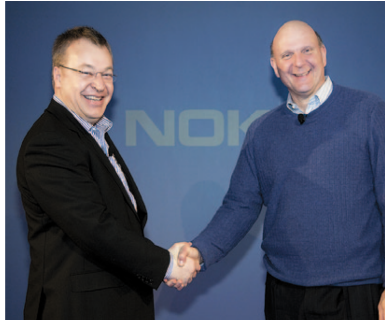
ЧТОБЫ ВЕРНУТЬ СВОЕЙ НОВОЙ компании былые успехи на рынке смартфонов, Стивен Элоп заключил стратегический альянс со Стивом Балмером и присоединился к экосистеме Windows Phone 7

В рамках соглашения с Microsoft финская корпорация будет разрабаты-