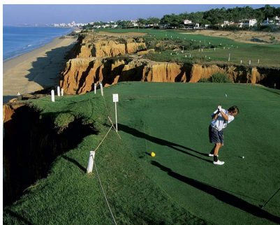
Гольф-поле в окрестностях Вале-де-Лобо на побережье Алгарве