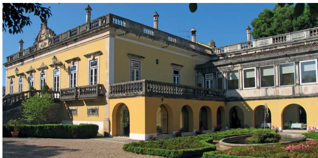
Исторический отель-дворец Quinta das Lágrimas в Коимбре

Turismo no Espaço Rural (TER) – вариант сельского туризма. Это отдых на природе в простых сельских