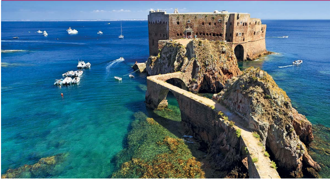
Острова Берленга рядом с Пениши – популярное место для дайвинга