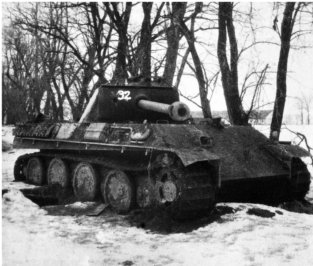
Брошенный экипажем танк Pz.V Ausf.G «Panther». Район озера Балатон, февраль 1945 года. На правом борту видна штанга для крепления бортового экрана, а также укладка ЗИП. Номер 32 нанесен советской трофеейной командой.

Западнее гор Вэртэшхедьшэг на пространстве от Комарно до железной дороги Кишбер–Кернье простирается среднепересечен-