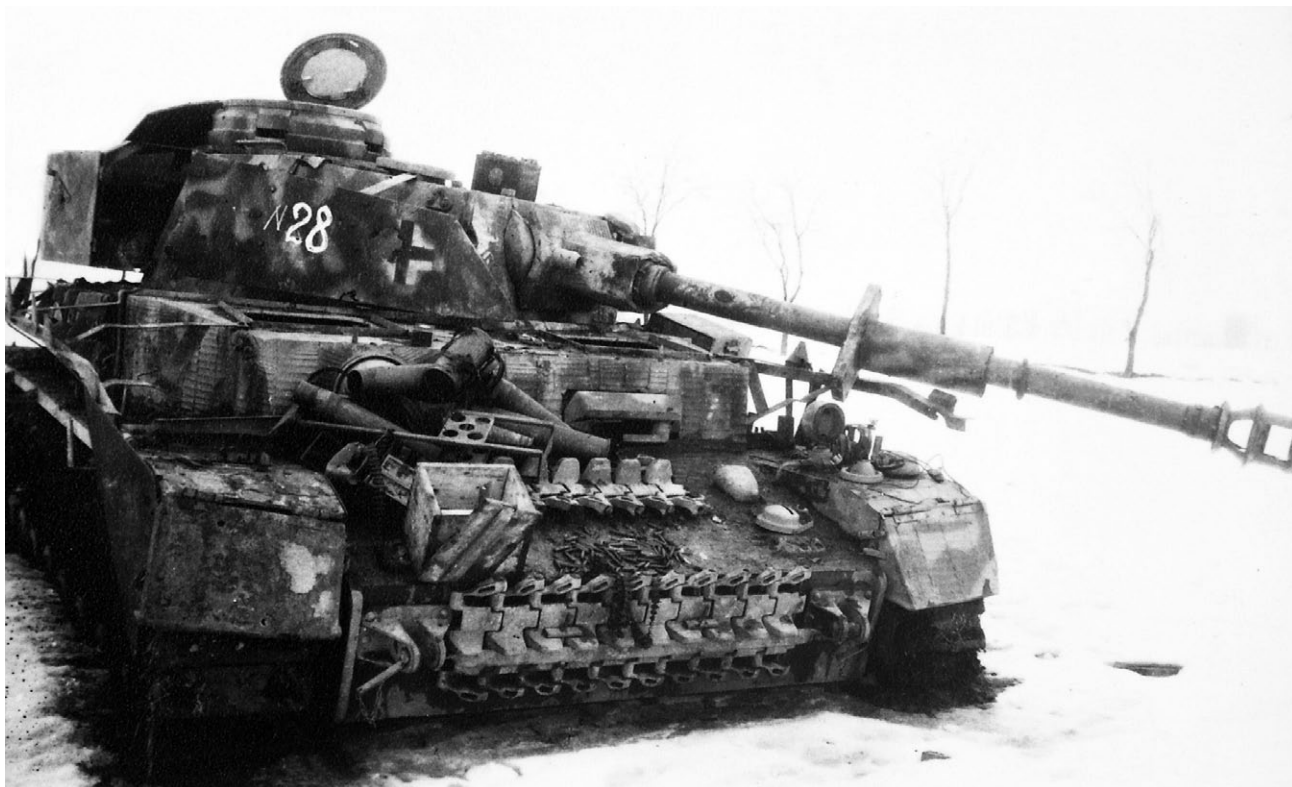
Немецкий танк Pz. IV Ausf. H, подбитый советской артиллерией. Район озера Балатон, февраль 1945 года. Хорошо виден камуфляж машины, а также запасные траки на переднем и верхнем листах корпуса.

ная открытая местность с абсолютными высотами от 100 до 230 м. В этом районе имеется хорошо развитая сеть шоссе и грунтовых дорог, большинство которых сходятся в районе Тата, образуя здесь крупный узел дорог. Именно за выход в этот район развернулась борьба после завершения окружения Будапешта.