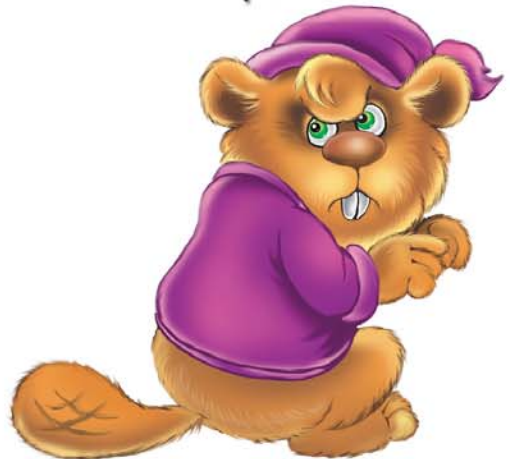
БОБЁР БОБРОВИЧ- ГРУЗЧИК