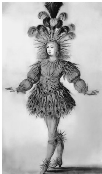
Балетный костюм Людовика XIV в роли Апполона

Первые постановки, в которых объединились пение, слова и танцы, появились во Франции в XVI в. Часто в балетах участвовали не артисты, а придворные, члены королевской семьи и даже сам король. Так, король Франции Людовик XIV выступал на сцене до пятидесяти с лишним лет ( см. рис.), мастерски исполняя медленные, слегка усложнённые бытовые танцы. Французские артисты обычно следовали в костюмах придворной моде, пока в XVIII в. придворная танцовщица Мари Камарго не укоротила немного юбку и не отказалась от каблуков. Великая французская революция (1789—1794) упразднила громоздкие костюмы: в балете появились специальные трико и лёгкие туники, подобные античным. Пачка — пышная короткая многослойная юбка — появилась в 1839 г.: её сделали по рисунку художника Э. Лами для балерины Марии Тальони.