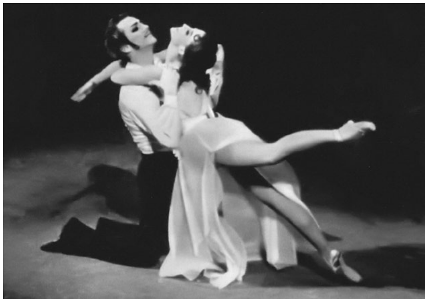
Анна — М. Плисецкая, Вронский — М. Лиёпа

Театр. В ложах собрался весь цвет петербургского общества. Появляется Анна. На сцену, где поёт примадонна, никто не смотрит: все лорнеты и бинокли направлены на