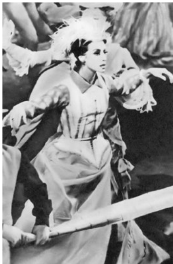
Анна — М. Плисецкая

одна, Анна понимает, что ничто её уже не спасёт: «Поздно, поздно, уж поздно...»