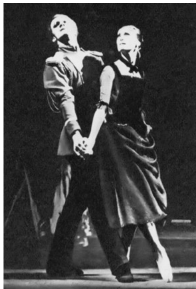
Анна — М. Плисецкая, Вронский — М. Лиепа

Кабинет Каренина. Алексей Александрович ждёт жену. Входит Анна. Каренин хочет предостеречь её от необдуманных поступков. Оставшись