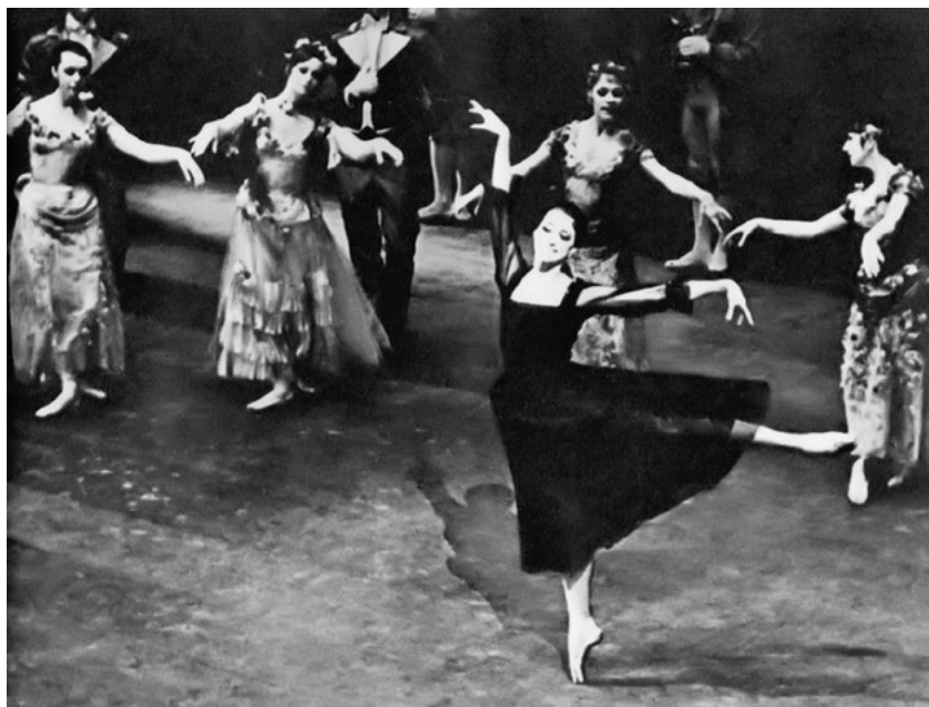
Анна — М. Плисецкая

Балет был написан специально для М. Плисецкой; сюжет ограничен лирико-драматическими взаимоотношениями главных героев произведения Л. Н. Толстого — Анны и Вронского: от их знакомства до трагической гибели Анны. Премьера состоялась в Большом театре в Москве 10 июня 1972 г.; одним из балетмейстеров была Плисецкая. Роли исполняли: Анна — М. Плисецкая, Вронский — М. Лиёпа, Каренин — Н. Фадеечев.