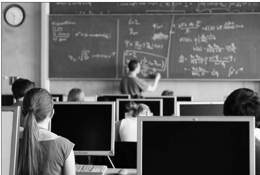
Рис. 1.1. В современных школах происходит смешение аналоговых и цифровых технологий

Помните также о других точках соприкосновения продукта или компании с тем, кто вступает с ними во взаимодействие. В конечном счете на формирование бренда компании влияют многие факторы, а отношения потребителя с брендом не ограничиваются рамками экрана компьютера или мобильного телефона. Даже самый лучший дизайн сайта не сможет компенсировать плохую репутацию службы поддержки и не заметит чувство удовлетворения качественным дизайном упаковки.