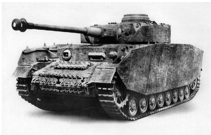
Pz.IV Ausf.H с полным комплектом бортовых экранов и «циммеритным» покрытием

Но вот что касается самоходок типа Nashorn, то их включение в подобные списки вряд ли оправдано, как и других боевых машин, относившихся к классу так называемых «самоходных лафетов». То же самое можно сказать и о формально не принадлежавших к нему самоходках семейства Marder. Штурмовые орудия хотя бы могли воевать по танковому, а эти машины были артиллерийскими установками, пушками на самоходном гусеничном шасси и не более того.