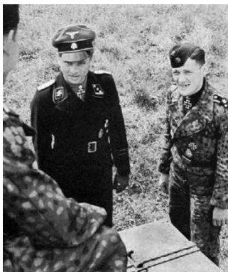
Бальтазар Воль (справа) и Михаэль Витман

противника и за 22 дня боев смог довести число подбитых танков до 132».