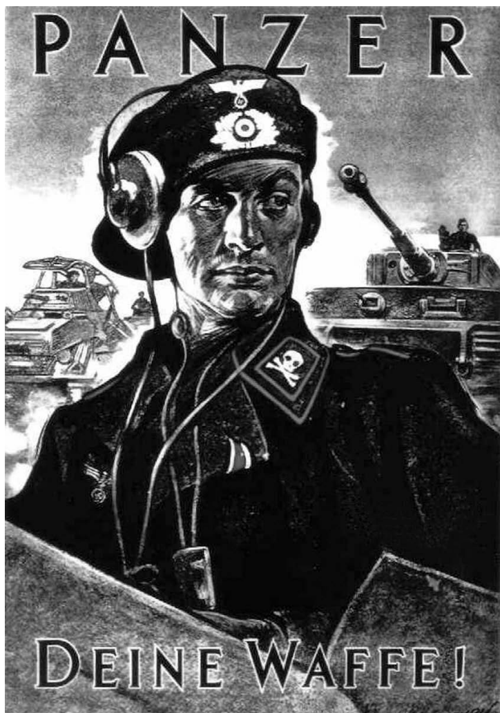
«Танк – твое оружие!» Немецкий плакат времен Второй мировой войны