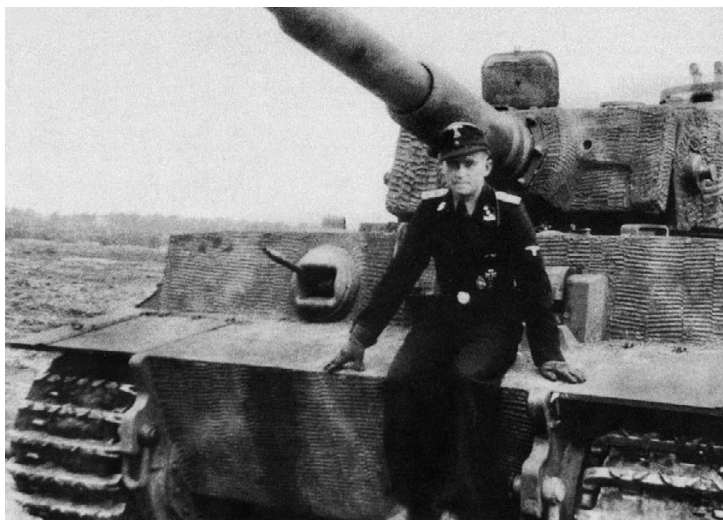
Унтершарфюрер СС Вили Фей у своего «Тигра». 102-й тяжелый танковый батальон СС, 1944 год

сываться на Витмана и дважды учитываться не должны. Таким образом, Бальтазару Волю надо оставить 19 побед, которые он одержал, став командиром танка, и отправить в конец списка.