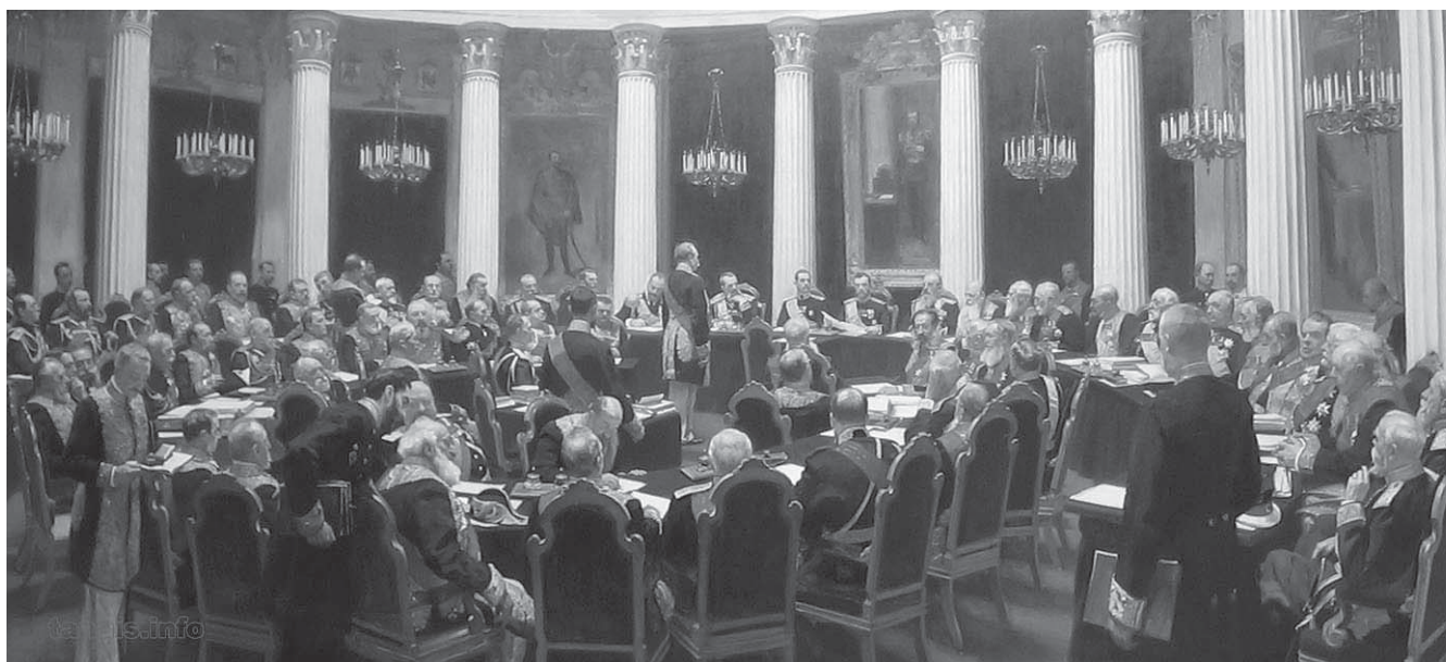
Илья Репин. Торжественное заседание Государственного Совета 7 мая 1901 года в честь столетнего юбилея со дня его учреждения.