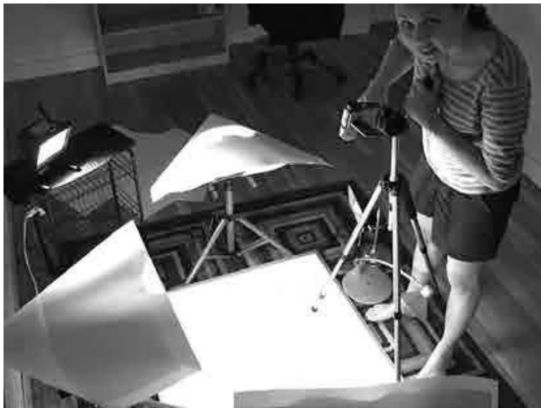
Сати в нашей второй студии, лето 2007 года

В апреле мы разместили его на YouTube, и ролик сразу стал хитом. В первый день его просмотрели десятки тысяч раз, мы получили массу электронных писем, комментариев и отзывов на нашу работу в блоге. Люди призывали нас продолжать делать видеоролики. Это был один из лучших дней в моей жизни. Наше объяснение завоевало такую популярность, потому что помогло людям понять, что такое канал RSS, позволило посмотреть на проблему с иной точки зре-