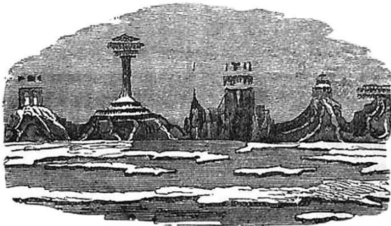
Рисунок, сделанный У. Скоресби у берегов Гренландии в 1820 г.

На пустынном берегу возвышались дворцы, храмы, замки, колонны, руины и другие строения какого-то неизвестного древнего города. Шпили колоколен, крыши домов, зубцы на крепостных стенах были настолько отчетливо видны, словно их недавно нарисовала рука мастера. Над всем этим архитектурным ансамблем прямо в воздухе висели холмы, словно их удерживала какая-то невидимая таинственная сила. Едва Скоресби наносил на лист рисунок одного строения, как его сменяло другое, постепенно принимая новые очертания и цвет. Днем, на глазах у капитана, происходила удивительная фантасмагория: храм переходил в замок, колонна