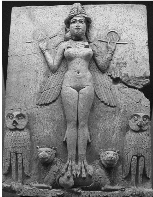
Рис. 5. Изображение вавилонской зооморфной богини с птичьими ногами (Иштар, Астарта, Лилит или Царица ночи), 2025–1750 гг. до н. э.

В древнегреческой, а затем римской истории наблюдается противостояние и вместе с тем сотрудничество мужчин и женщин, известное нам под видом влияния на исторических деятелей гетер, впоследствии куртизанок, то есть обаятельных, интеллектуально развитых, образованных в духе своего времени женщин, духовно максимально приближенных к мужчинам, влияющих на их жизнь и принимаемые решения, помимо жен. Из последних известна Ксантиппа, сварливая жена Сократа, в противоположность Диотиме из Мантенеи, выступавшей соучастницей встреч, бесед и размышлений Сократа, Платона и иных участников древнегреческих симпозиумов, или гетера Аспазия, ставшая женой полководца Перикла, Фрина, вдохновлявшая Праксителя и Апеллеса, и Тайс Афинская из окружения Александра Македонского (по роману Ефремова). В римской истории наиболее известна своим развратным поведением Мессалина, жена императора Клавдия (рис. 6, 7).