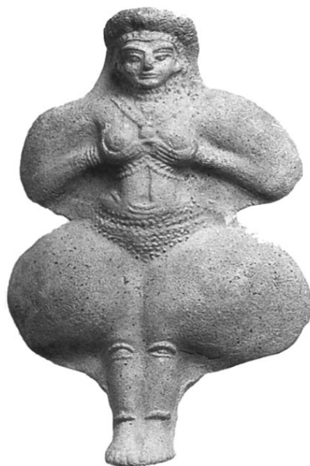
Рис 4. Иштар (Астарта)