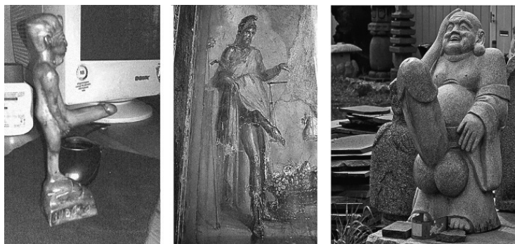
Рис. 2. Боги плодородия: Египет (слева), Древняя Греция (в центре), Япония (справа)

Смена матриархальной семьи патриархальной сопровождалась не только сменой главы рода, но и обособлением пар внутри племени – появлением «частной собственности», права не только на добычу на охоте, но и на желанную представительницу рода. Впрочем, появление семьи, т. е. разделение рода на отдельные образования, остается достаточно темным местом в истории человечества. Однако несомненно, что именно «патриархальная» семья становится доминирующей в последующие тысячелетия человеческой истории.