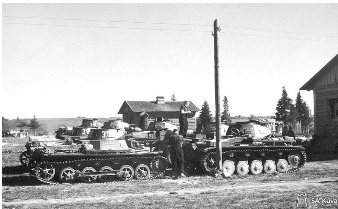
Танки Pz.I и Pz.II из 3-й роты 40-го отдельного танкового батальона.

4 июля 1941 года в 1.00 ночи по берлинскому времени, позицию 7-го полка группы СС «Норд» атаковали советские танки. Атака боевых машин была отражена зенитной батареей, но командир полка сообщил по телефону ошибочную информацию, что танки все-таки прорвались. Началась паника, которая быстро распространилась по всему подразделению, в результате полк в полном составе бросил позиции и побежал, причем беглецов смогли остановить только в глубоком тылу.