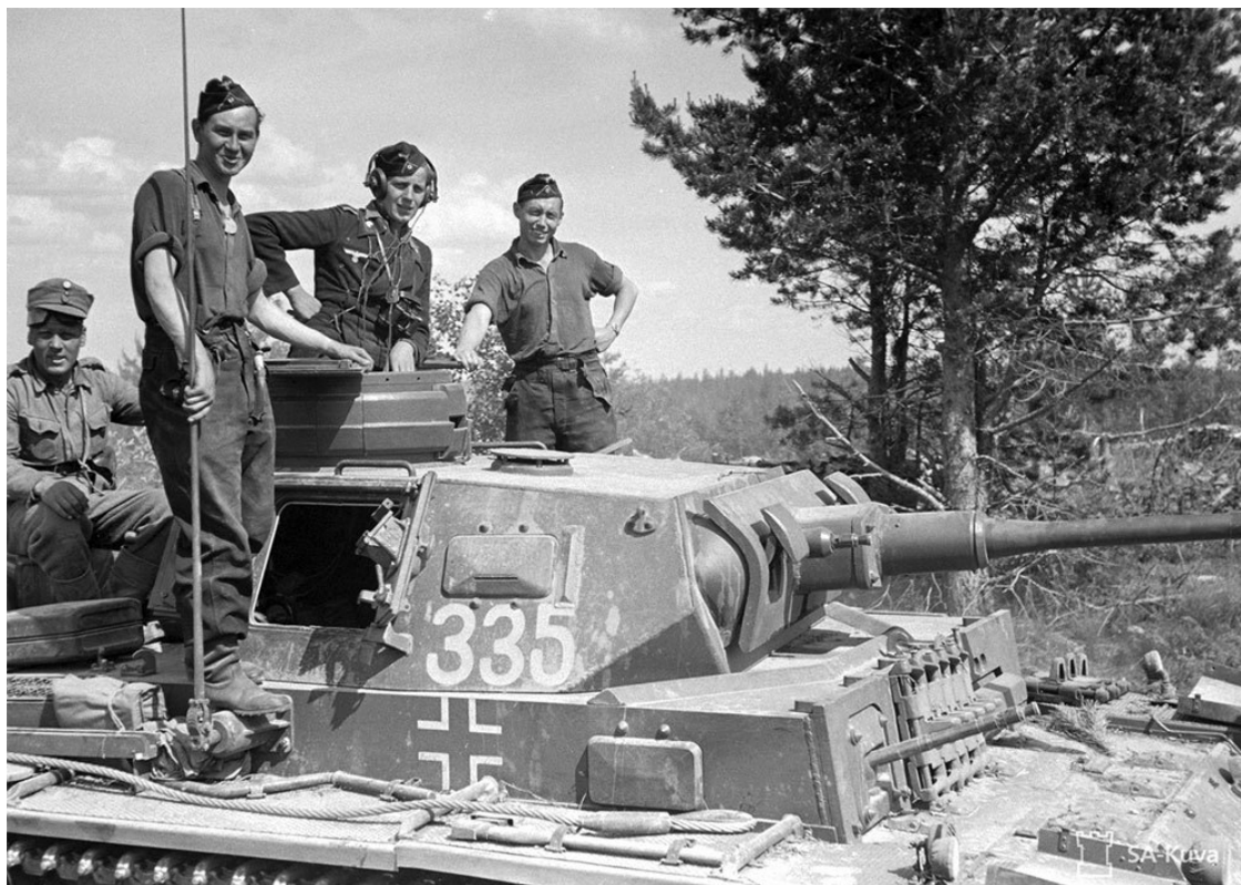
Немецкие танкисты на Pz.III из 3-й роты 40-го отдельного танкового батальона.

С фронта продолжали настойчиво атаковать 6-й и 7-й полки группы СС «Норд». Основной удар они наносили по обороне 715-го стрелкового полка 122-й дивизии. Начались небольшие танковые бои между группами танков (три-пять боевых машин) и отдельными танками 2-го танкового батальона и 40-го батальона немцев. Советские и немецкие экипажи начали использовать тактику танковых засад.