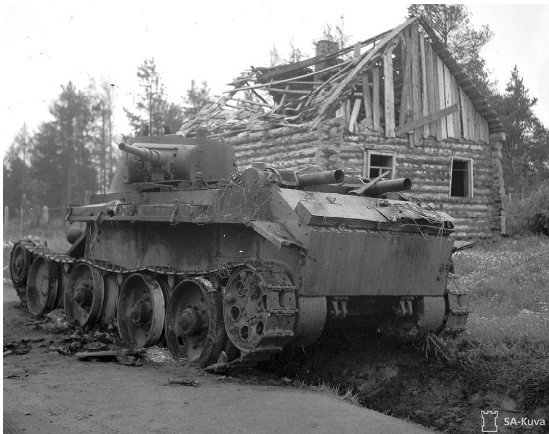
Сгоревший легкий танк БТ-7 из 1-й Краснознаменной танковой дивизии. Район Саллы.

5 и 6 июля немцы смогли переломить ход боя в свою пользу. Полки 169-й пехотной дивизии практически завершили окружение станции Саллы. Понимая, что 122-я стрелковая дивизия оказалась в тяжелом положении, советские танкисты стали наносить контрудары по прорвавшимся немецким войскам.