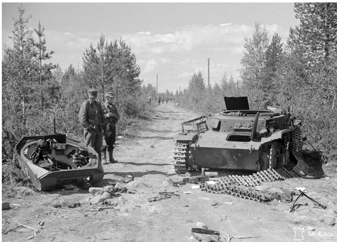
Уничтоженный танк Pz. III из 3-й роты 40-го отдельного танкового батальона.

211-й отдельный танковый батальон, являлся самым сильным немецким танковым подразделением на данном участке фронта – он имел 44 трофейных французских танка, модернизированных под стандарт «панцерваффе»: 12 танков Pz.Kpfw. S35 739 (f), бывшие Somua S-35, и 32 танка Pz.Kpfw. 38H 735 (f) бывшие Hotchkiss H 35/39. Для легких танков БТ-7 это был очень грозный противник, но слабые орудия не позволяли немецким танкистам эффективно бороться с советскими полевыми фортификационными сооружениями.