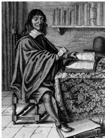
Рене Декарт (1596 – 1650)

В 1612 году юный Декарт покинул родной город и более 10 лет провёл, путешествуя по Европе, ведя переписку с учёными разных стран и размышляя о проблемах бытия. В 1628 году он поселился в Голландии, где написал серию работ, которые надолго определили направление исследований проблемы души и тела. Первый трактат Декарта «О человеке» 2 [1] был завершён в 1633, как раз накануне процесса над Галилеем. О том, что Галилей оказался в застенках инквизиции, Декарт узнал от своего друга Марен Мерсенна, с которым состоял в переписке. Декарт немедленно отказался от идеи обнародовать уже готовый трактат, и поэтому первое в мире исследование по физиологической психологии было опубликовано только после смерти его автора.