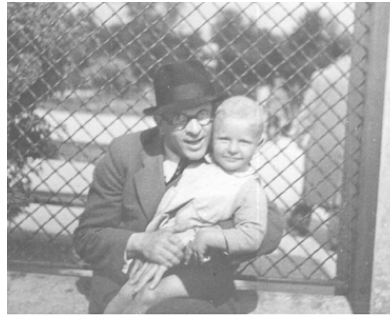
З батьком. 1941 р.

Вертаючись до тих розкошеств, у яких я зустрів пору свого раннього дитинства: у вересні Варшаву почали бомбувати, і надмірним турботам про гігієну настав кінець. Коли повиходили з ладу водогони, мама в ложечці кип'ятила над свічкою воду з калюжі – можливо, саме завдяки цьому я не виріс алергіком.