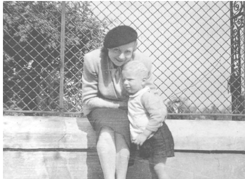
З мамою. 1941 р.

Та мене водночас і щиро смішить, і щиро засмучує снобізм тих, хто намагається вивищитися, підкреслюючи своє шляхетське походження, спорідненість з аристократами, гріючись у промінні заслуг предків. Це реакція на постійний суспільний пресинг у ПНР: тоді людям накидали думку, що традиція не має жодної ваги і треба викреслити її з пам'яті. Те саме діється за океаном. У Сполучених Штатах відшукувати своє коріння стало модним лише у 1960-х роках, причому й донині в американській ментальності всі ці речі не вкоренилися. Якщо чистильник взуття може стати мільйонером – про історію можна забути.