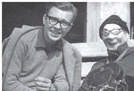
Кишиштоф Зануссі – студент другого курсу Лодзинської кіношколи. 1963 р.

Був у мене й ще один пов'язаний з цим епізод. Колись я публічно – у ЗМІ – зізнався, що, хоч я й чую іноді похвали, та все ж не люблю своєї манери говорити, сам відчуваю цю штучність, що криється за старанністю, і знаю, що деколи це звучить претензійно. Коротше кажучи, сам я не люблю в собі того, за що мене часом хвалять. У 1990-ті роки відомий сатирик, пан Войцех Манн, запросив мене на свою телепрограму й на очах у глядачів запитав, чи правда те, що мені не подобається моя манера говорити. Я відповів, що так і є. Тоді він припустив: може, в такому разі я волів би помовчати? Я кивнув. «То помовчмо», – запропонував він. І на якийсь час у студії запанувала тиша. Нарешті пан Манн поцікавився, чи добре мені мовчалося. «Чудово», – зізнався я, й на цьому моя участь у програмі була завершена. Мовчання – золото, як каже прислів'я; але точно не в засобах масової інформації! Жарт пана Манна був спрямований не проти мене, а проти мас-медіа. Без сумніву, це був зухвалий жарт. Пан Манн був тоді настільки популярним, що міг собі дозволити багато чого.