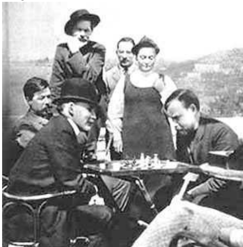
Рис.1.4. Ленин играет в шахматы с Александром Богдановым, 1908 год

Во время революции 1905 года Богданов-Малиновский возглавлял боевую техническую группу большевистской партии и считался настоящим коммунистом. Однако после поражения этой первой революции в России дали о себе знать общеполитические разногласия с ортодоксами-материалистами, которых представлял сам Владимир Ленин. Дело в том, что Богданов отказался от чистого материализма, не приняв аксиому о независимом существовании материальных объектов и доказывая, что если человечество, изменяя мир, способно к теоретическому исследованию и практическому воспроизводству любого вида материи, то нет никакой необходимости в концепции материи, которая стоит над научным познанием. Ленин, наоборот, утверждал, что философствования Богданова – это уход в идеализм, поскольку через человека материя познает материю и не более того.