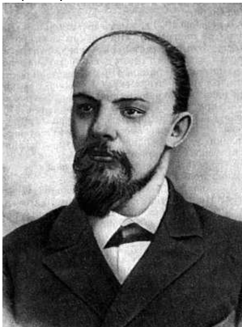
Рис.1.3. Владимир Ульянов (Ленин) в 1897 году

Марксизм оказался очень привлекательным для «недоучек» – для тех, кто не сумел получить полноценное высшее образование. Сам Ленин – экстернант, с первого курса университета он был исключен. Другой марксист-теоретик – Николай Бухарин – дальше первого курса университета тоже не пошел, революционная деятельность помешала. Говорливый Лев Троцкий закончил всего лишь реальное училище.