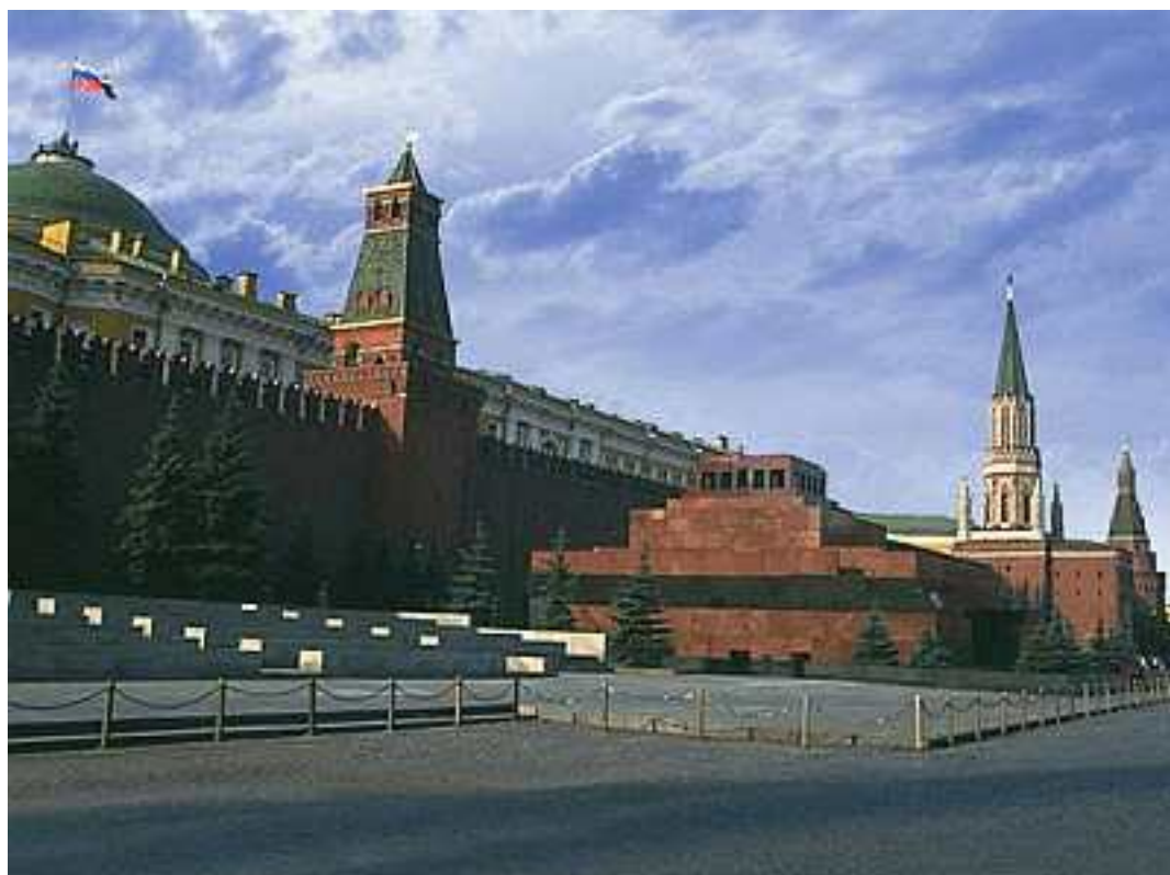
Рис.1.10. Современный вид на Красную площадь

Так, в книге «Омоложение и продление личной жизни» (1922) автор подробно рассматривает вопрос пересадки половых органов свежих трупов живым людям с целью омоложения последних.