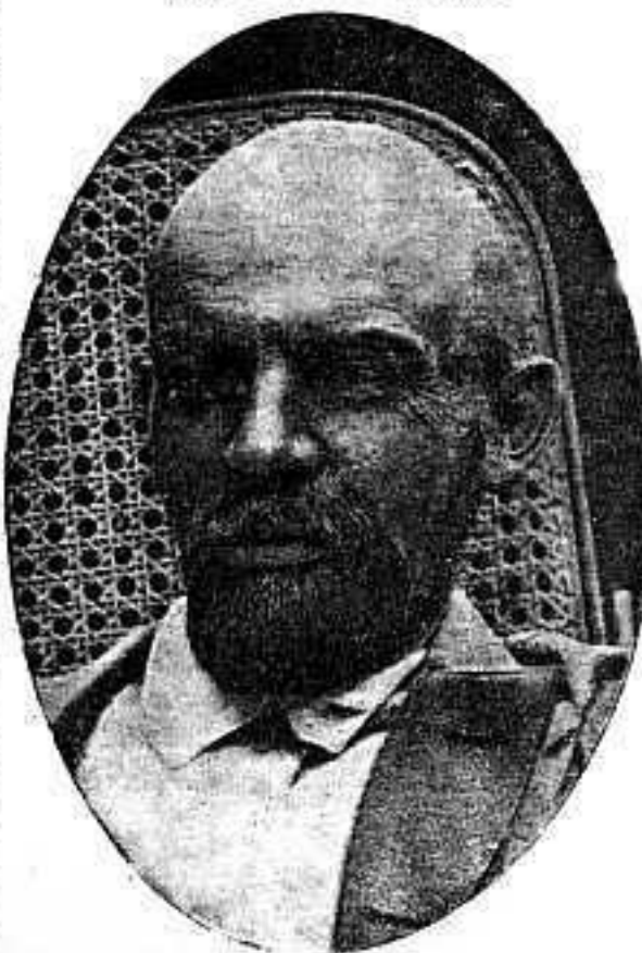
Снимок Владимира Ильича Ленина, сделанный в августе 1920 г.

спасибо тебе! Ты, кто спасаешь нас трудом, тобой есть, тобой драги, тобой не измерить, страсти, тобой не быть достоинством! Ты ты, кто спасаешь нас всем, всем, всем! Очисти нас всех!