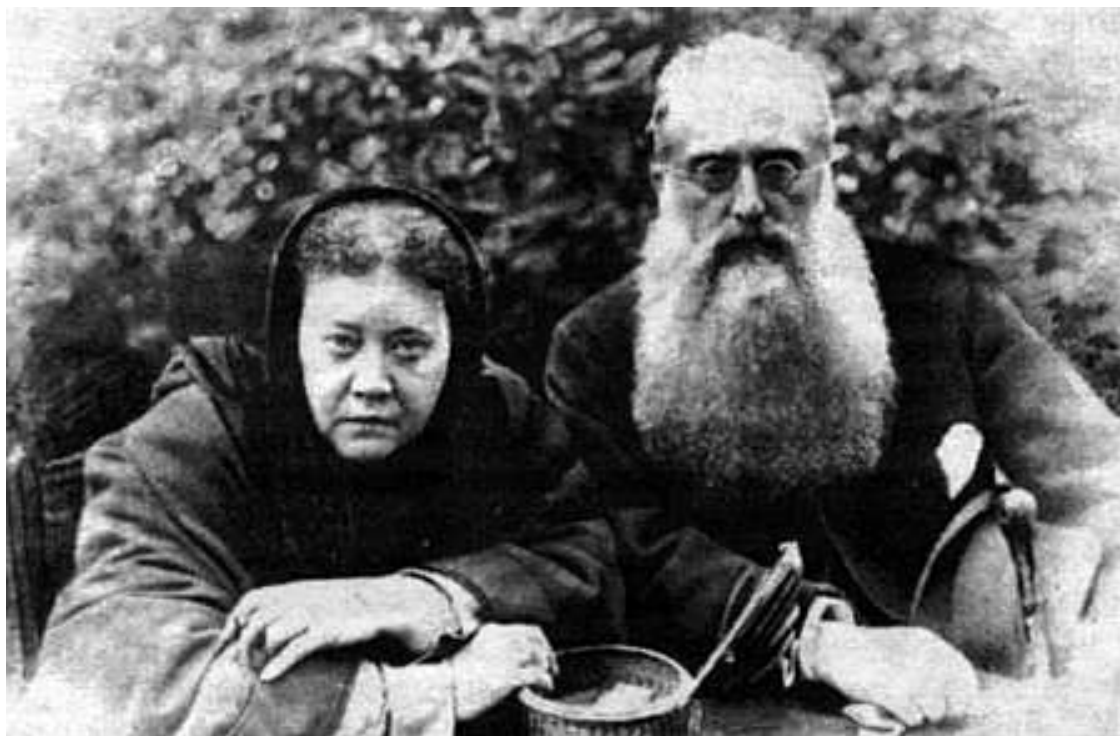
Рис.1.2. Елена Блаватская и Генри Олькотт – основатели Теософского общества

Поскольку теософия Блаватской представляла собой развернутую компиляцию из множества религиозных представлений – как западных, так и восточных, – она была близка по духу учению Маркса, который тоже претендовал на формирование единого взгляда на окружающий мир, на его происхождение и развитие, основанный на множестве других философских учений, появившихся еще до Маркса. Вот почему, чувствуя «революционное» родство, теософы неоднократно посылали своих эмиссаров в Советскую Россию (а бывало, что те ехали сами) в надежде найти свое место в здании коммунистической идеологии, насаждавшейся с момента прихода большевиков к власти. Но впервые «контакт» был установлен еще в семье Маркса.