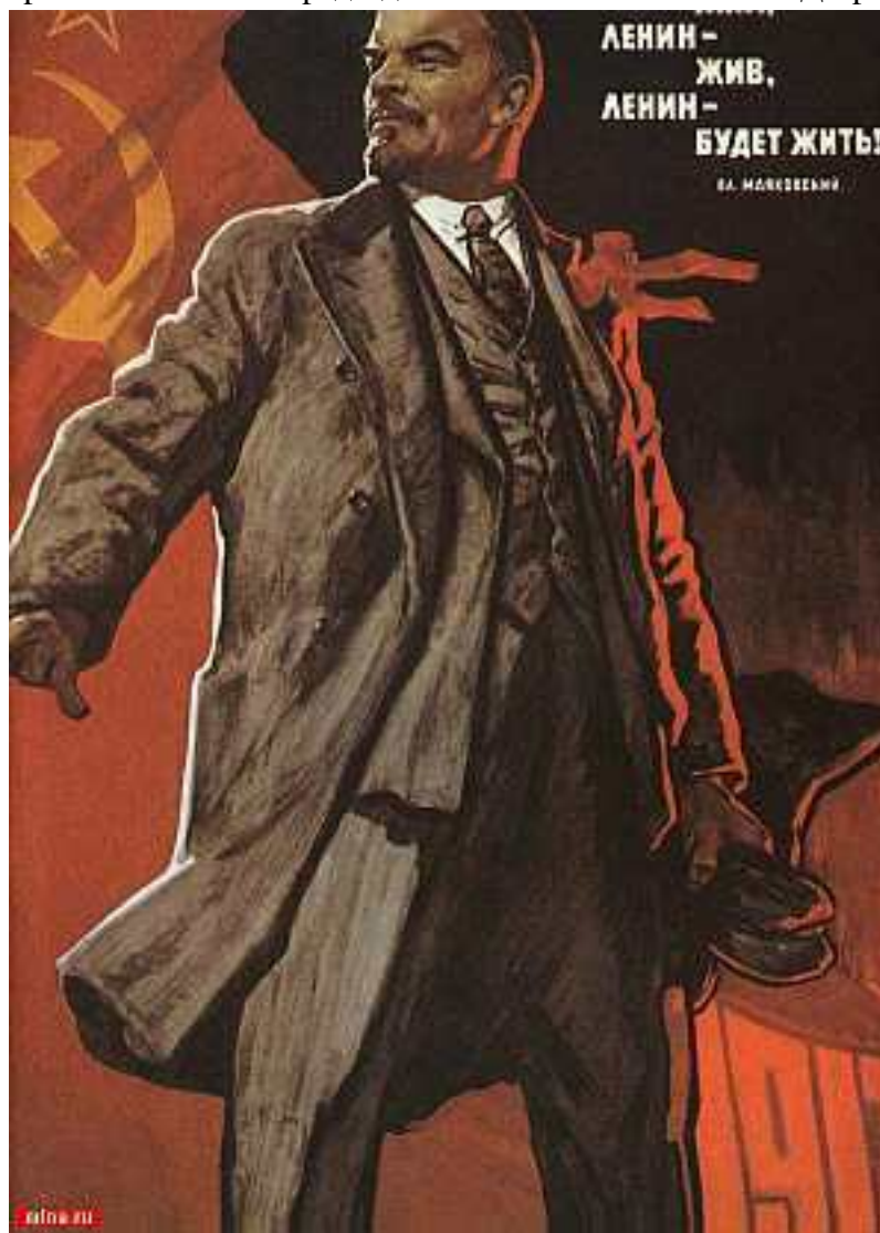
Рис.1.7. Советский плакат «Ленин – будет жить!»