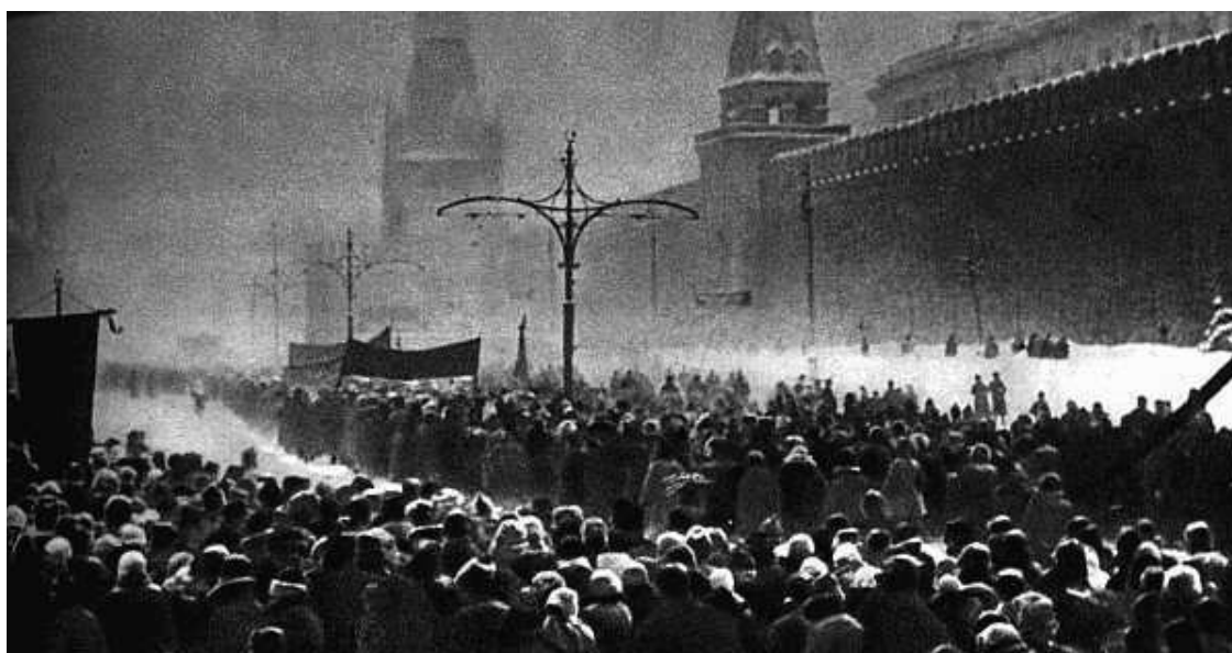
Рис.1.8. Прощание с Владимиром Лениным

Поздние советские источники по этому поводу сообщали, что только с 23 по 25 января были получены тысячи писем и телеграмм с просьбой трудящихся увековечить тело Ленина. Но при этом 27 января телеграфные агентства Советского Союза сообщили: «Встаньте, товарищи, Ильича опускают в могилу!» Опять же в официальном сообщении – ни слова об увековечении тела в мавзолее.