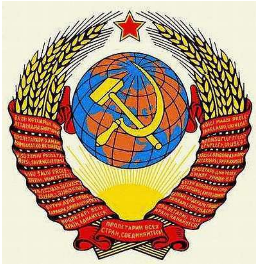
Рис.1.6. Герб Союза Советских Социалистических Республик (СССР)