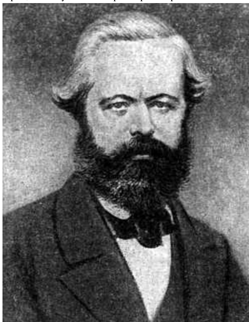
Рис.1.1. Карл Маркс в 1840-е годы

Настоящее имя Карла Маркса – Мардохей Леви. Ради выгод общественного положения юный Мардохей Леви, несколько поколений предков которого по мужской линии являлись раввинами, был окрещен и получил имя Карл Генрих Маркс.