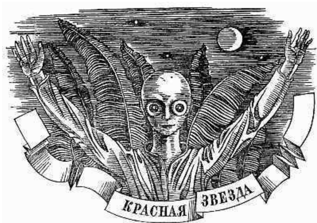
Рис. 1.5. Марсианин Александра Богданова (иллюстрация Г.Метченко к роману «Красная звезда», издание 1979 года)

«Был ноябрь 1907 года, – вспоминал старый большевик в рецензии, подписанной инициалами С.Д., – когда появилась “Красная звезда”: реакция уже вступила в свои права, но у нас, рядовых работников большевизма, всё еще не умирали надежды на близкое возрождение революции, и именно такую ласточку мы видели в этом романе. Интересно отметить, что для многих из нас прошла совершенно незамеченной основная мысль автора об организованном обществе и о принципах этой организации. Всё же о романе много говорили в партийных кругах».