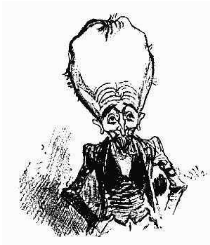
Рис.1.12. Люди будущего по Альберу Робиде (иллюстрация к роману «Электрическая жизнь», 1883 год)

Миф об особенностях мозга и черепа Ленина не был плодом личной фантазии коммунистических лидеров. Они были достаточно начитанными людьми, знакомыми с современными им футурологическими концепциями и фантастическими романами. Именно в произведениях фантастов они могли почерпнуть идею о том, что человек будущего будет обладать огромной головой, вмещающей невероятно развитый мозг.