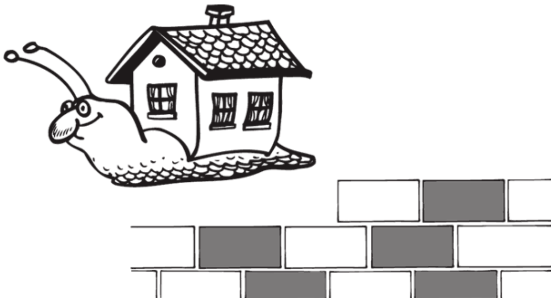
Рисунок домика, где я живу: